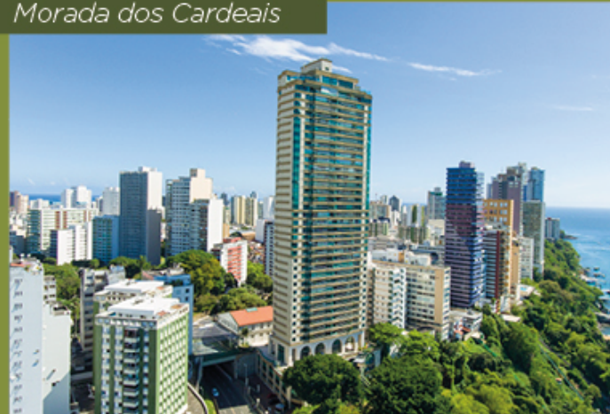
Morada dos Cardeais

Ao comprar um imóvel para moradia própria, para fins empresariais ou como investimento, você analisa detalhadamente uma série de fatores - da localização ao tamanho em metro quadrado, da qualidade da construção às características de proteção ao meio ambiente, das possibilidades de decoração à valorização do patrimônio.