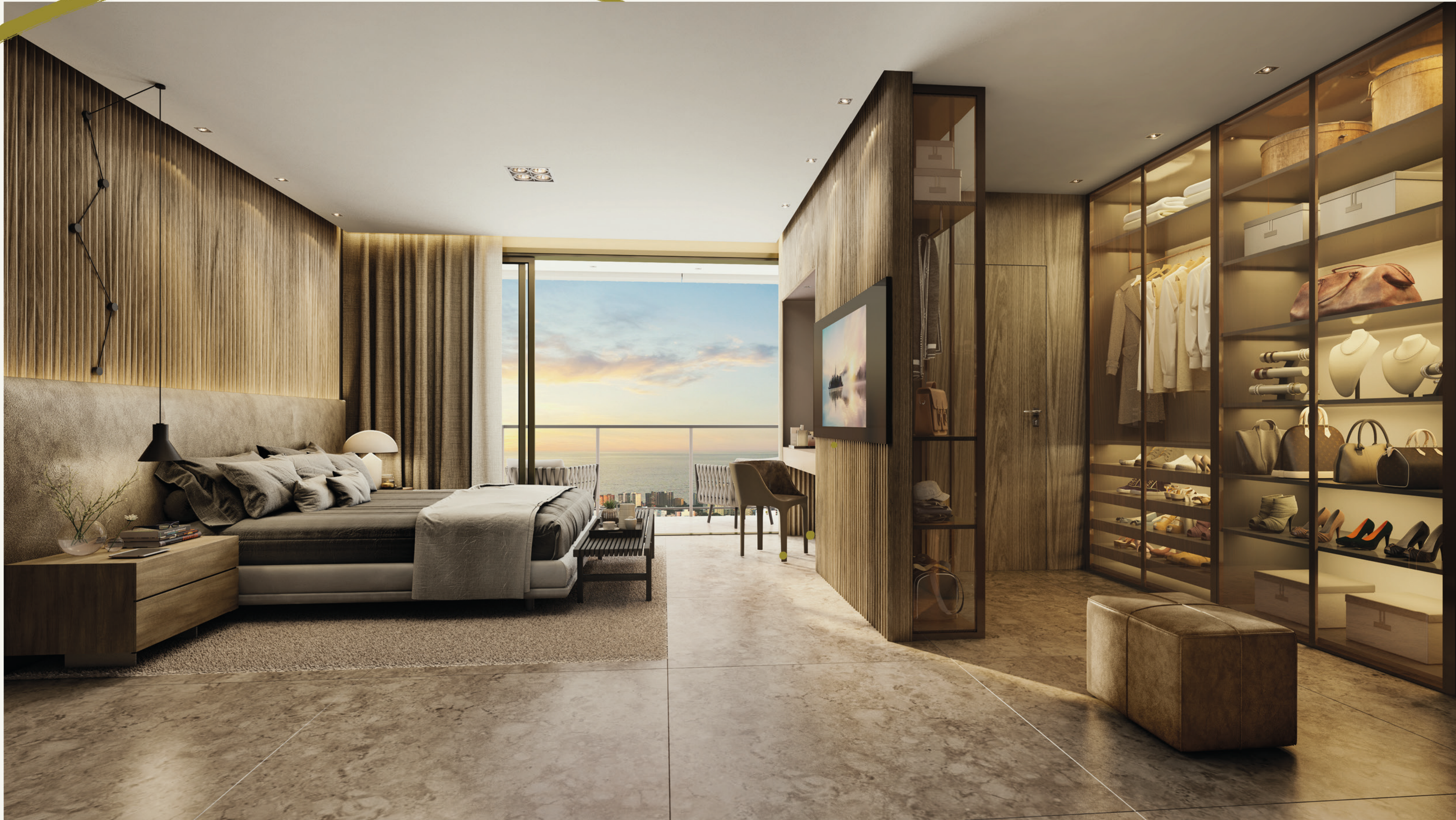
Perspectiva Ilustrada da Suíte Master com Closet