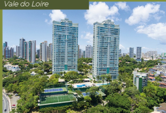
Vale do Loire

Pautada pelo compromisso com a ética, integridade e transparência, a OR trabalha para assegurar a satisfação dos clientes a partir de seu empenho com a qualidade e a sustentabilidade e com a seletividade na escolha do melhor terreno e produto.