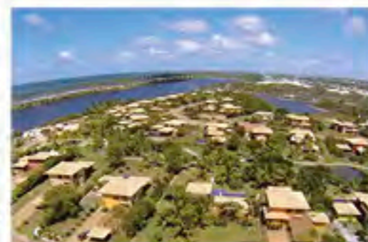
Casas de Sauipe