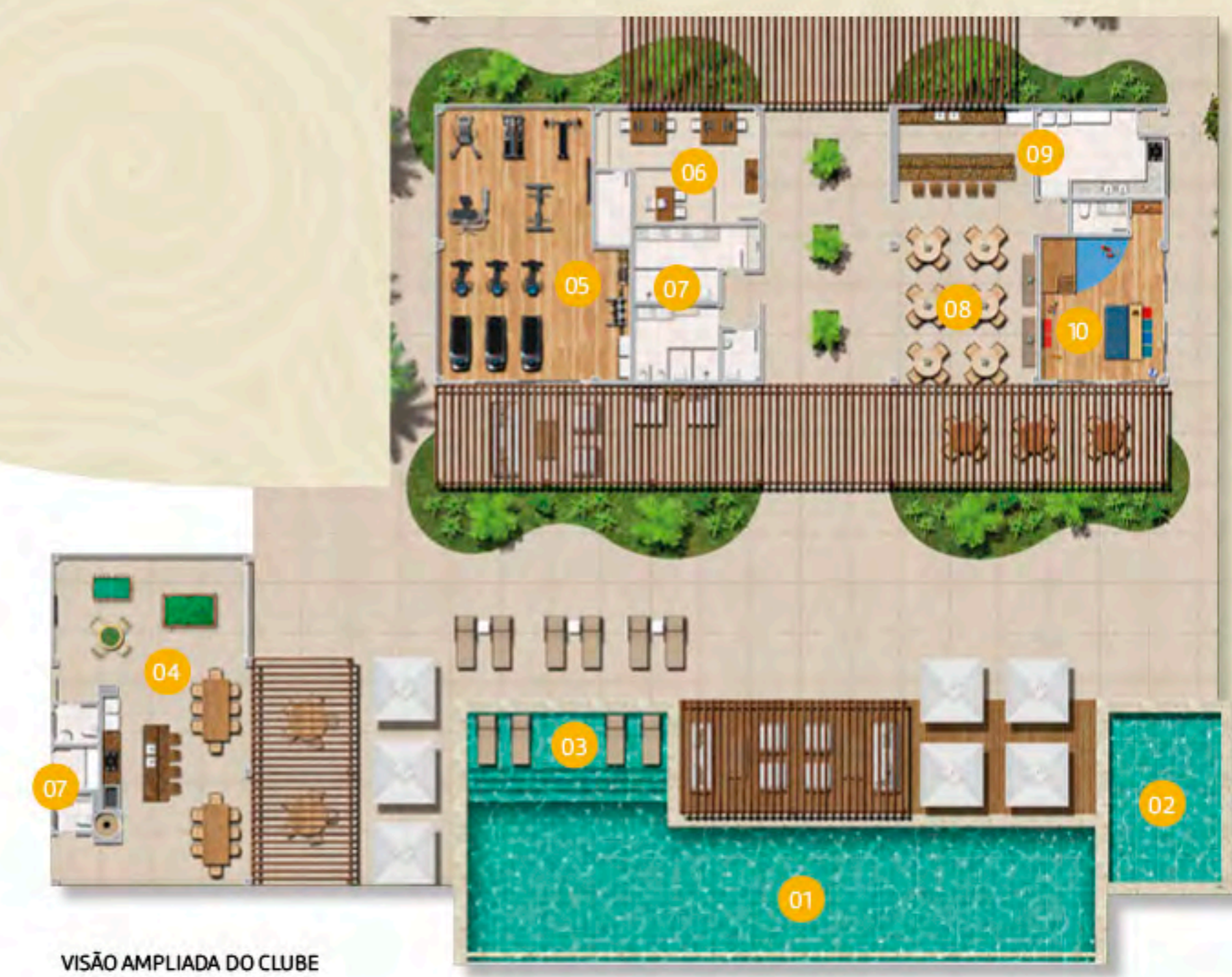
VISÃO AMPLIADA DO CLUBE