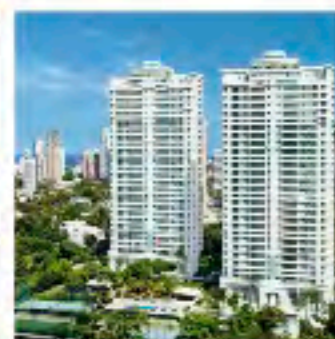
Vale do Loire