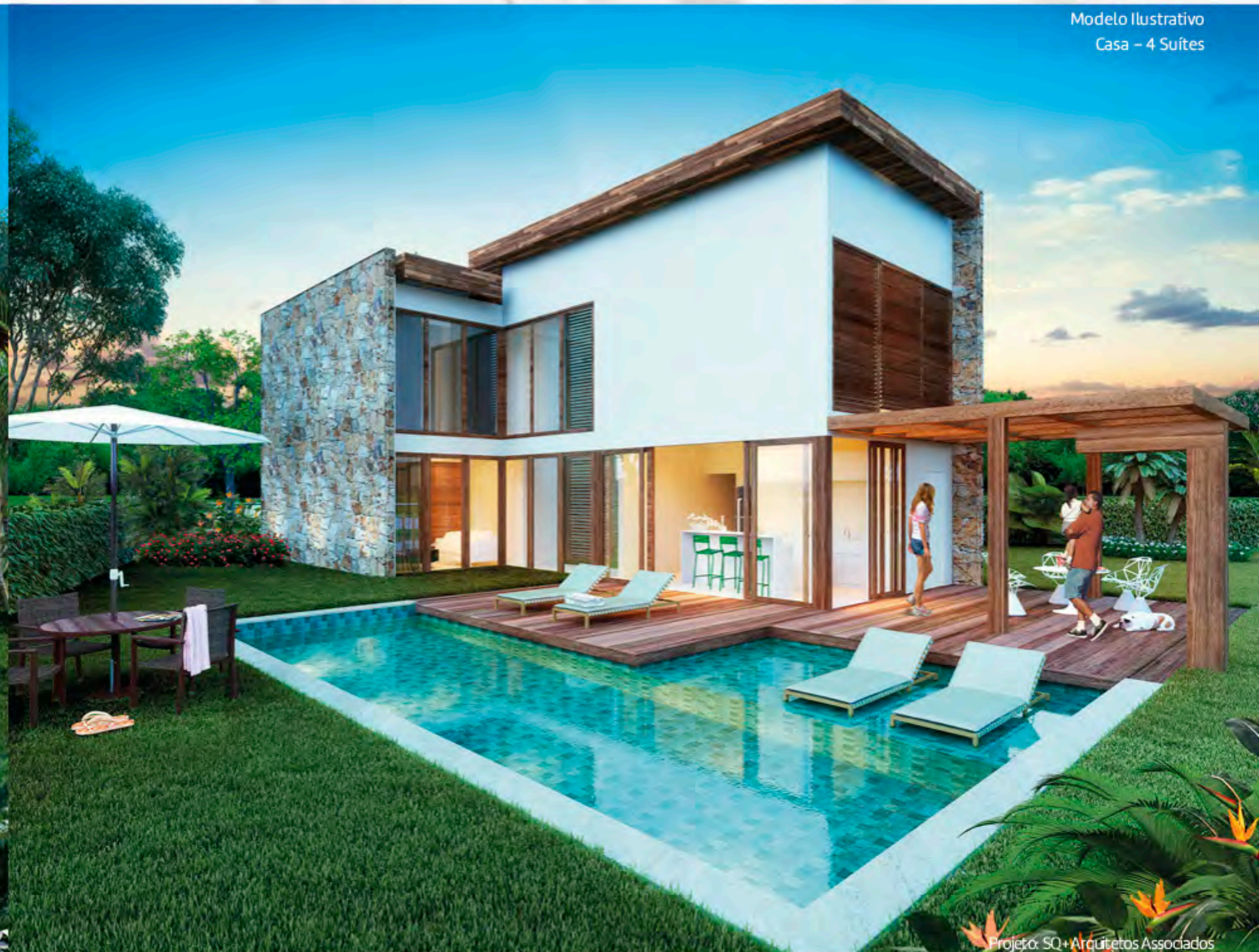
Projeto: SQ+ Arquitetos Associados

Todas as imagens e perspectivas apresentadas constantes das plantas humanizadas, dos catálogos, das perspectivas de divulgação e de todas as demais artes deste empreendimento, seja referente à área comum, seja referente às unidades autônomas, são meramente ilustrativas. As unidades autônomas são distribuídas sob a forma de frações ideais, sendo compostas de terreno. Caberá a cada condômino, após a implantação do condomínio, a construção e custeio de edificações nas unidades autônomas. A incorporadora não se responsabiliza, em hipótese alguma, pelos projetos (arquitetônico, de construção, de decoração, etc.) e pela edificação nas unidades autônomas, que deverão ser providenciados, realizados e garantidos exclusivamente por cada adquirente. Para edificar, reformar, reconstruir e demolir, os condôminos obedecerão os parâmetros e procedimentos legais e convencionais de construção na unidade autônoma. Os projetos e ilustrações são protegidos por sua legislação própria, sendo vedada sua reprodução, divulgação e utilização sem a devida autorização.