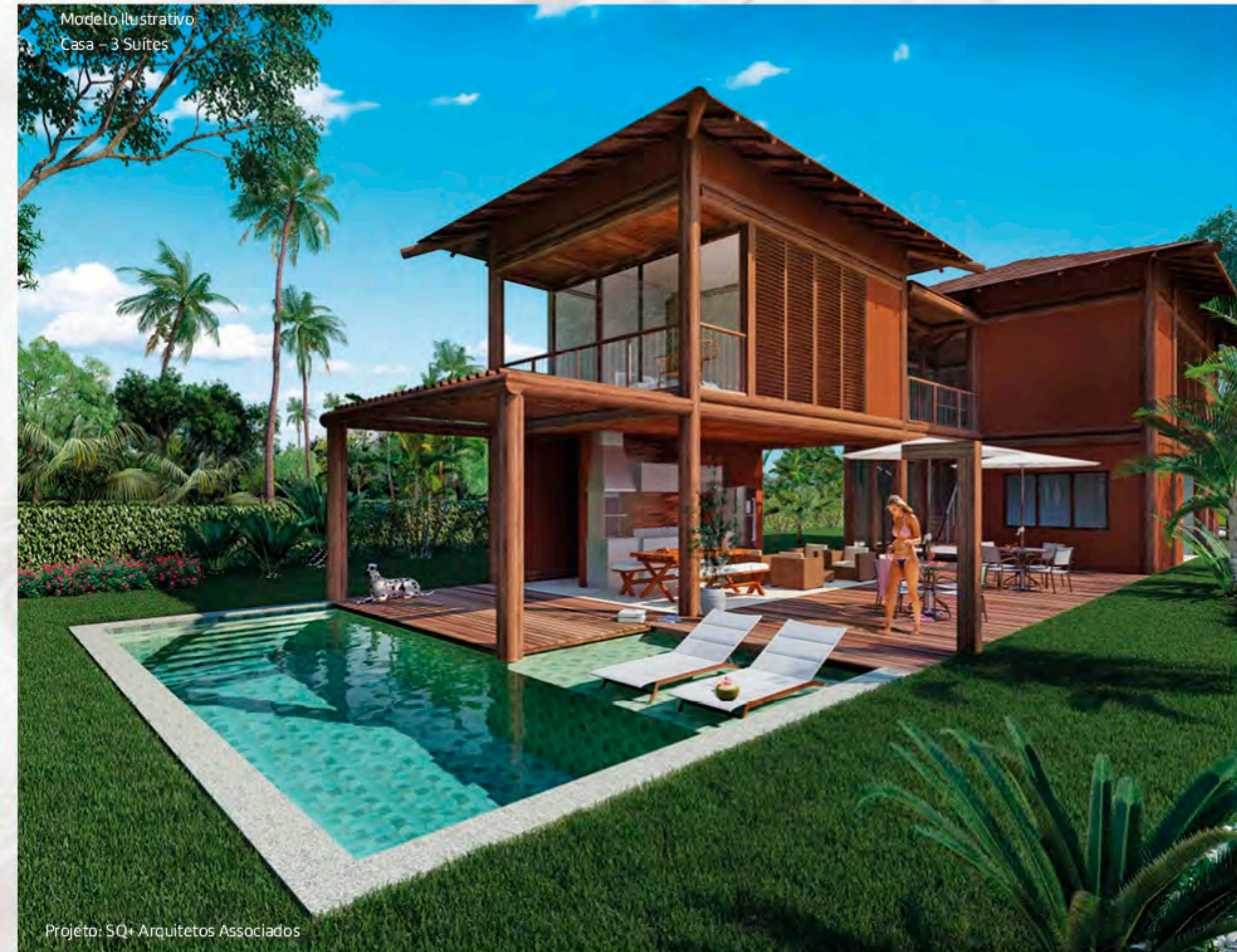
Projeto: SQ+ Arquitetos Associados

Todas as imagens e perspectivas apresentadas constantes das plantas humanizadas, dos catálogos, das perspectivas de divulgação e de todas as demais artes deste empreendimento, seja referente à área comum, seja referente às unidades autônomas, são meramente ilustrativas. As unidades autônomas são distribuídas sob a forma de frações ideais, sendo compostas de terreno. Caberá a cada condômino, após a implantação do condomínio, a construção e custeio de edificações nas unidades autônomas. A incorporadora não se responsabiliza, em hipótese alguma, pelos projetos (arquitetônico, de construção, de decoração, etc.) e pela edificação nas unidades autônomas, que deverão ser providenciados, realizados e garantidos exclusivamente por cada adquirente. Para edificar, reformar, reconstruir e demolir, os condôminos obedecerão os parâmetros e procedimentos legais e convencionais de construção na unidade autônoma. Os projetos e ilustrações são protegidos por sua legislação própria, sendo vedada sua reprodução, divulgação e utilização sem a devida autorização.