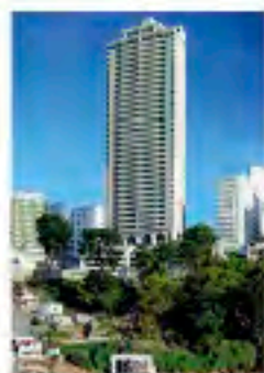
Marada dos Cardeais

Nós somos assim. Cada empreendimento é único, cada cliente é exclusivo.