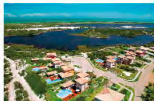
Quintas de Sauipe