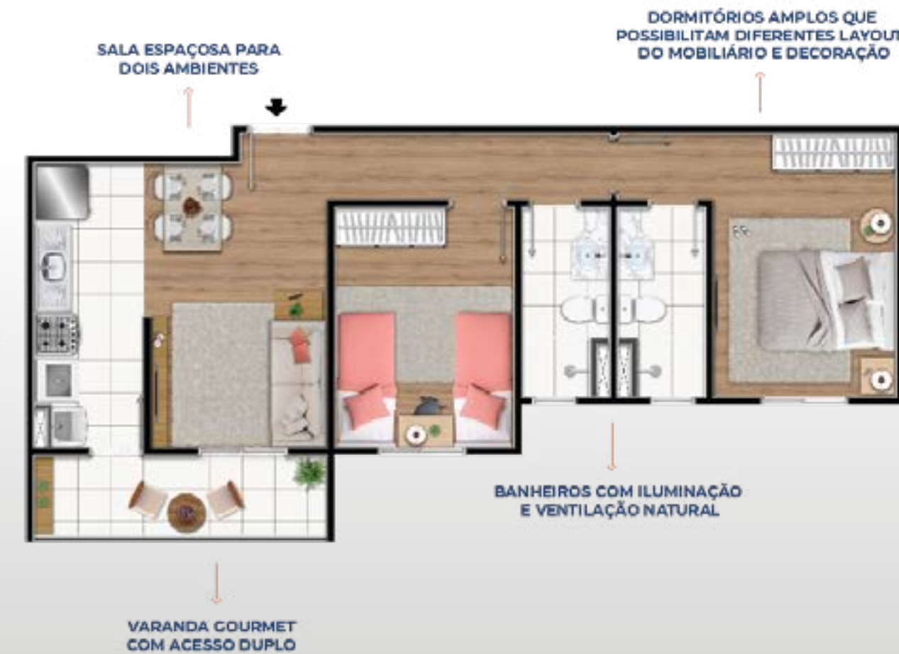
PLANTA TIPO MEIO: 54,46m 2