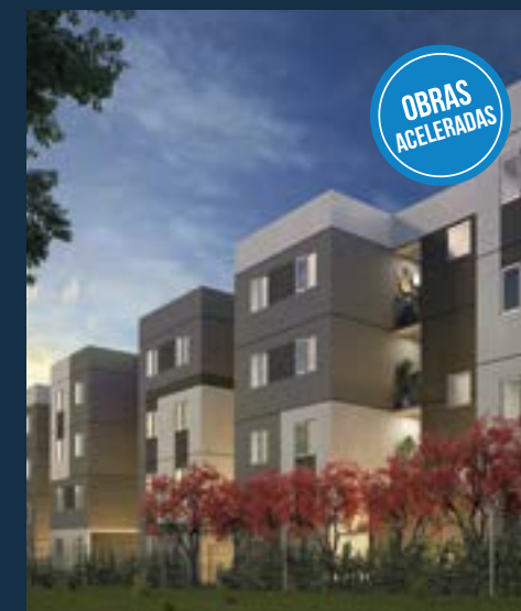
VARANDAS CAMPESTRE - PIRACICABA 85% Vendido - Obras Aceleradas