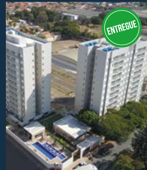
UNIQUE RESIDENCE - HORTOLÂNDIA 100% Vendido - Pronto para Morar