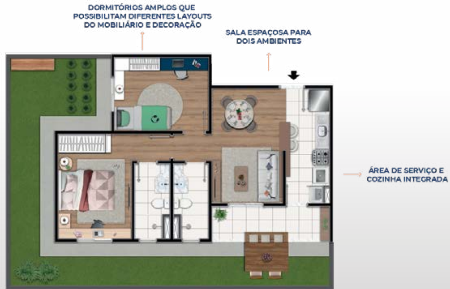
PLANTA GARDEN PONTA FRENTE: 84,19m 2