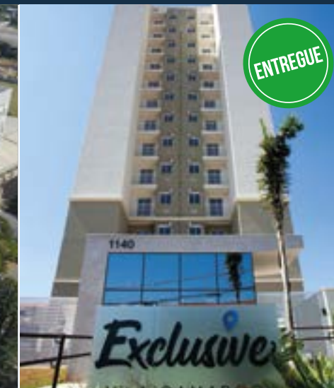
EXCLUSIVE VILA CAMARGO - LIMEIRA 100% Vendido - Pronto para Morar