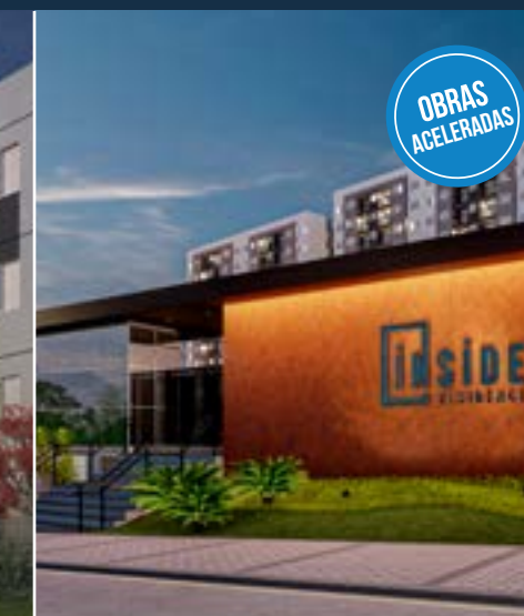
INSIDE RESIDENCE - HORTOLÂNDIA 50% vendido - Sucesso Absoluto de Vendas