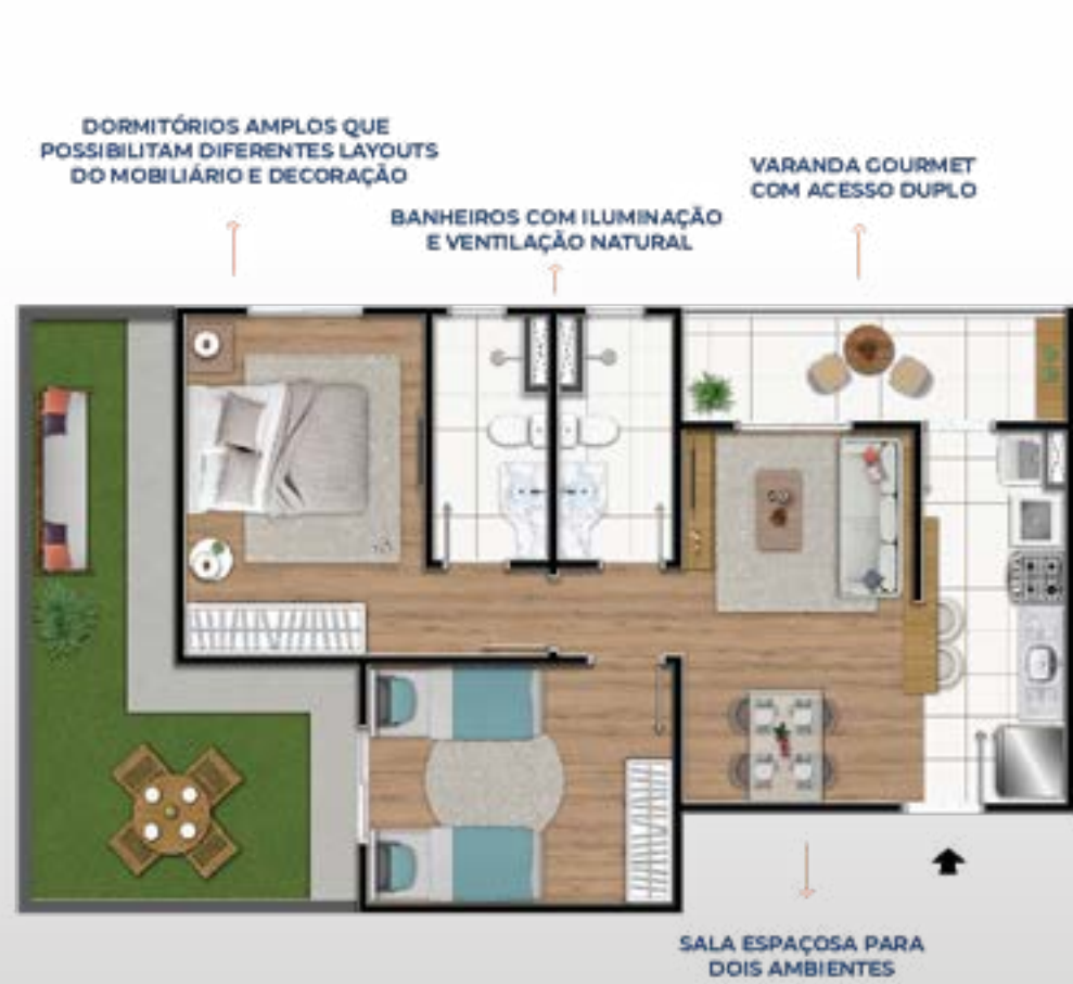
PLANTA GARDEN PONTA FUNDO: 65,95m 2