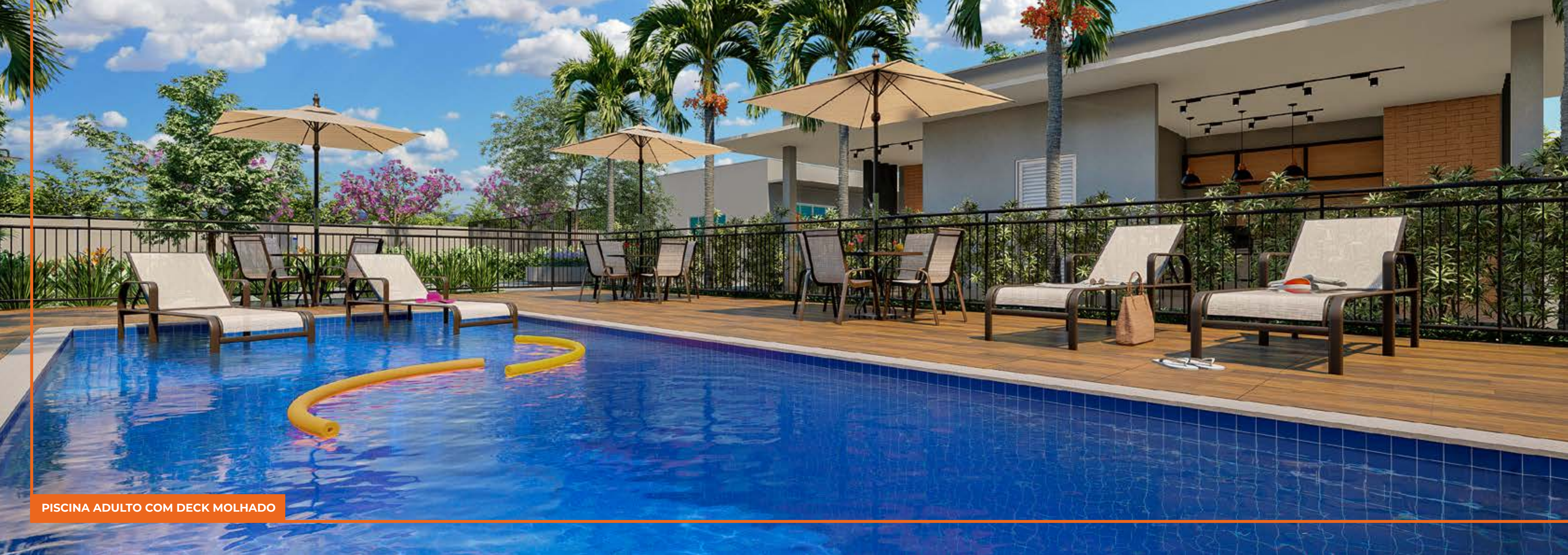
PISCINA ADULTO COM DECK MOLHADO