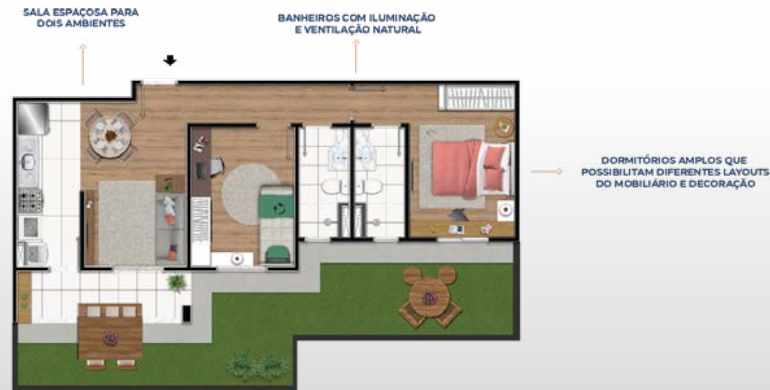
PLANTA GARDEN MEIO FRENTE: 80,91m 2