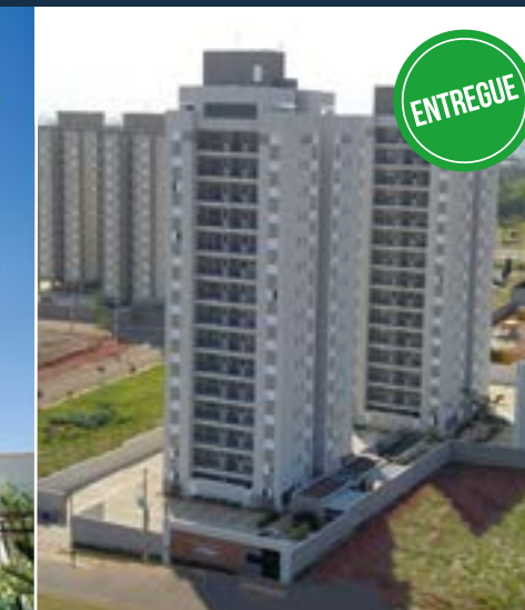
VIEW RESIDENCE - SANTA BÁRBARA D'OESTE 100% Vendido - Pronto para Morar