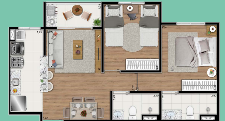
Planta tipo meio