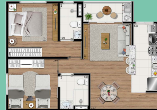
Planta tipo ponta