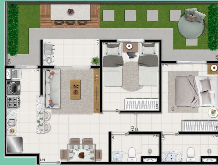
Planta tipo garden meio