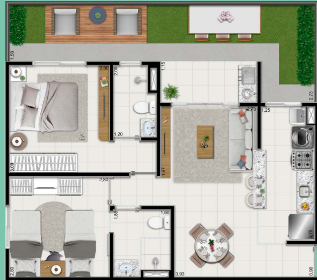
Planta tipo garden ponta