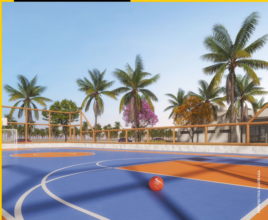
QUADRA - CLUBE 01