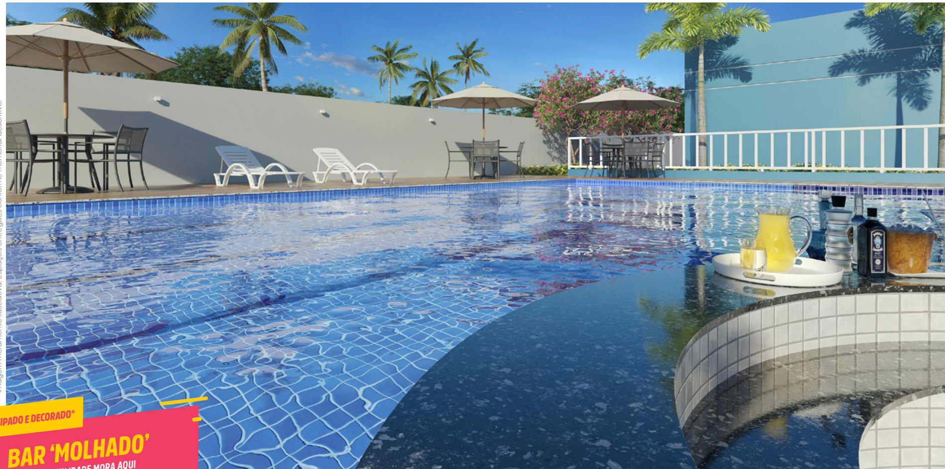
EQUIPADO E DECORADO* BAR 'MOLHADO' A TRANQUILIDADE MORA AQUI

*Imagem meramente ilustrativa. Espaços entregues conforme memorial descritivo.