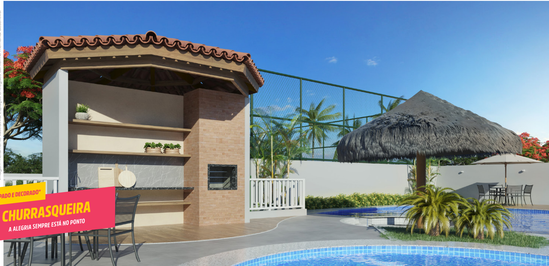
EQUIPADO E DECORADO* CHURRASQUEIRA A ALEGRIA SEMPRE ESTÁ NO PONTO

*Imagem meramente ilustrativa. Espaços entregues conforme memorial descritivo.