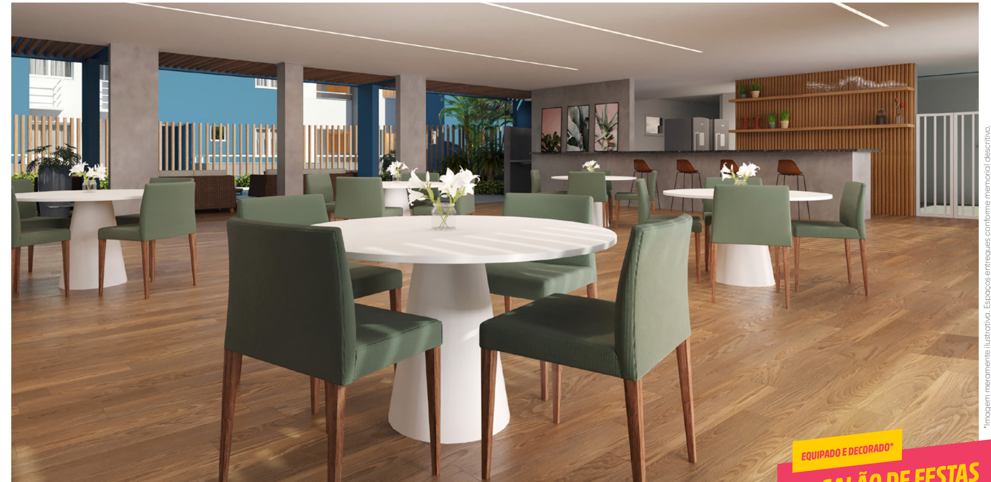
EQUIPADO E DECORADO* SALÃO DE FESTAS O BAILE JÁ TEM LUGAR PRA ACONTECER

*Imagem meramente ilustrativa. Espaços entregues conforme memorial descritivo.