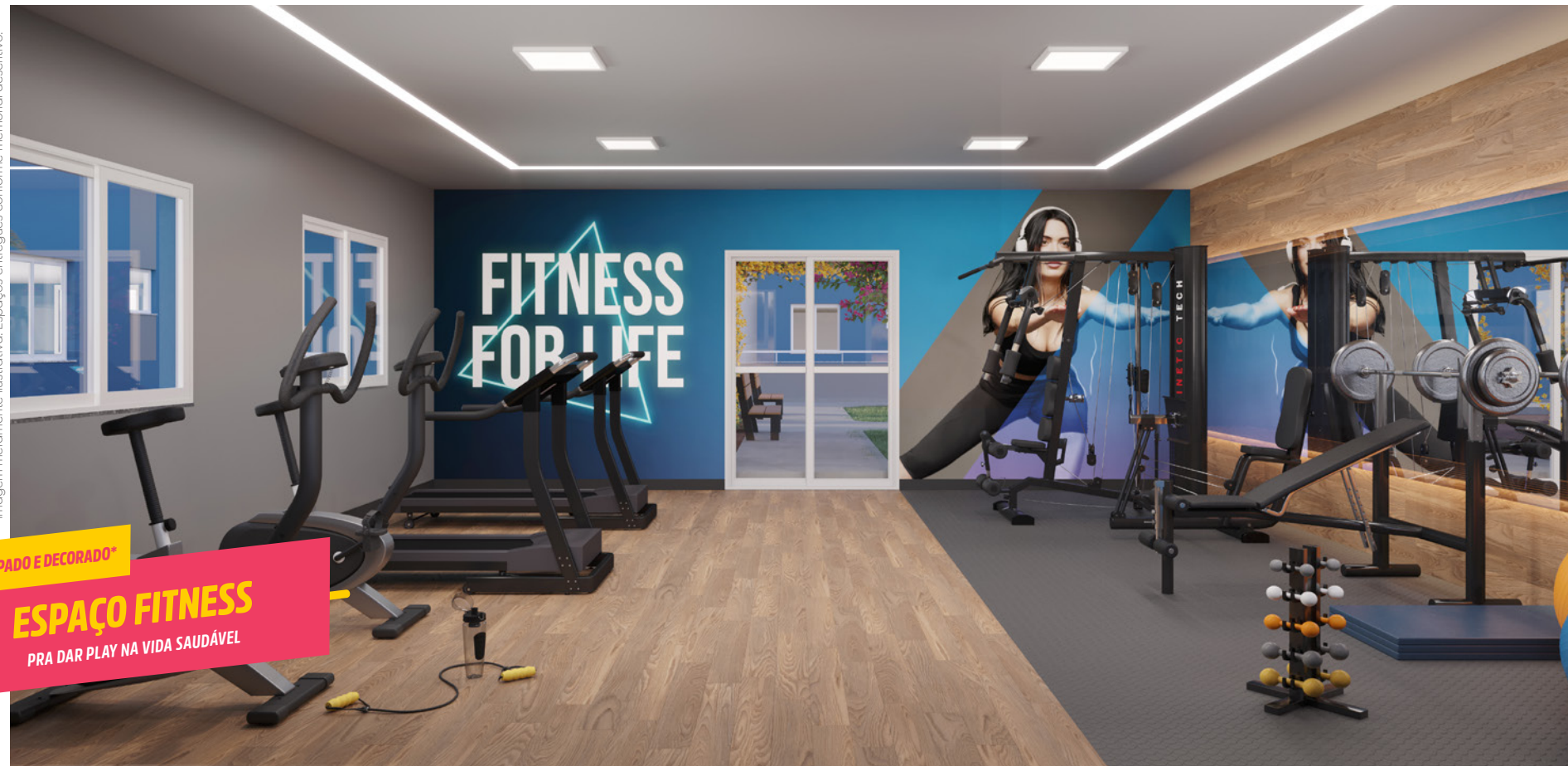
EQUIPADO E DECORADO* ESPAÇO FITNESS PRA DAR PLAY NA VIDA SAUDÁVEL

*Imagem meramente ilustrativa. Espaços entregues conforme memorial descritivo.