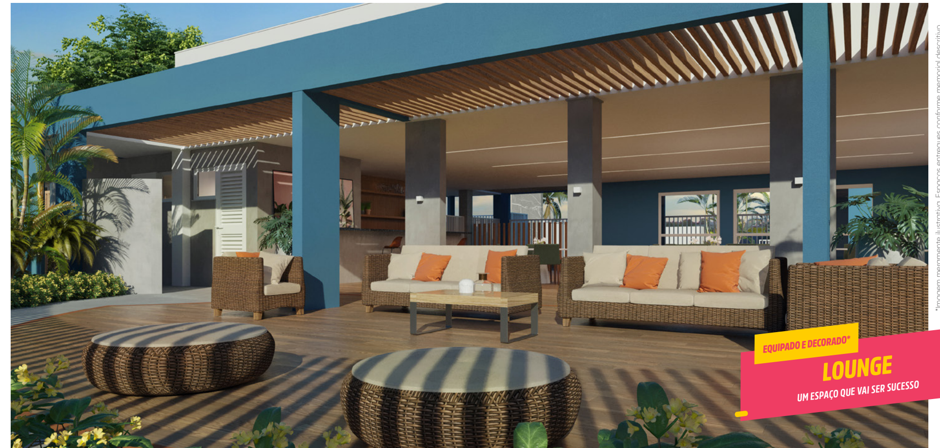
EQUIPADO E DECORADO* LOUNGE UM ESPAÇO QUE VAI SER SUCESSO

*Imagem meramente ilustrativa. Espaços entregues conforme memorial descritivo.