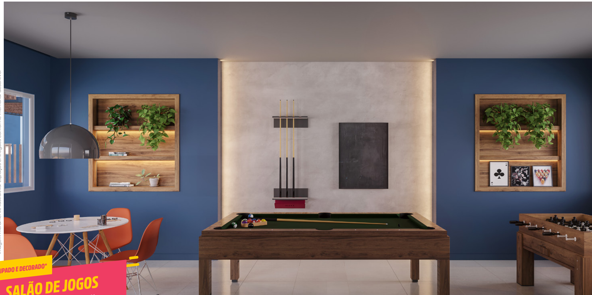
EQUIPADO E DECORADO* SALÃO DE JOGOS A DIVERSÃO É A ATRAÇÃO PRINCIPAL

*Imagem meramente ilustrativa. Espaços entregues conforme memorial descritivo.