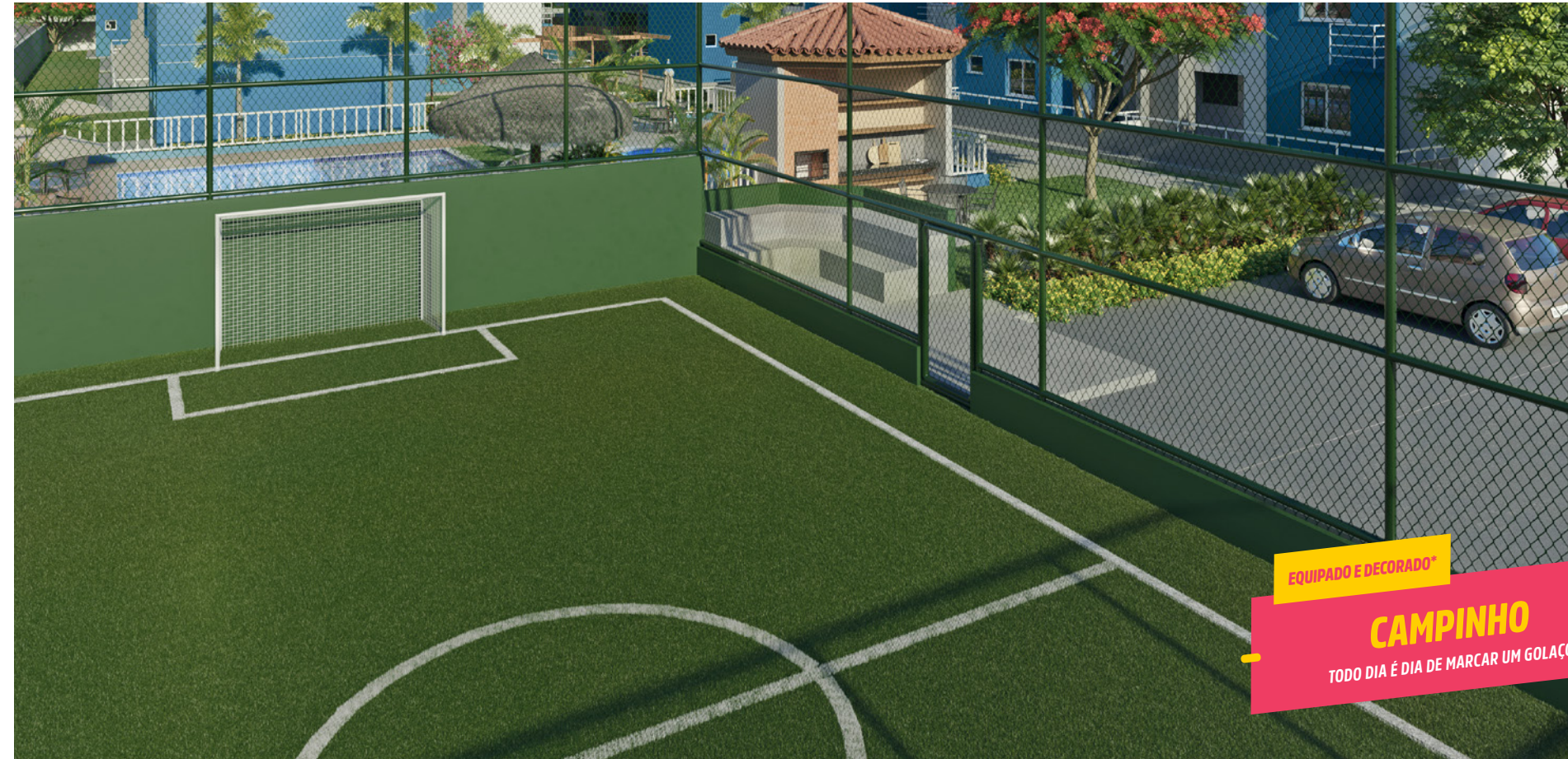
EQUIPADO E DECORADO* CAMPINHO TODO DIA É DIA DE MARCAR UM GOLACÔ

*Imagem meramente ilustrativa. Espaços entregues conforme memorial descritivo.