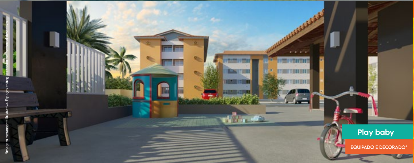
Play baby EQUIPADO E DECORADO*

*Imagem meramente ilustrativa. Espaços entregues conforme memorial descritivo.