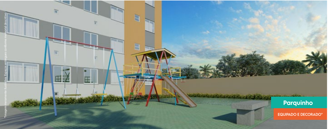
Parquinho EQUIPADO E DECORADO*

*Imagem meramente ilustrativa. Espaços entregues conforme memorial descritivo.