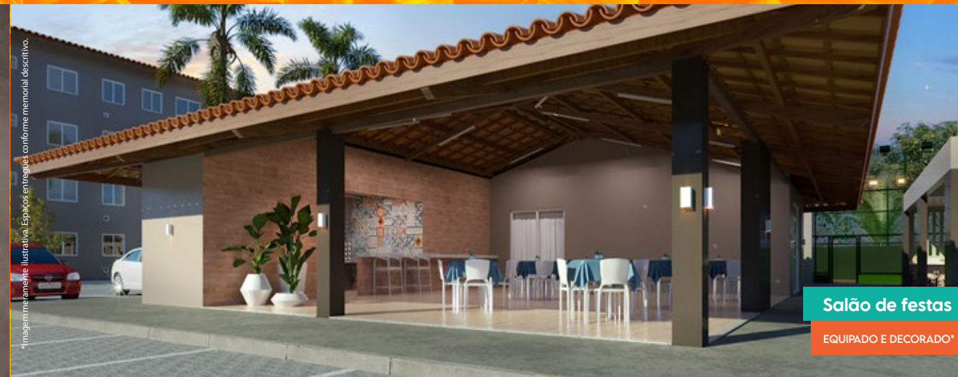
Salão de festas

*Imagem meramente ilustrativa. Espaços entregues conforme memorial descritivo.