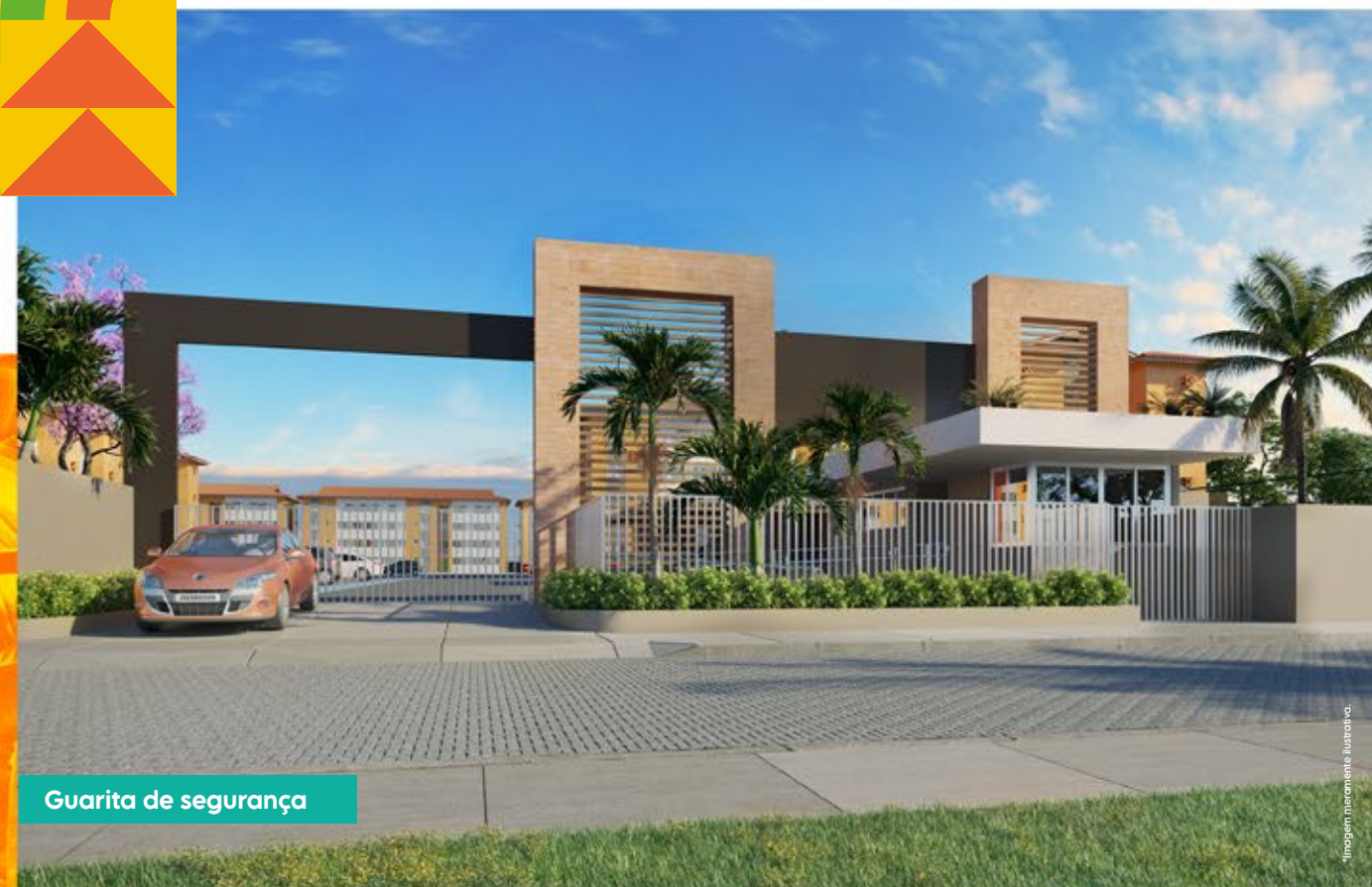
Guarita de segurança

Você livre do aluguel, sua felicidade lá no alto.