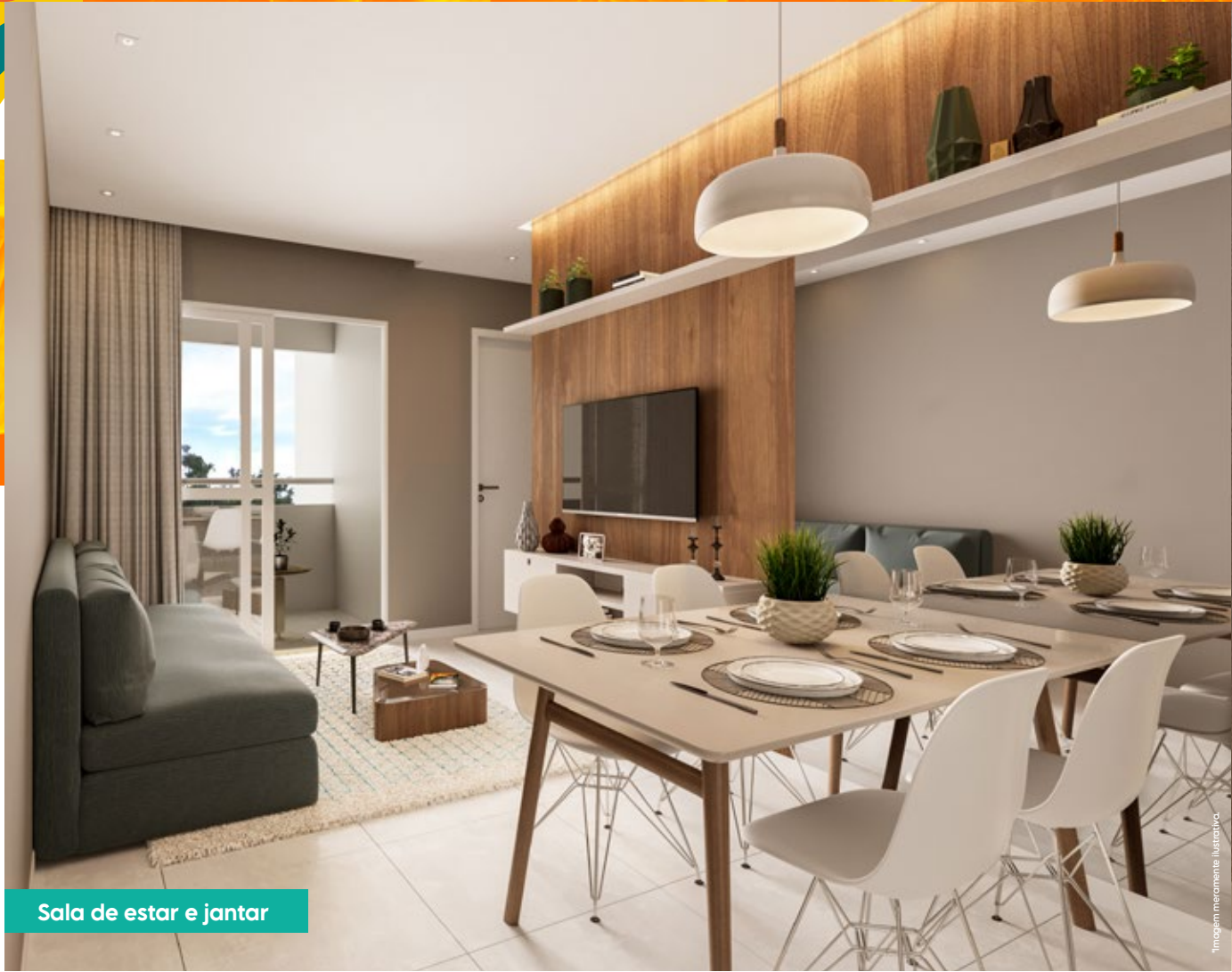
Sala de estar e jantar