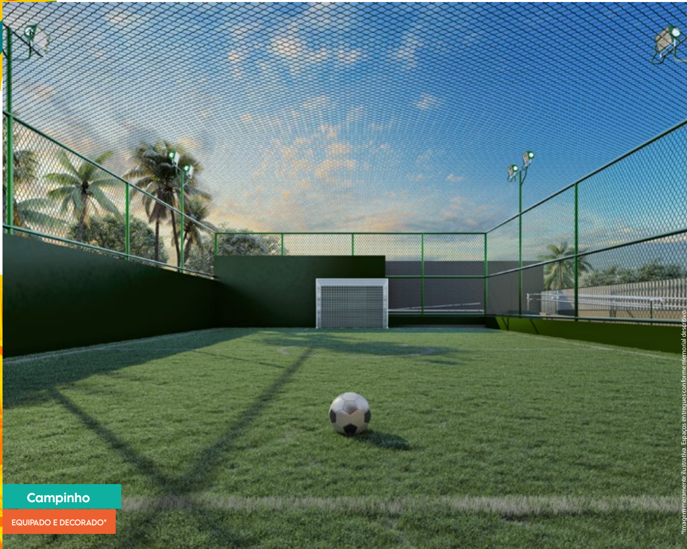
Campinho EQUIPADO E DECORADO*

*Imagem meramente ilustrativa. Espaços entregues conforme memorial descritivo.