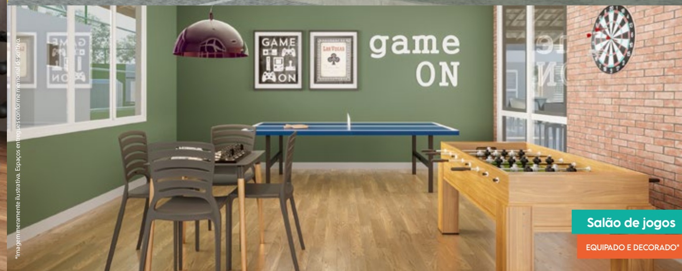
Salão de jogos

*Imagem meramente ilustrativa. Espaços entregues conforme memorial descritivo.