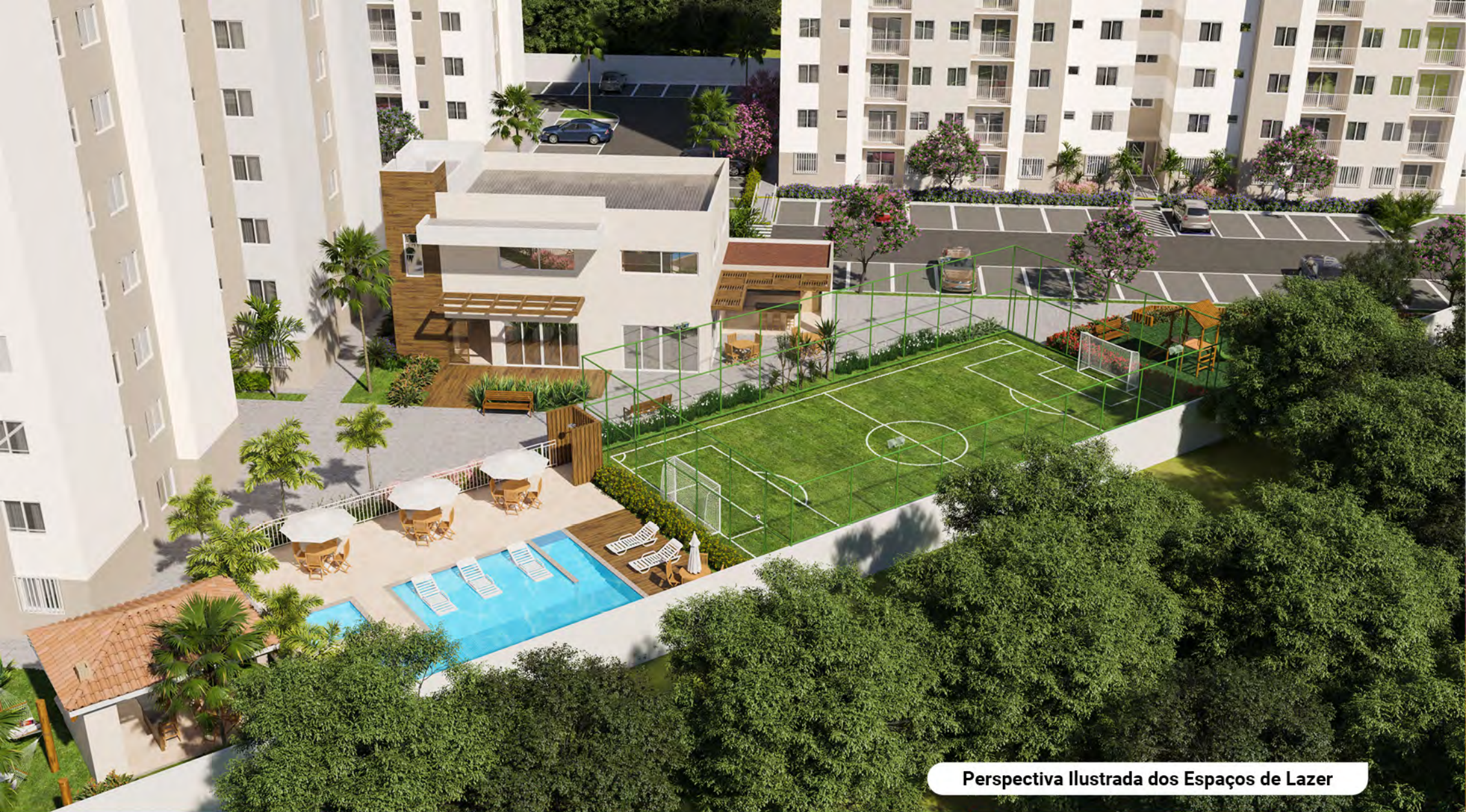
Perspectiva Ilustrada dos Espaços de Lazer