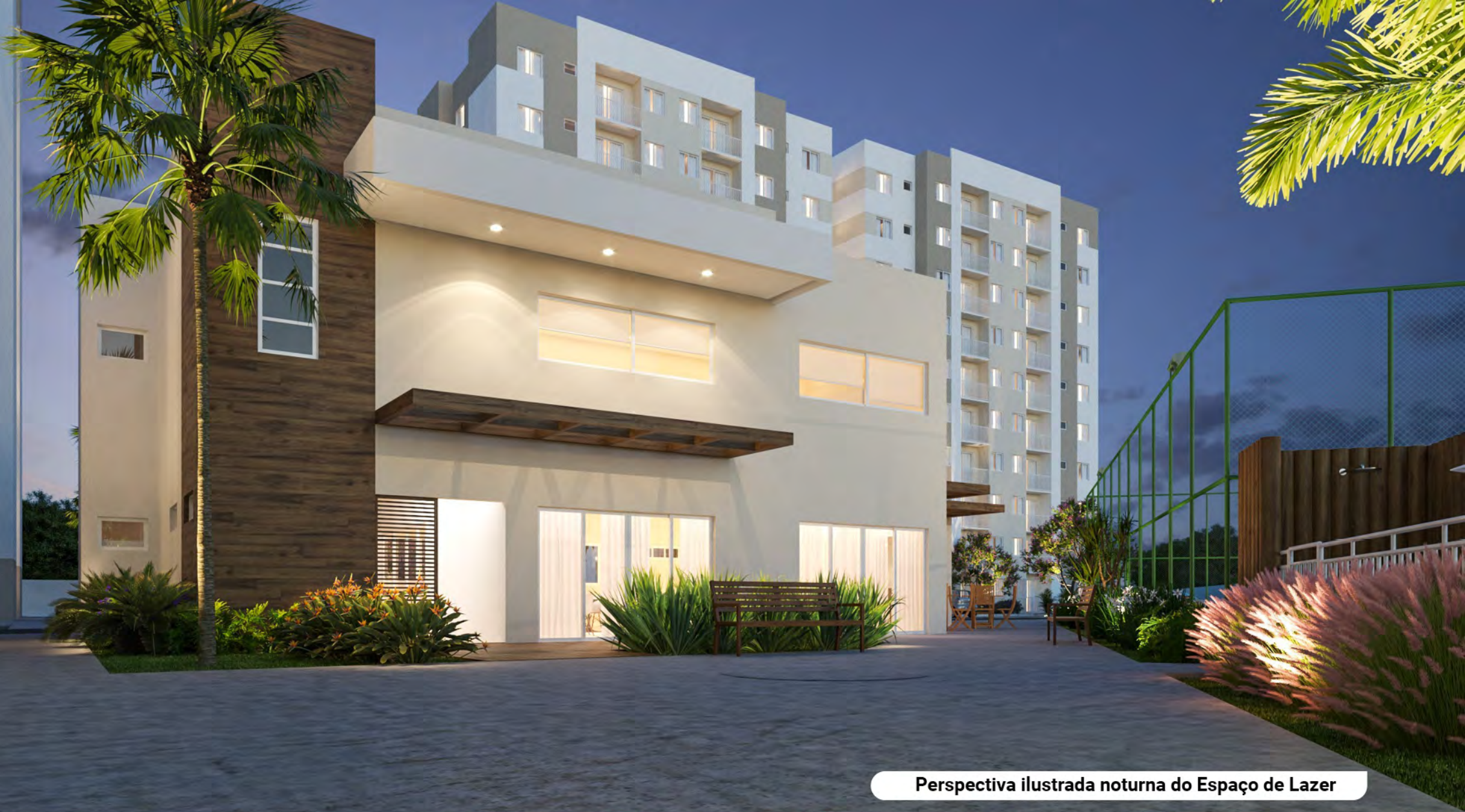
Perspectiva ilustrada noturna do Espaço de Lazer