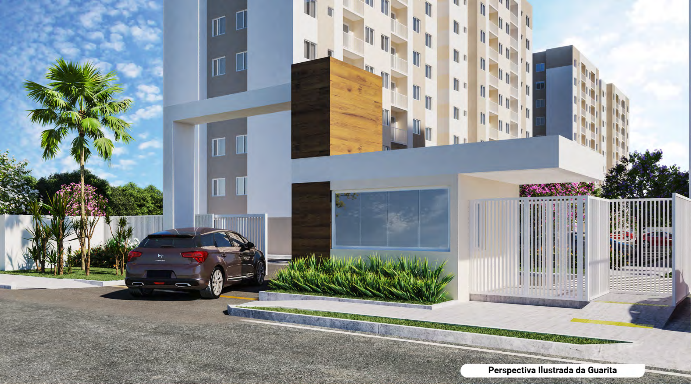
Perspectiva Ilustrada da Guarita