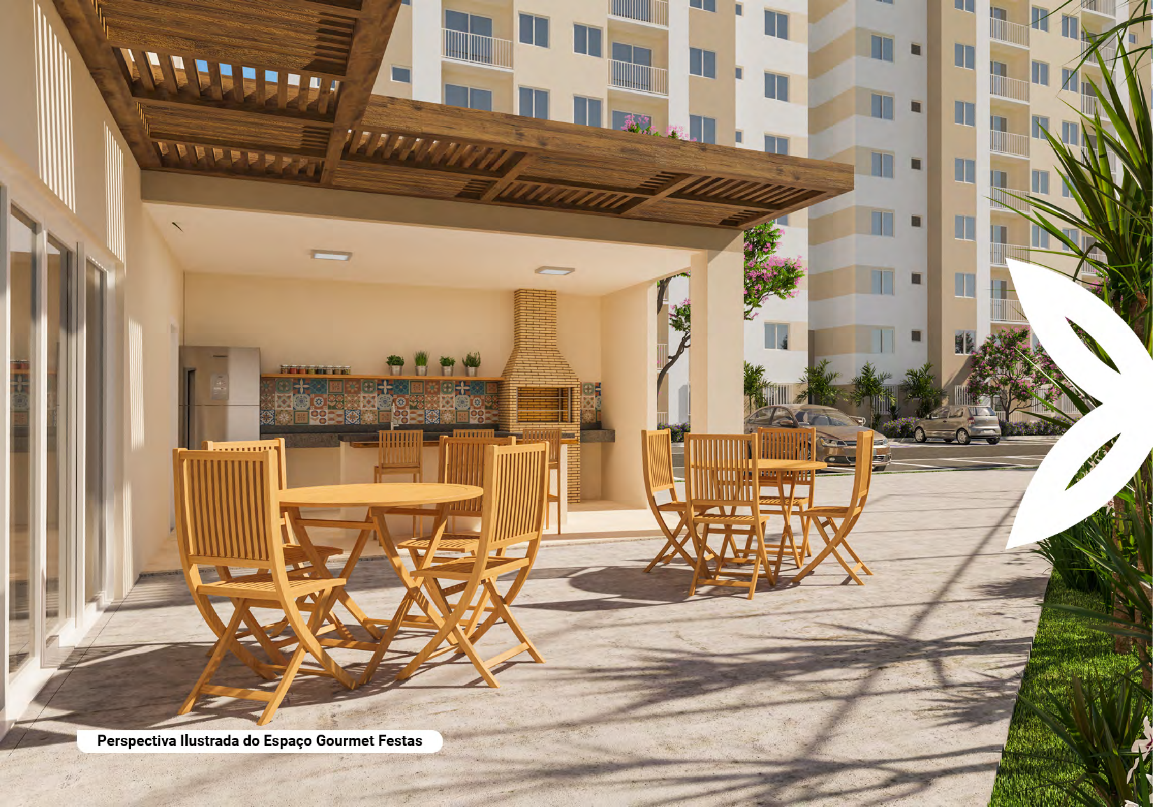
Perspectiva Ilustrada do Espaço Gourmet Festas