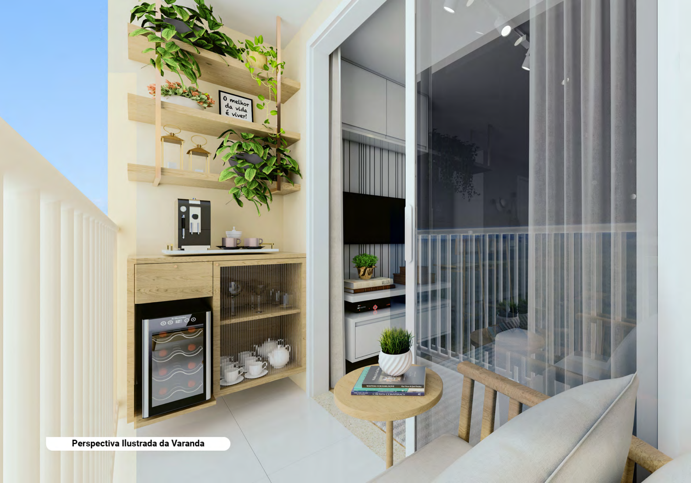
Perspectiva Ilustrada da Varanda