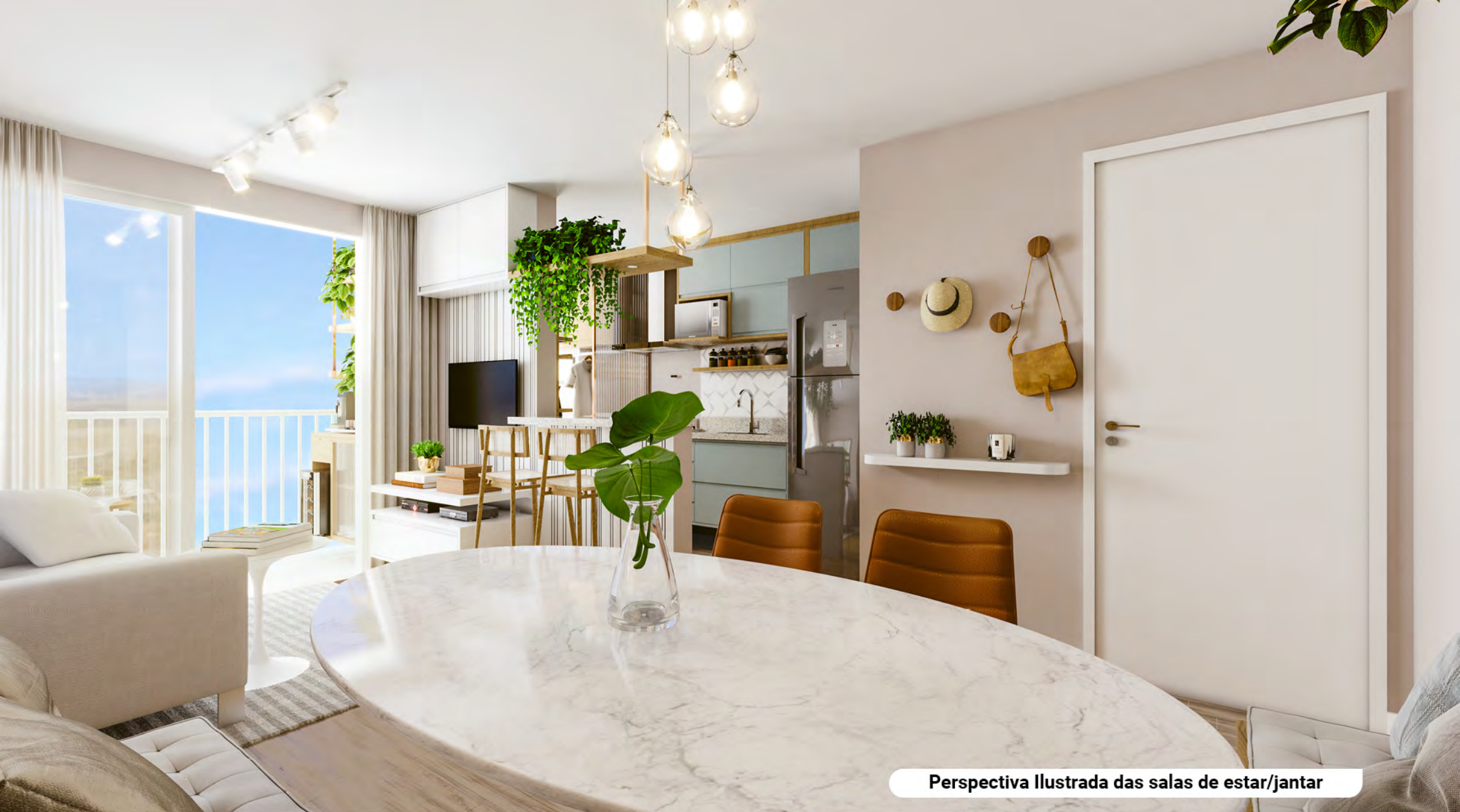
Perspectiva Ilustrada das salas de estar/jantar