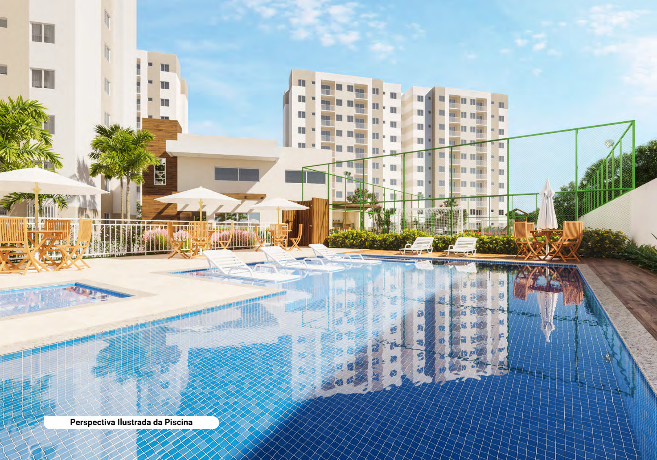
Perspectiva Ilustrada da Piscina