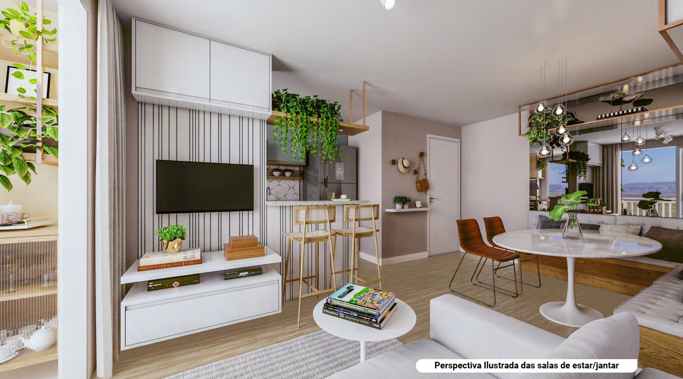
Perspectiva Ilustrada das salas de estar/jantar