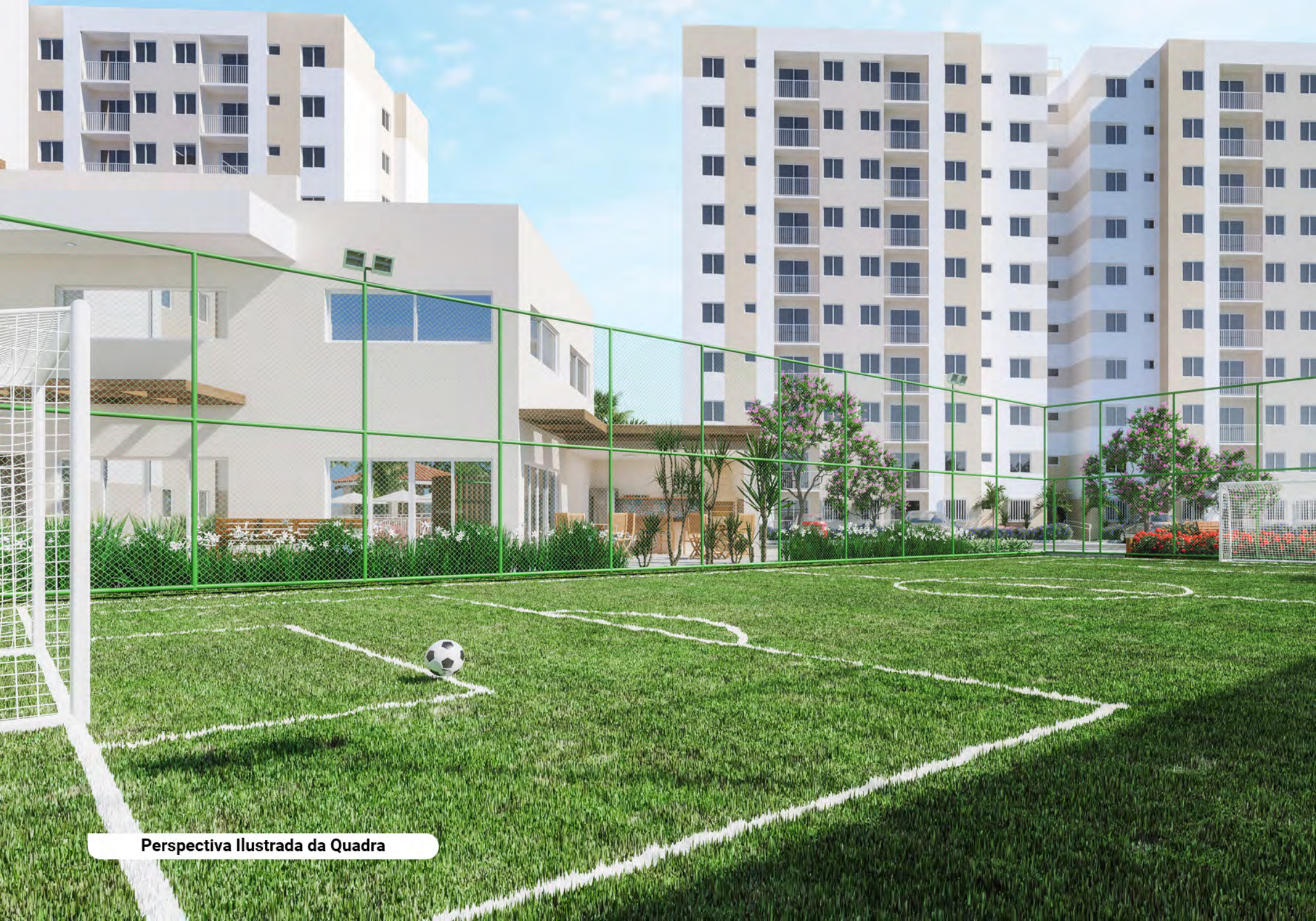
Perspectiva Ilustrada da Quadra