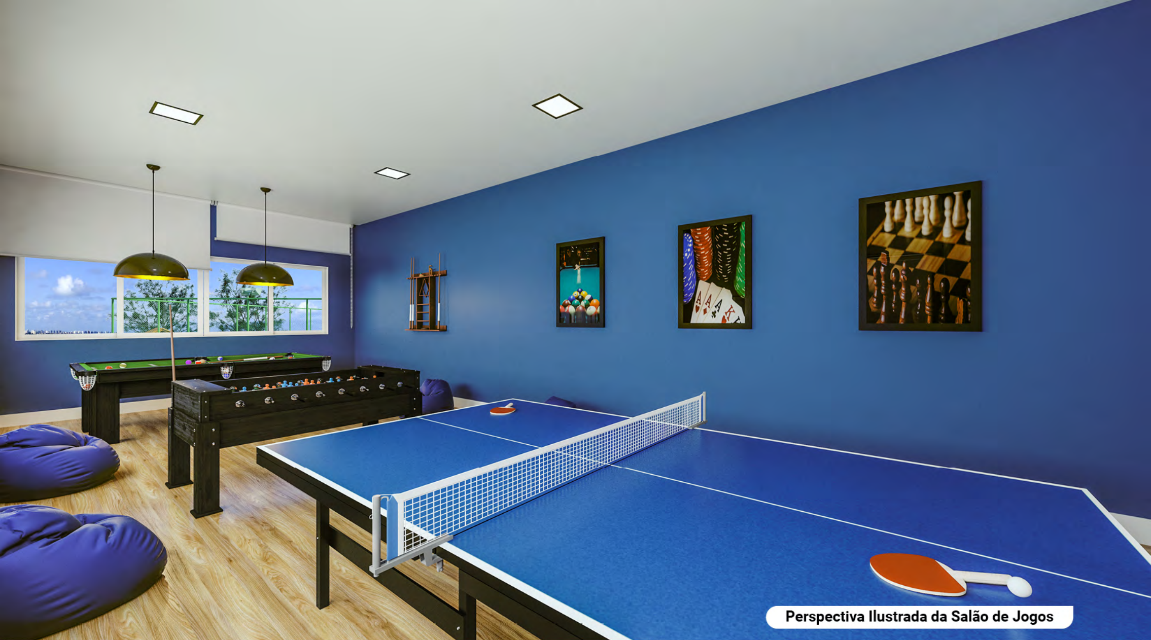
Perspectiva Ilustrada da Salão de Jogos