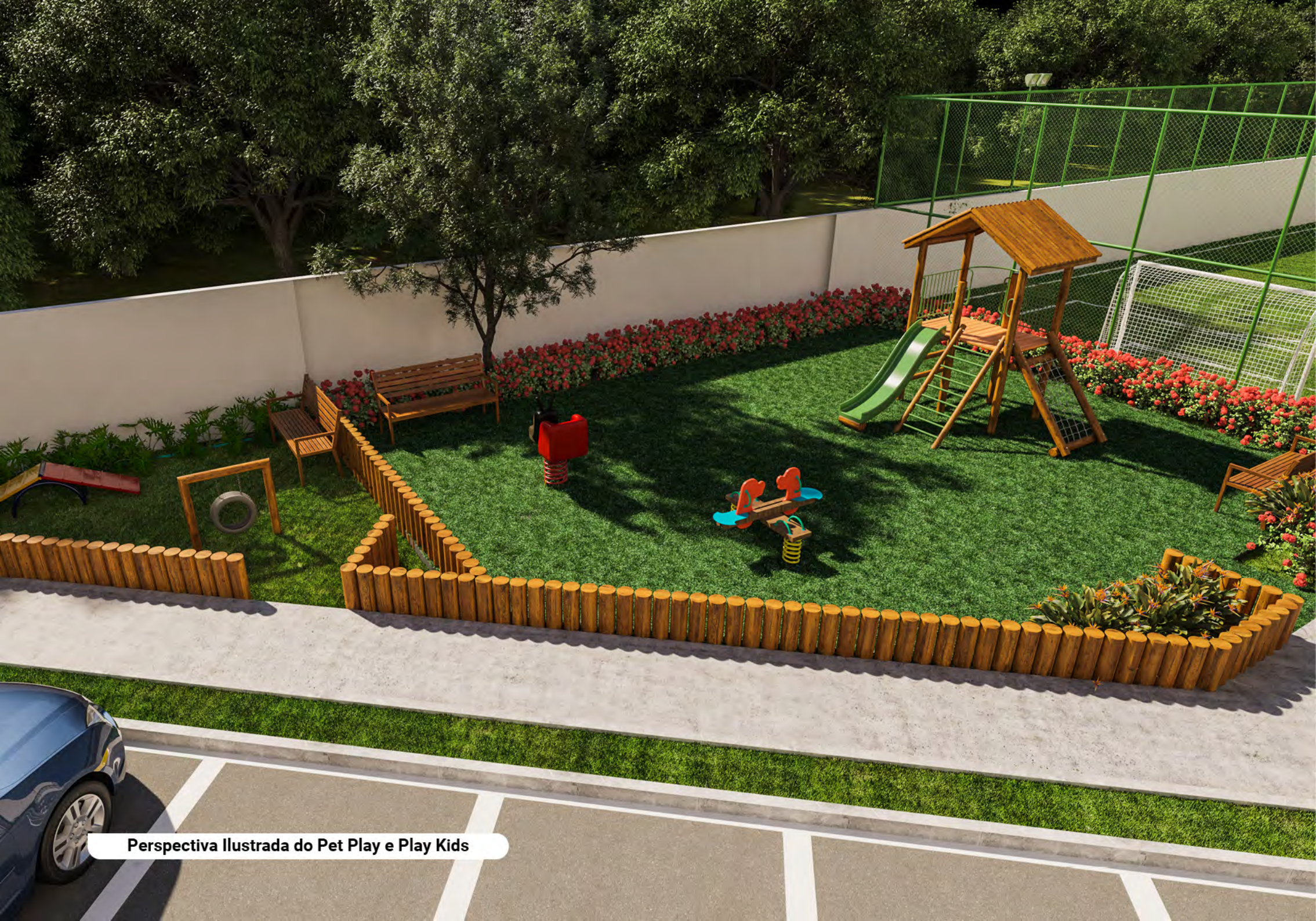
Perspectiva Ilustrada do Pet Play e Play Kids