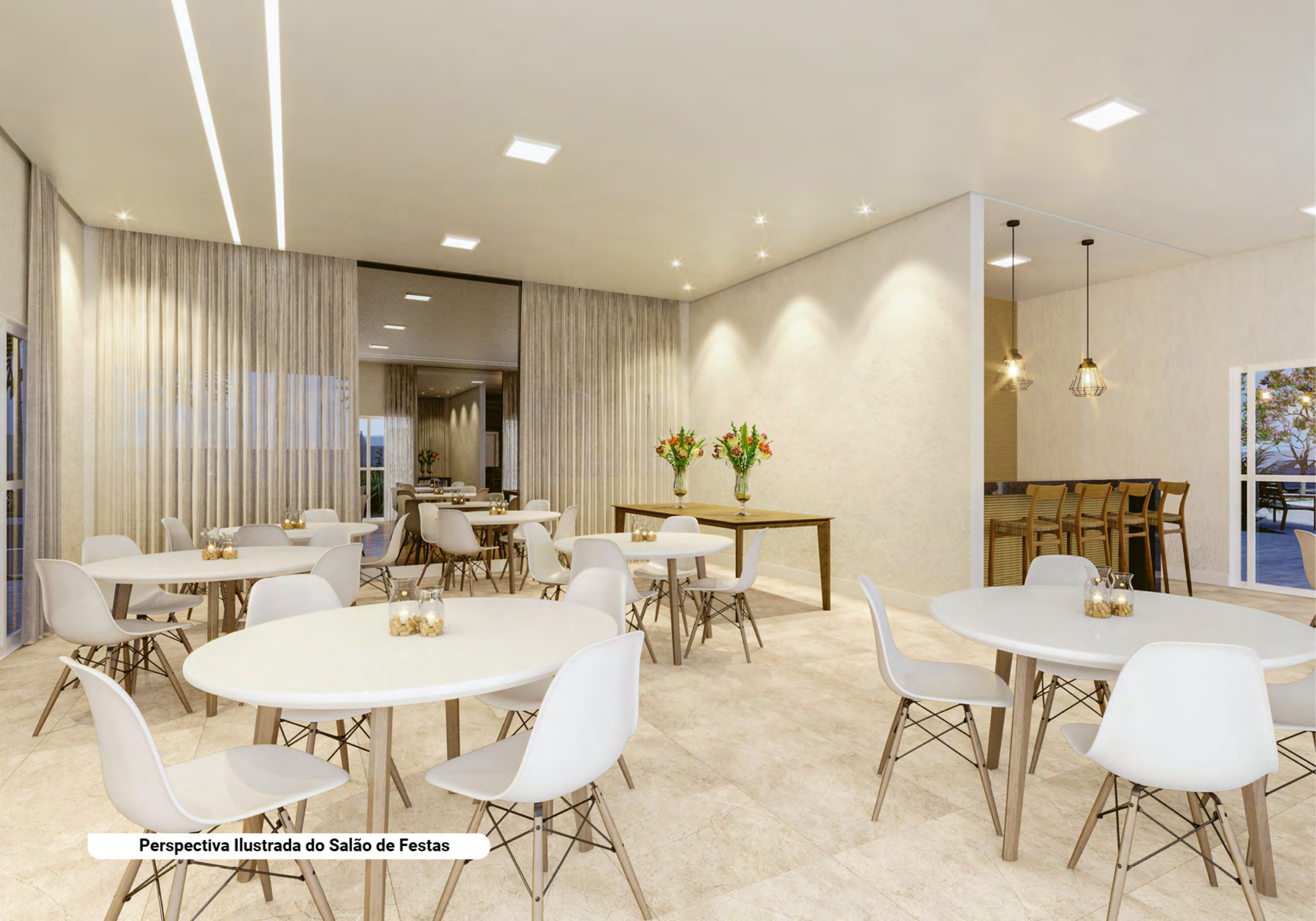
Perspectiva Ilustrada do Salão de Festas