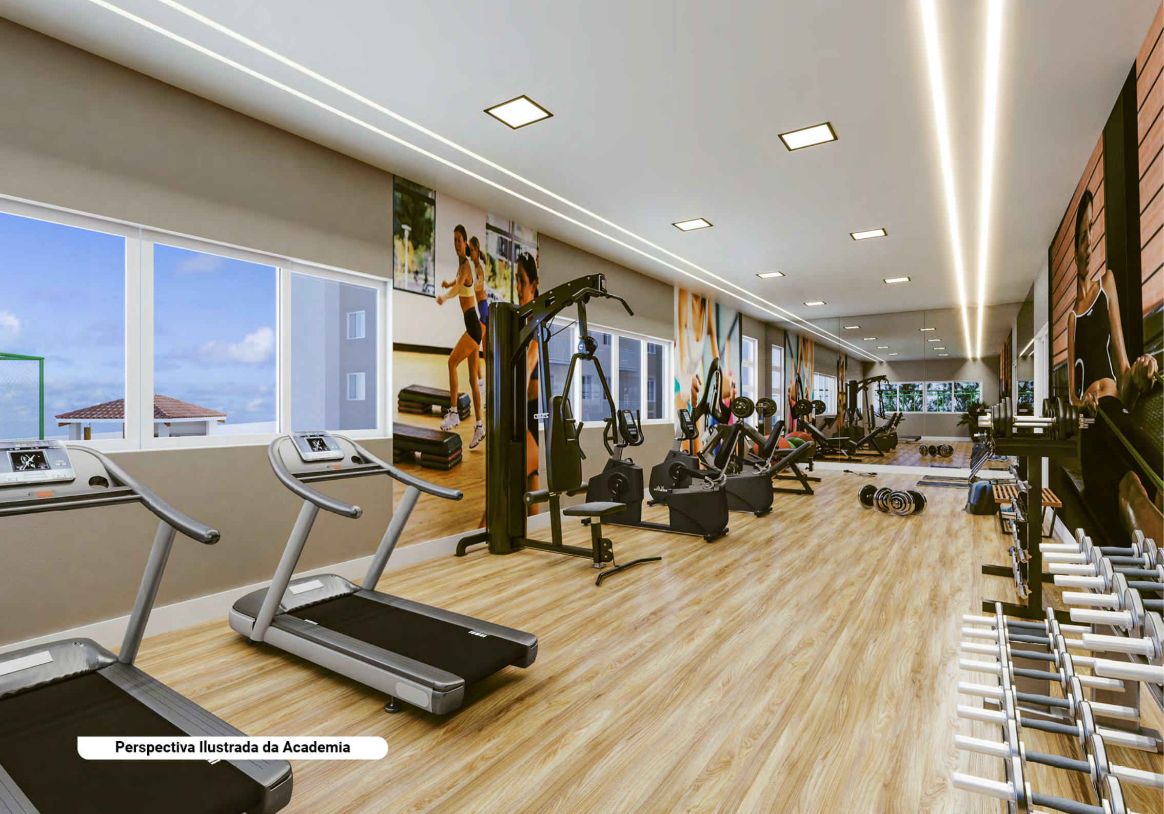
Perspectiva Ilustrada da Academia