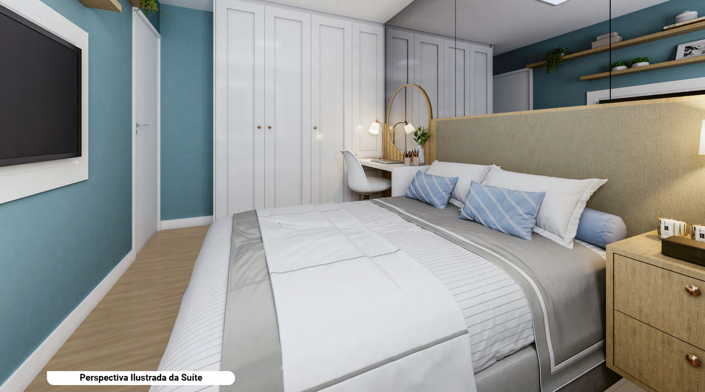
Perspectiva Ilustrada da Suíte