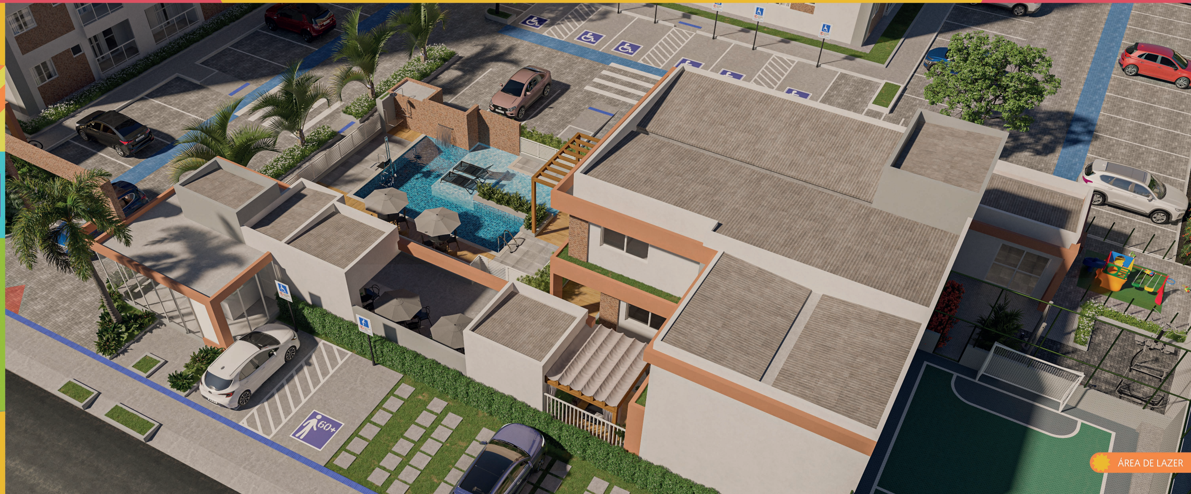
ÁREA DE LAZER