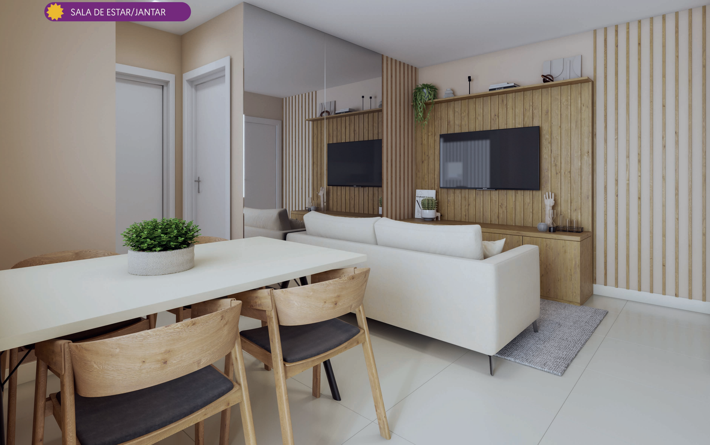
SALA DE ESTAR/JANTAR