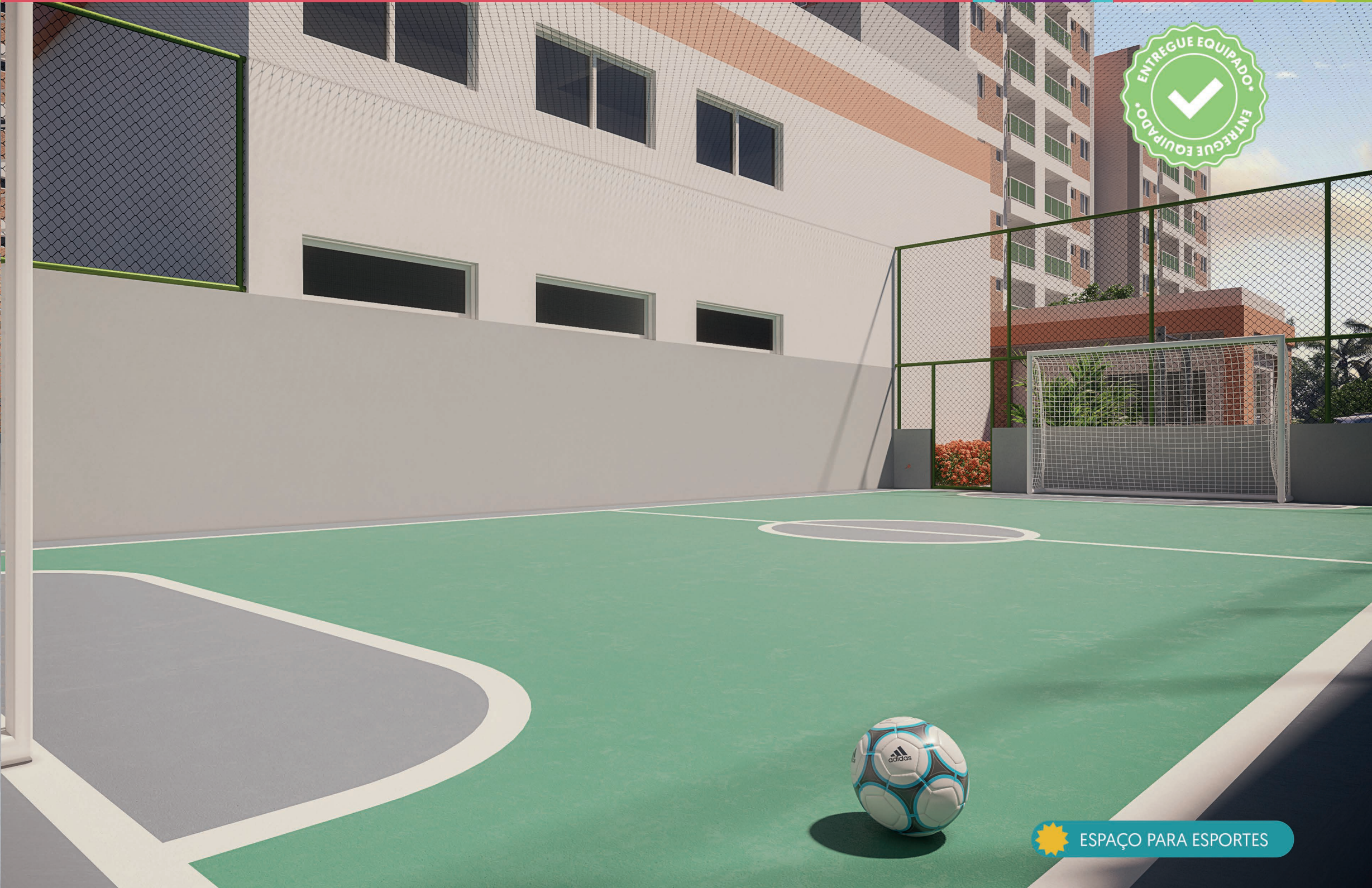
ESPAÇO PARA ESPORTES