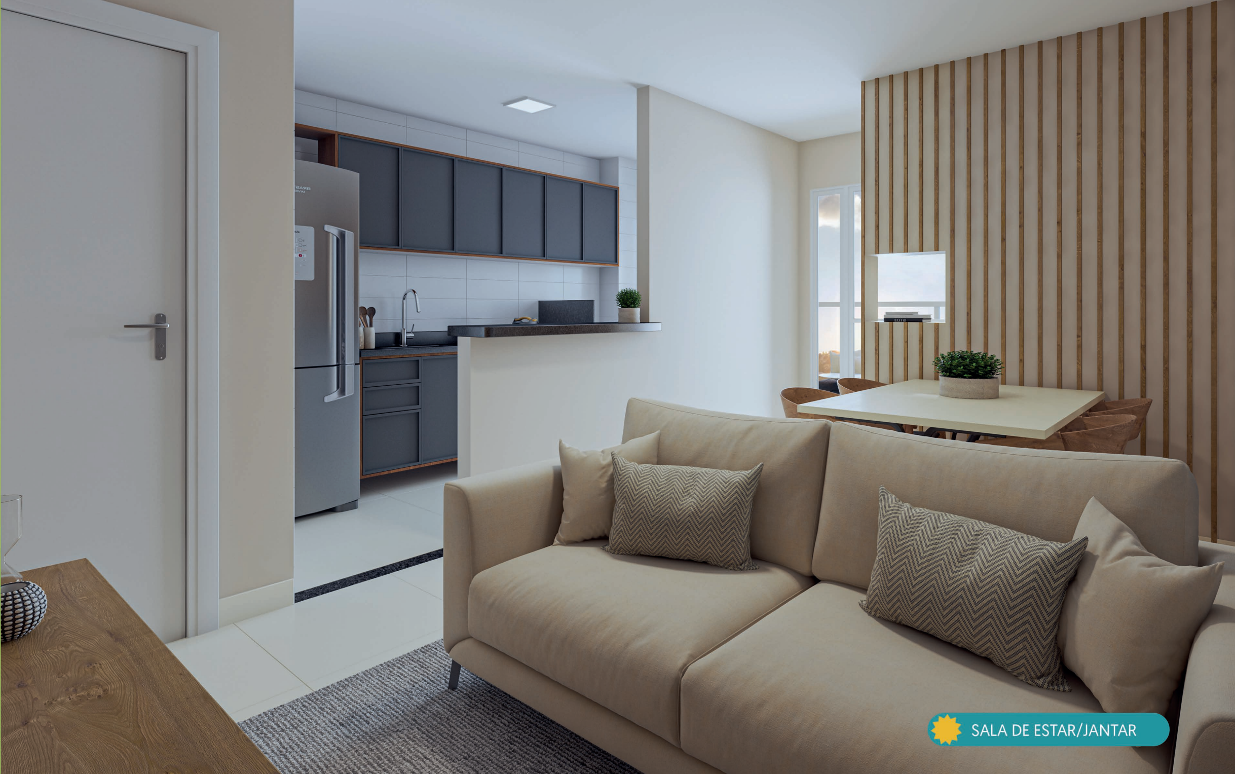
SALA DE ESTAR/JANTAR