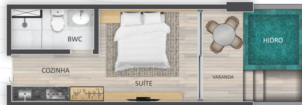
LAYOUT PADRÃO UNIDS. C/ PISCINA