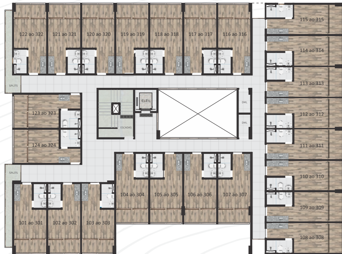
PAVIMENTO (1º ao 3º)