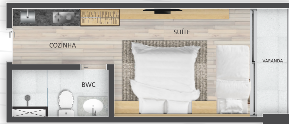
LAYOUT PADRÃO UNIDS. C/ VARANDA