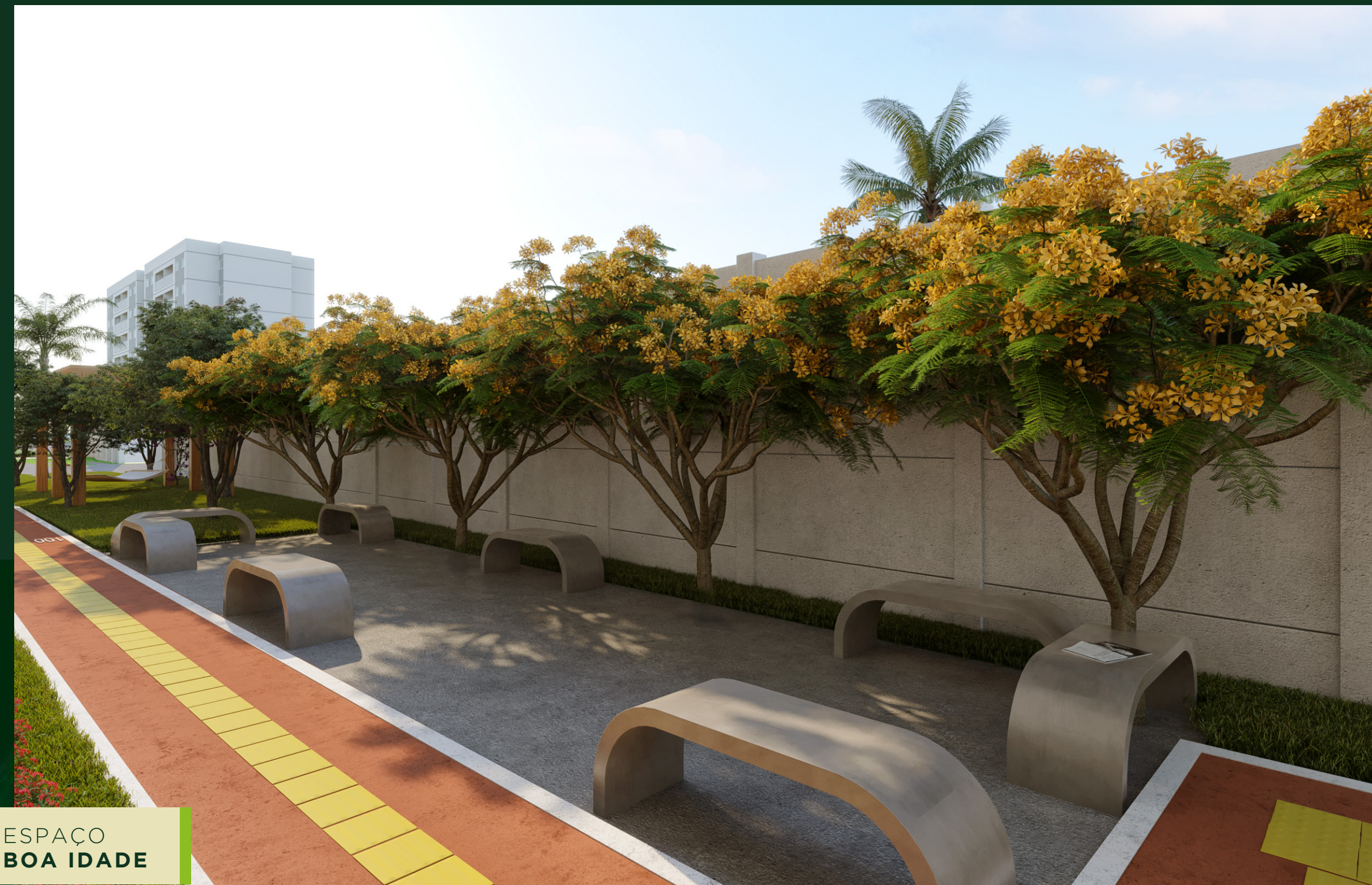
ESPAÇO BOA IDADE