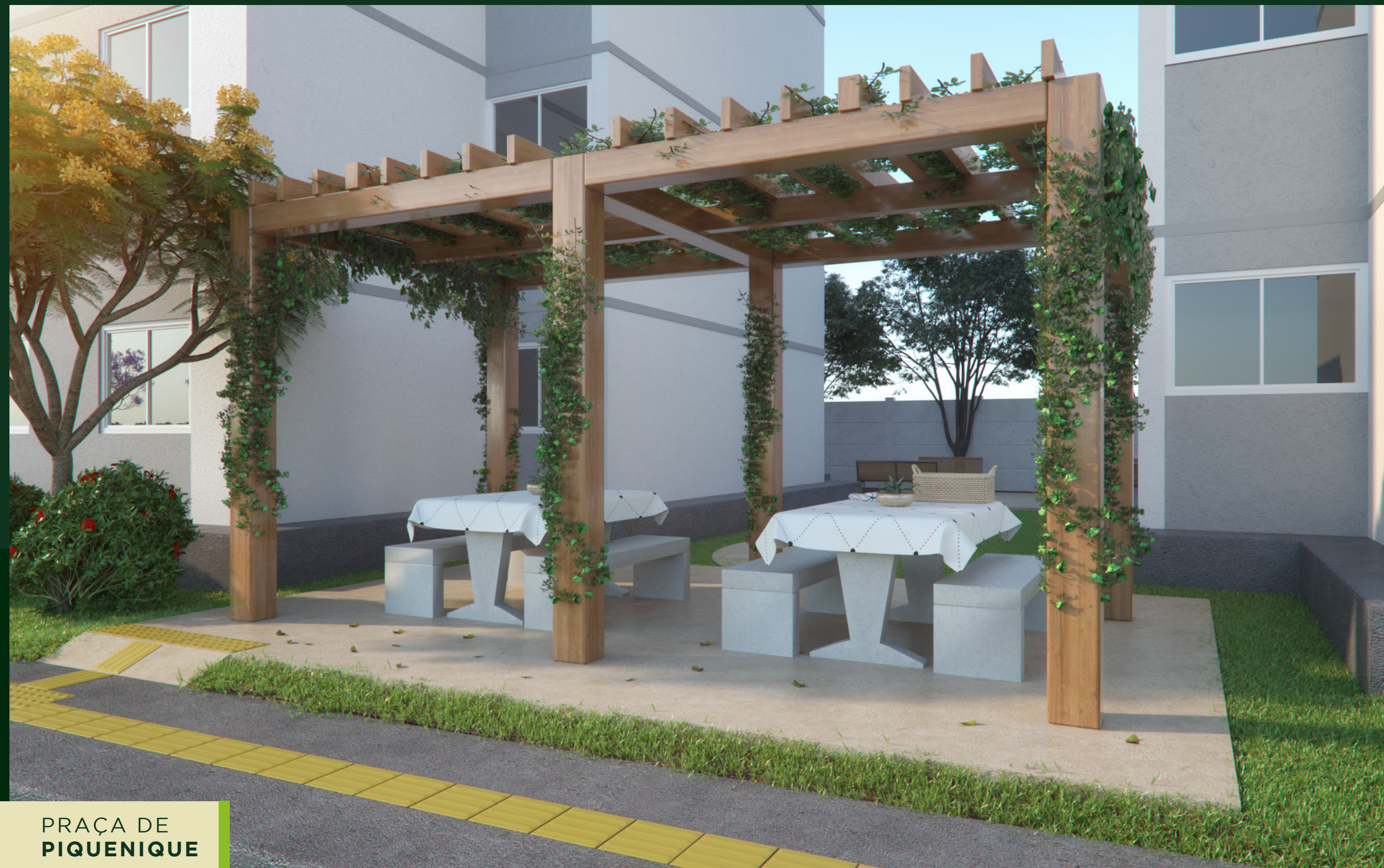
PRAÇA DE PIQUENIQUE