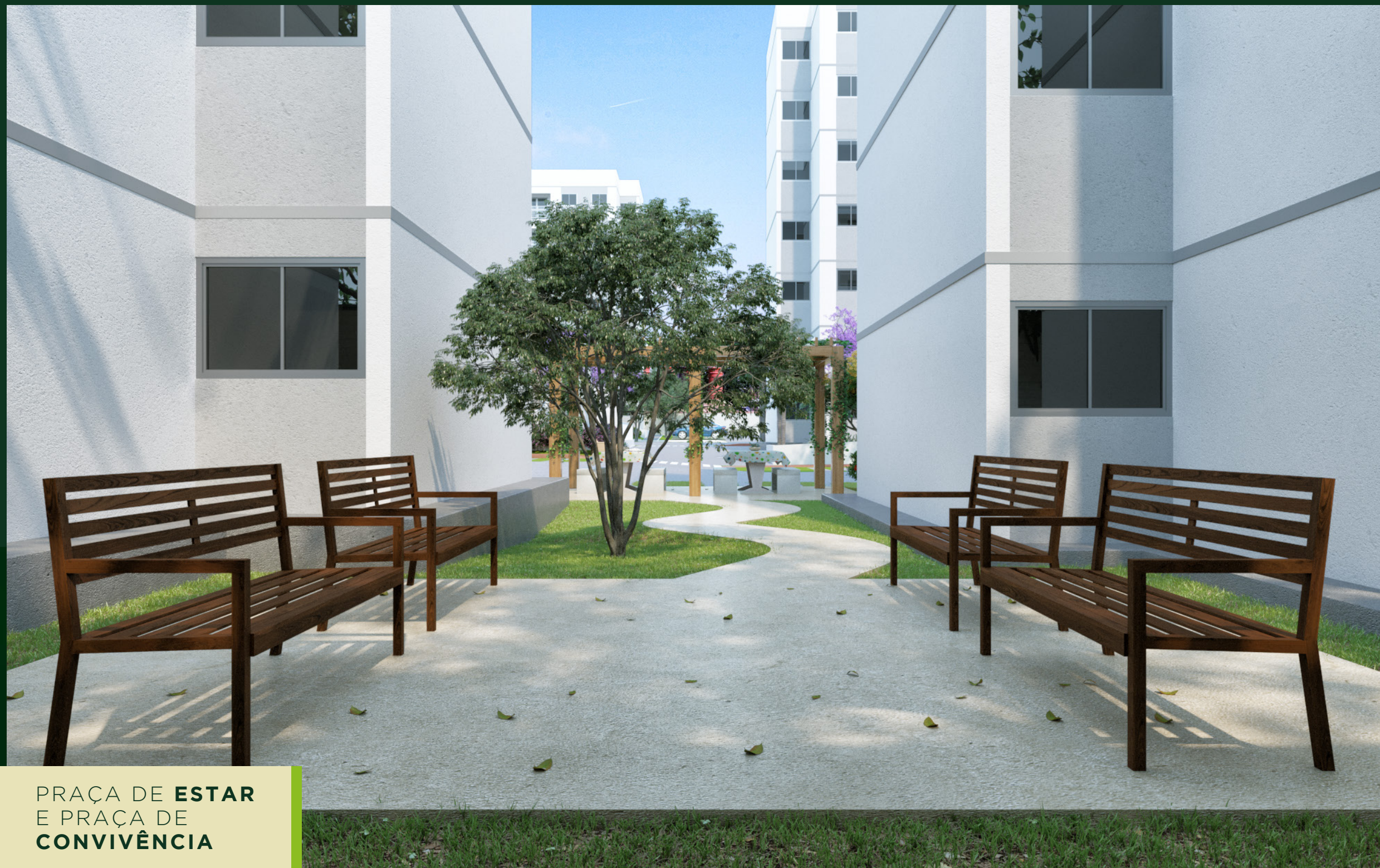
PRAÇA DE ESTAR E PRAÇA DE CONVIVÊNCIA