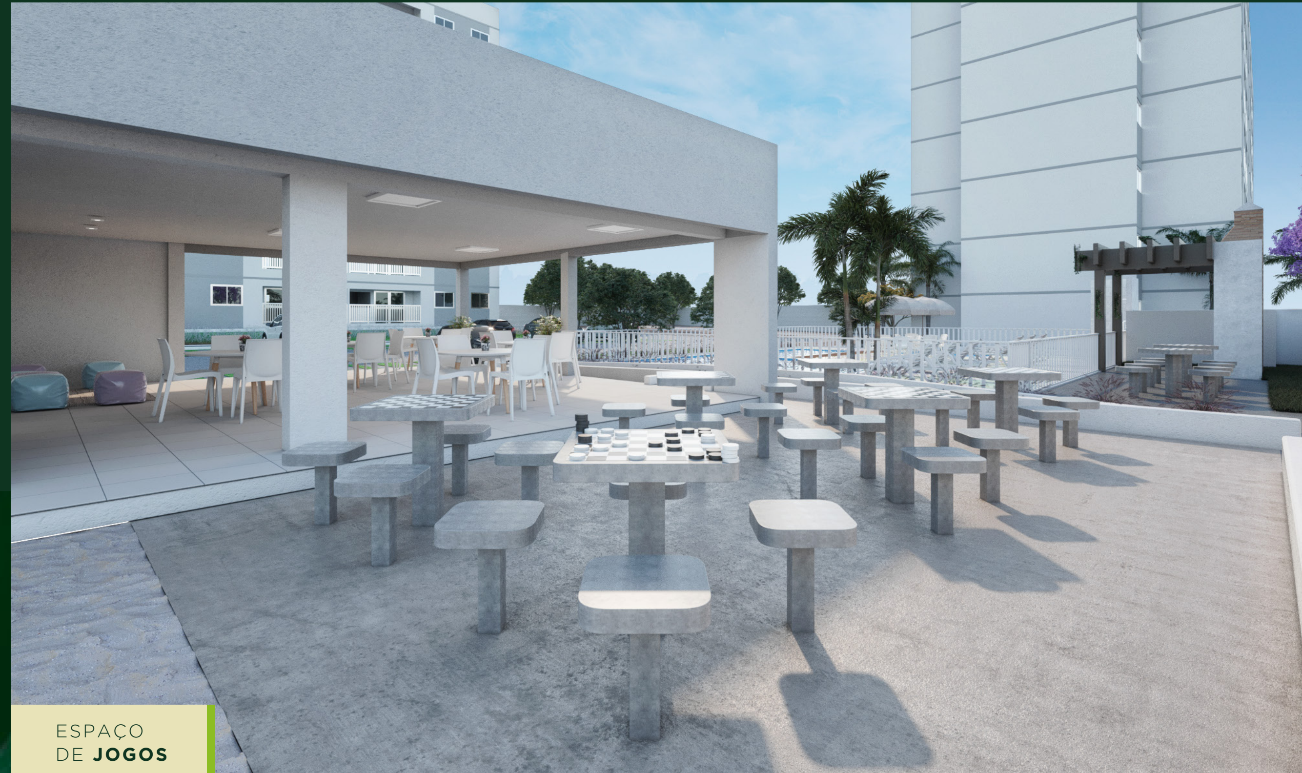
ESPAÇO DE JOGOS