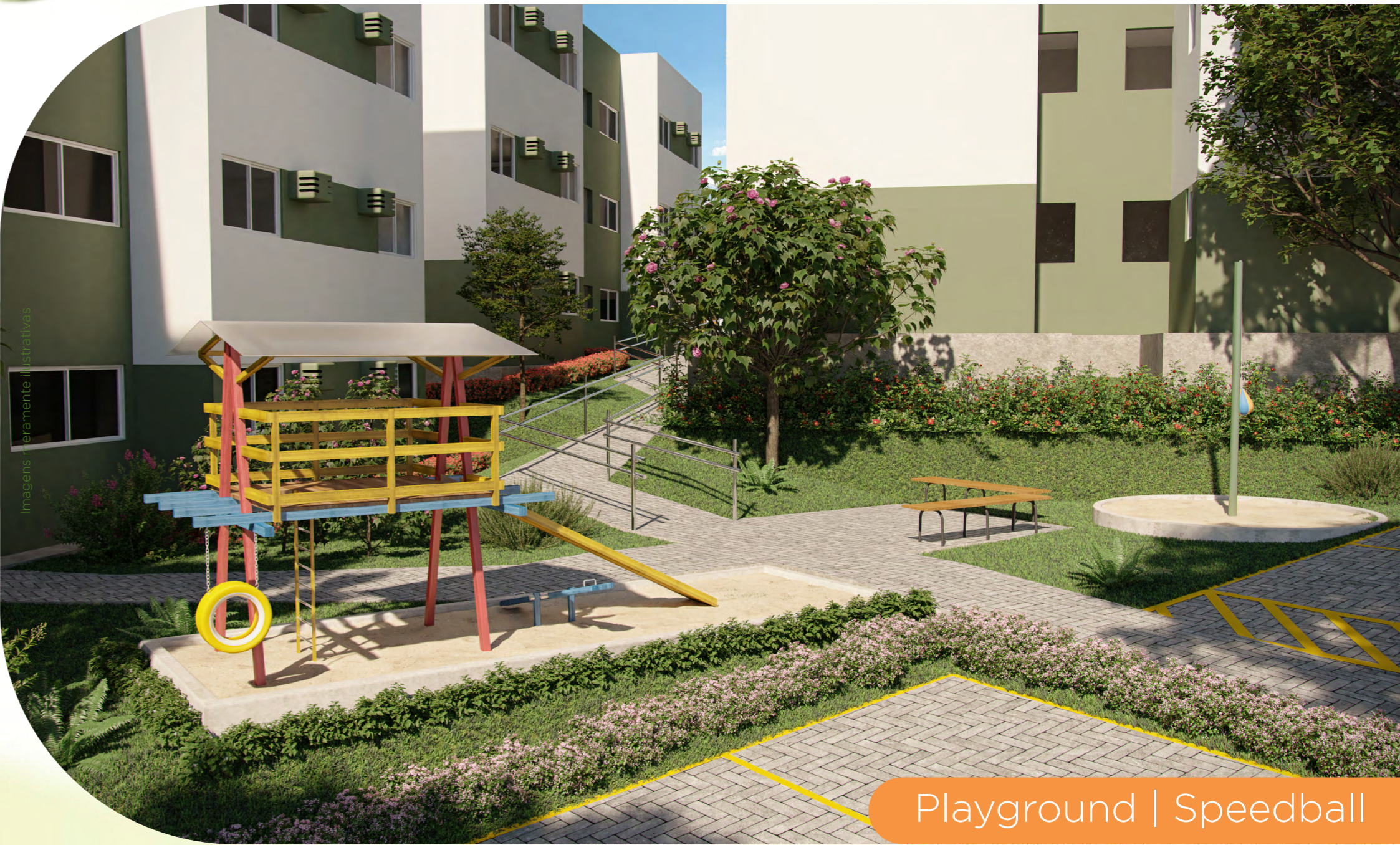
Playground | Speedball