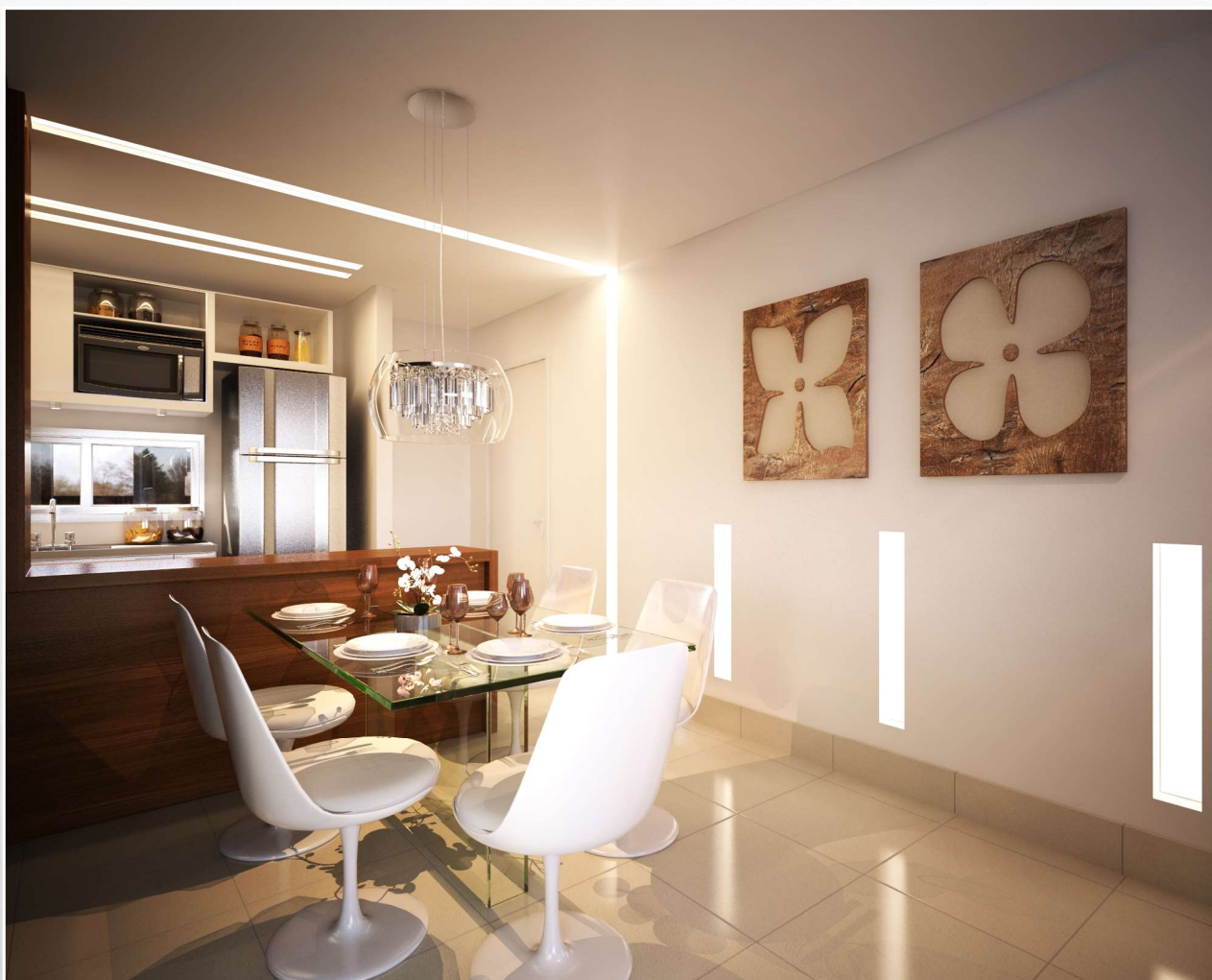
Persp. Sala Jantar