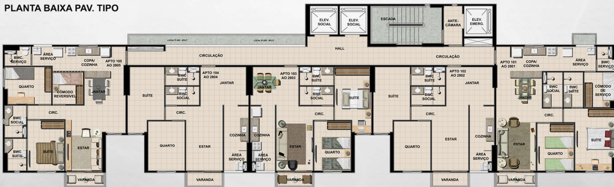
PLANTA BAIXA PAV. TIPO

A lâmina do pavimento tipo assume uma forma retangular, assimétrica e dinâmica, com saques e reentrâncias, de modo a definir uma plástica arrojada.