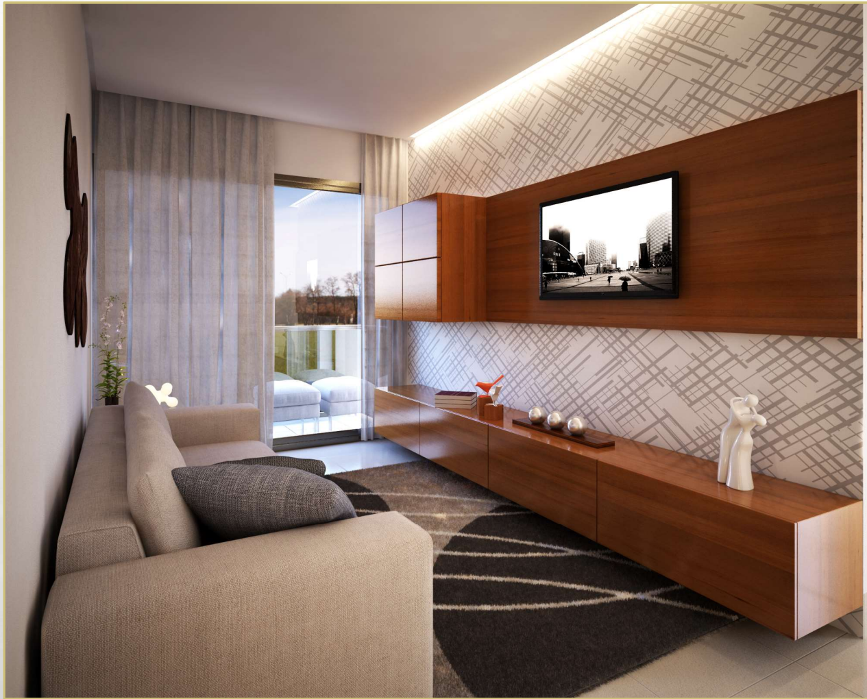
Persp. Sala Estar