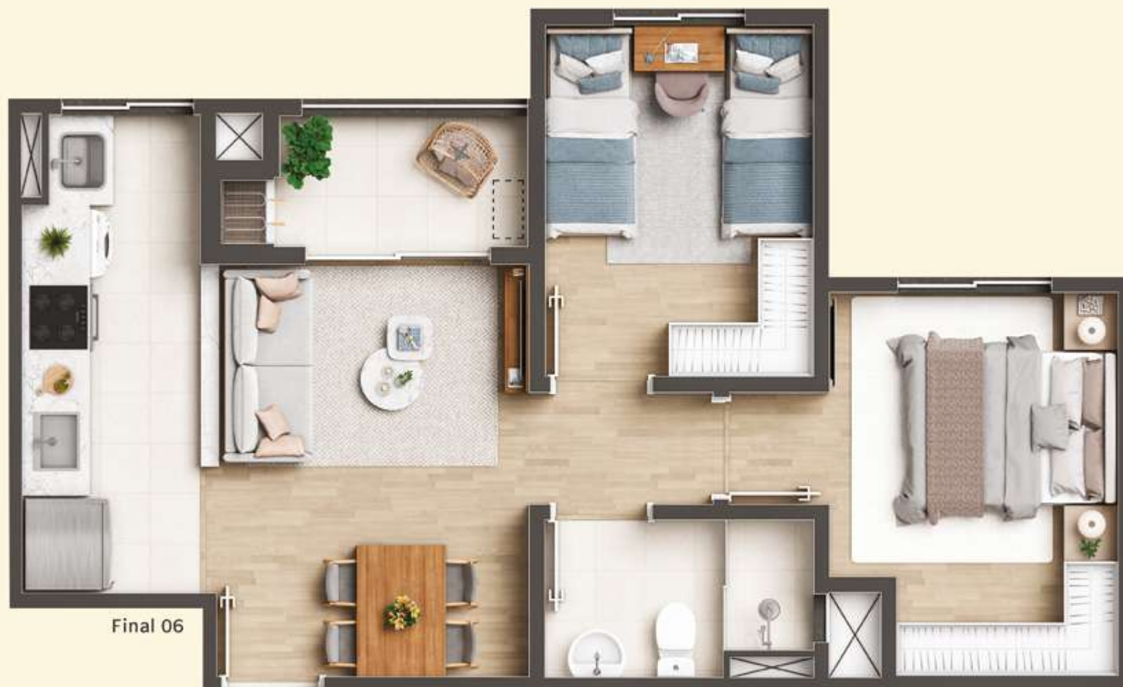
Imagem artística virtual. Cores, texturas, materiais de acabamento e decorativos, paisagismo e detalhes construtivos podem variar por exigências legais quando da aprovação, ou quando da execução. O empreendimento será entregue de acordo com o memorial descritivo.