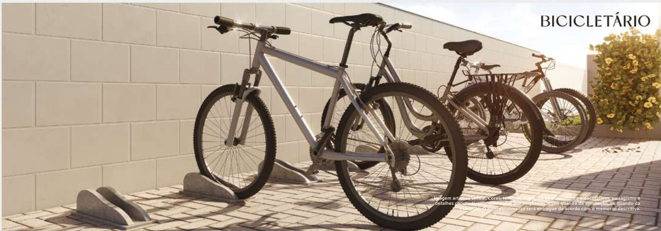
Imagem artística virtual. Cores, texturas, materiais de acabamento e decorativos, paisagismo e detalhes construtivos podem variar por exigências legais quando da aprovação, ou quando da execução. O empreendimento será entregue de acordo com o memorial descritivo.