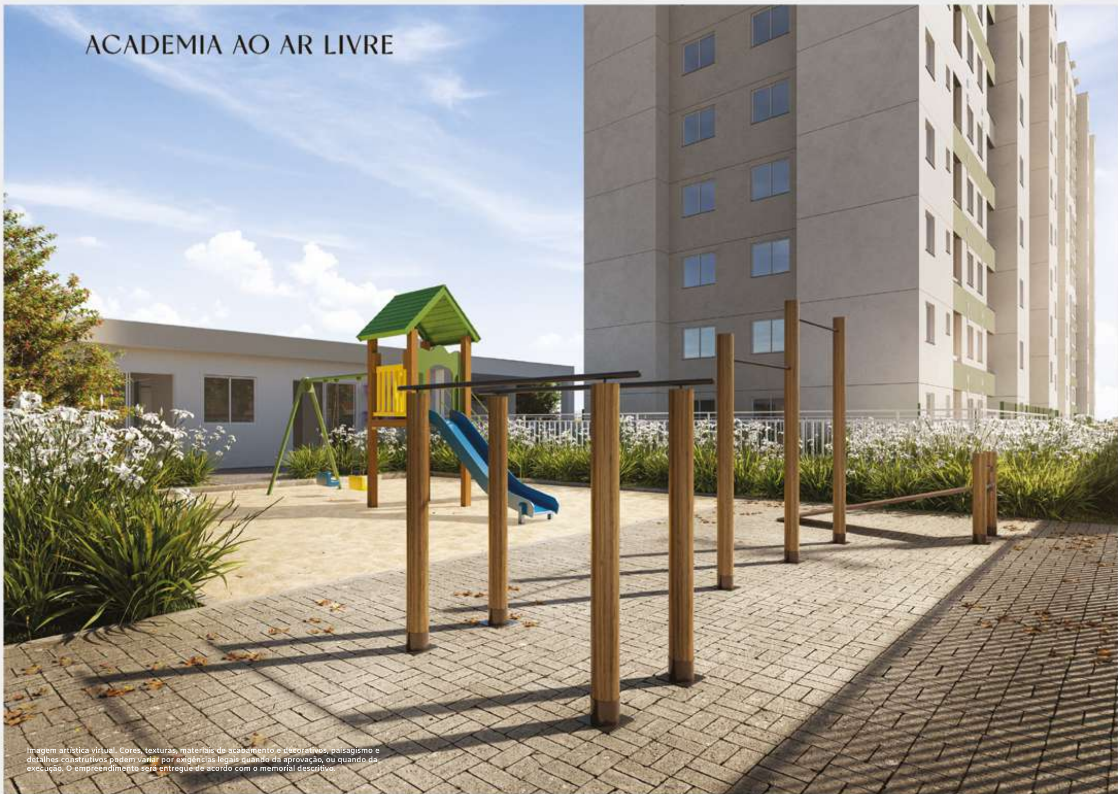
Imagem artística virtual. Cores, texturas, materiais de acabamento e decorativos, paisagismo e detalhes construtivos podem variar por exigências legais quando da aprovação, ou quando da execução. O empreendimento será entregue de acordo com o memorial descritivo.