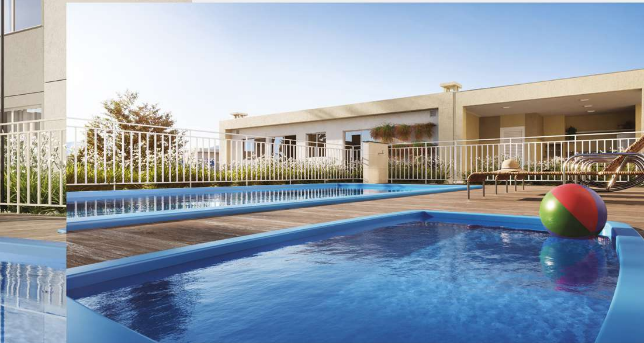
Imagem artística virtual. Cores, texturas, materiais de acabamento e decorativos, paisagismo e detalhes construtivos podem variar por exigências legais quando da aprovação, ou quando da execução. O empreendimento será entregue de acordo com o memorial descritivo.