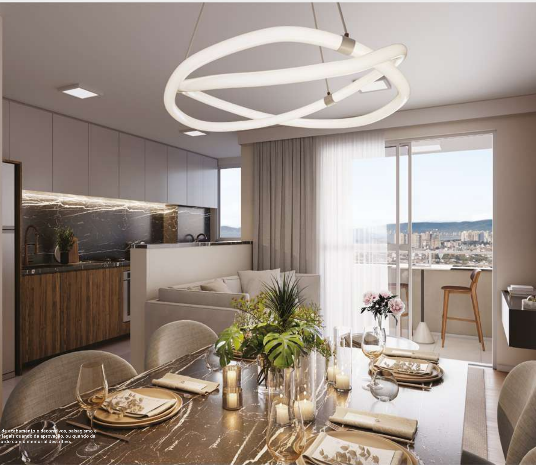
Imagem artística virtual. Cores, texturas, materiais de acabamento e decorativos, paisagismo e detalhes construtivos podem variar por exigências legais quando da aprovação, ou quando da execução. O empreendimento será entregue de acordo com o memorial descritivo.