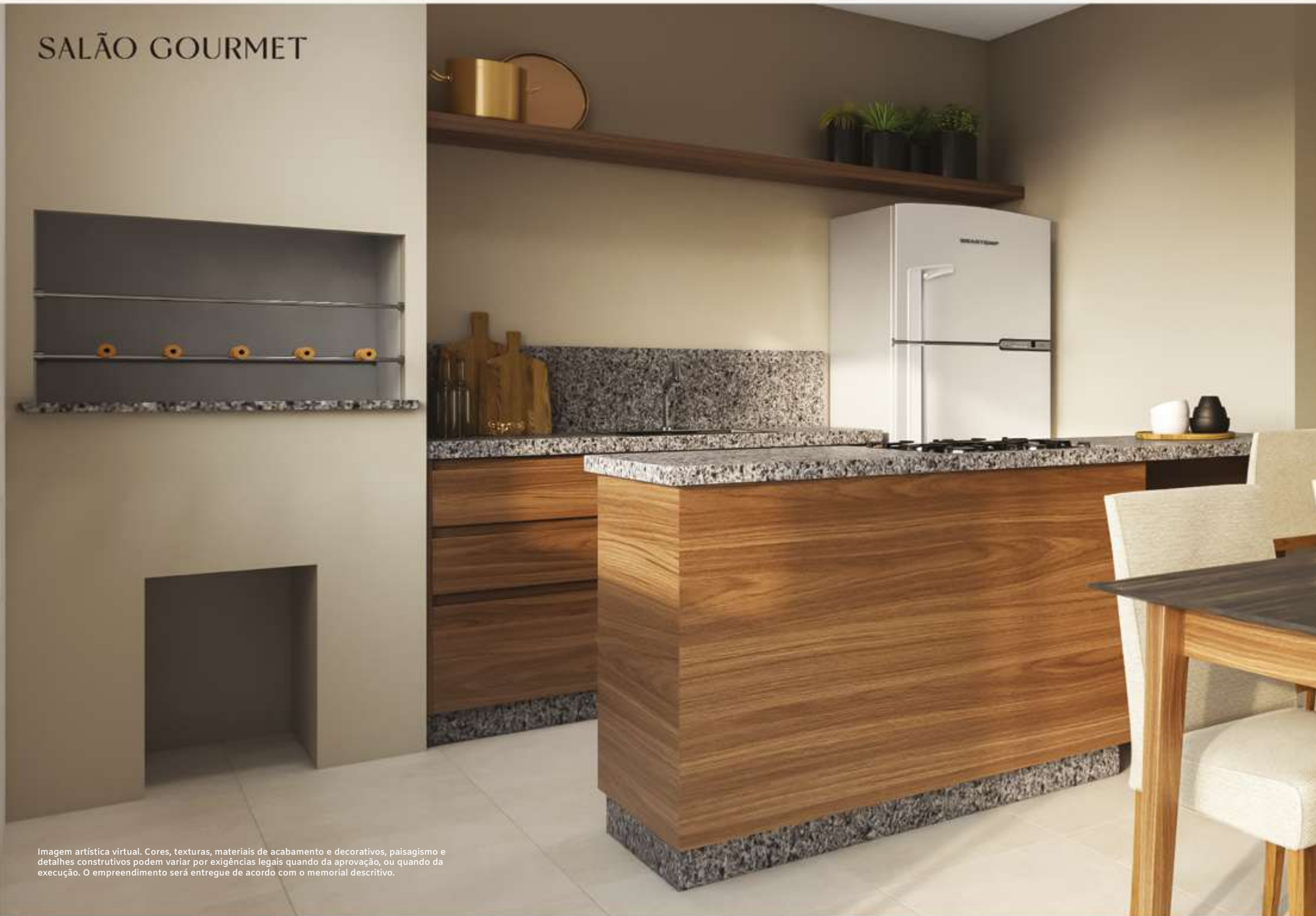
Imagem artística virtual. Cores, texturas, materiais de acabamento e decorativos, paisagismo e detalhes construtivos podem variar por exigências legais quando da aprovação, ou quando da execução. O empreendimento será entregue de acordo com o memorial descritivo.