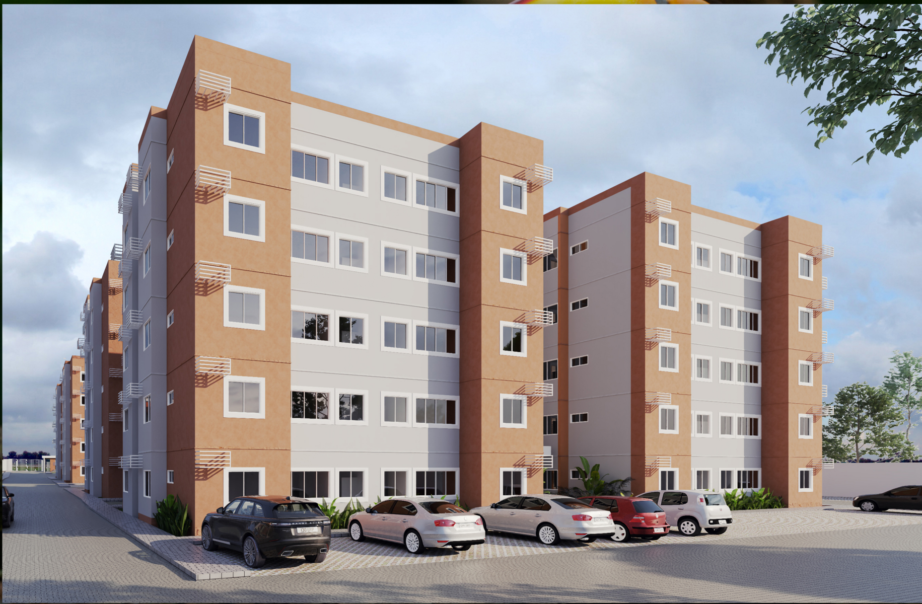
ILUSTRAÇÃO ARTÍSTICA DE APARTAMENTOS EM UM CONDOMÍNIO NO CIDADE RESERVA LESTE