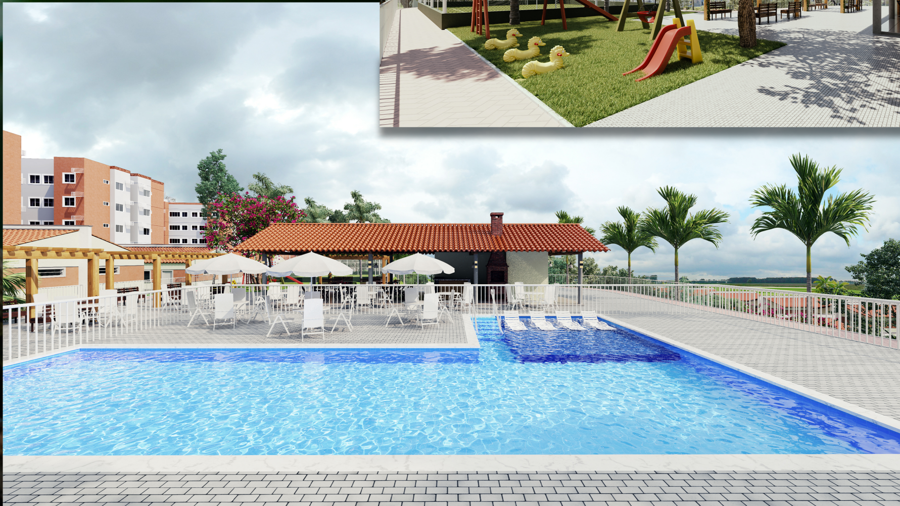
ILUSTRAÇÃO ARTÍSTICA DE LAZER EM UM CONDOMÍNIO NO CIDADE RESERVA LESTE