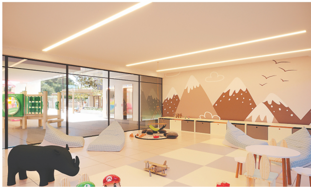
Briquadoteca montada para a criançada