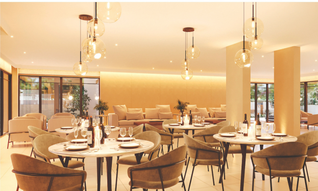
As maiores festas irão acontecer aqui!