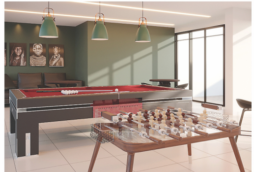
Muita diversão nesse salão de jogos