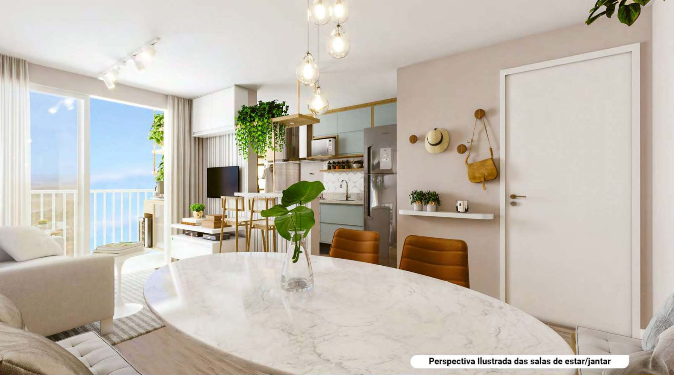
Perspectiva Ilustrada das salas de estar/jantar