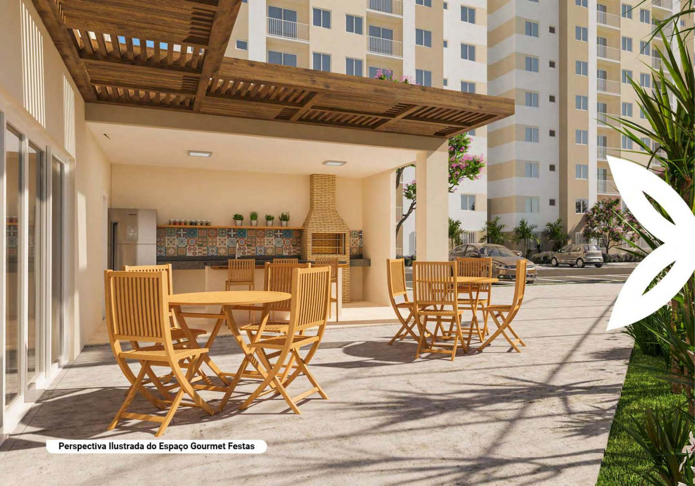
Perspectiva Ilustrada do Espaço Gourmet Festas