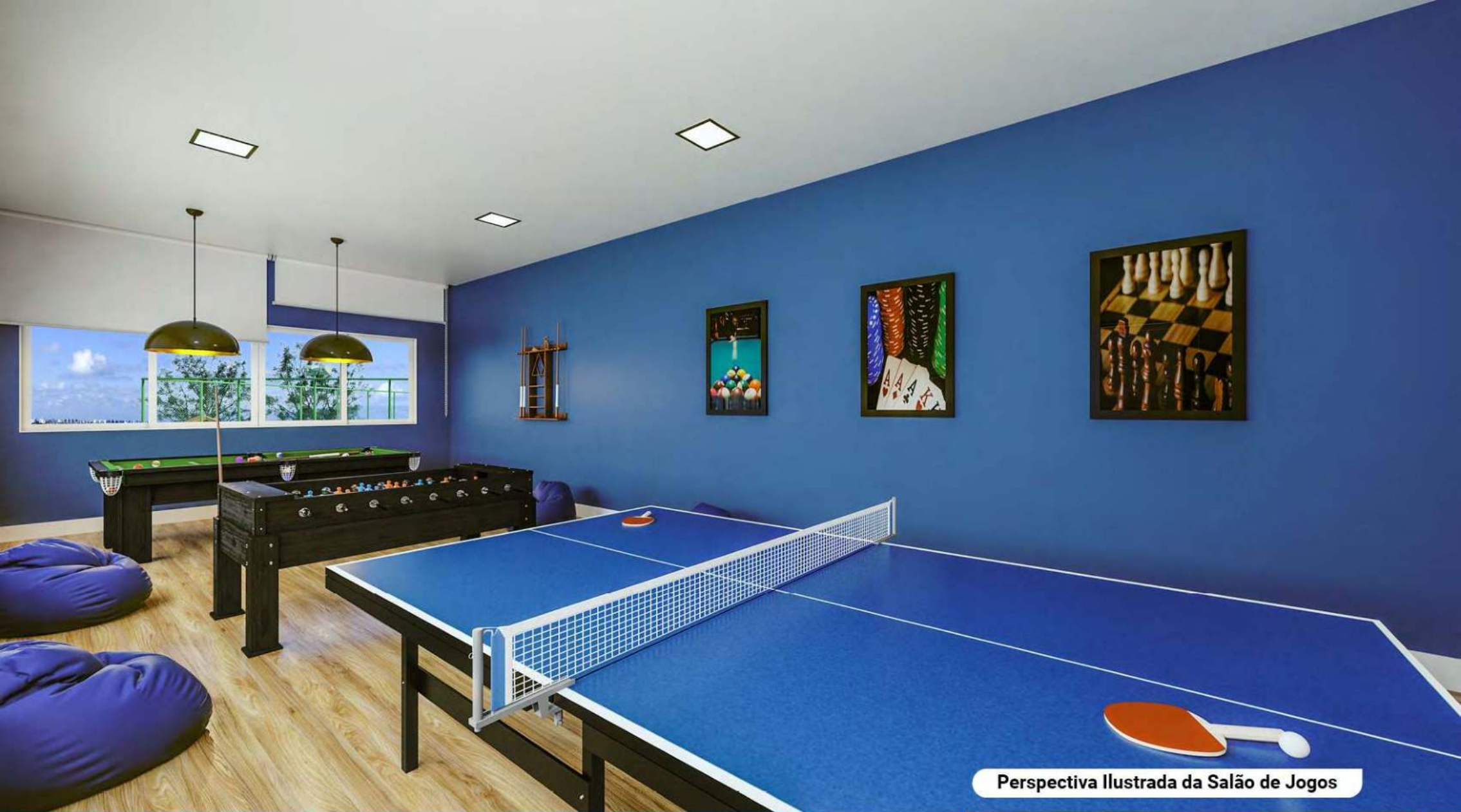
Perspectiva Ilustrada da Salão de Jogos