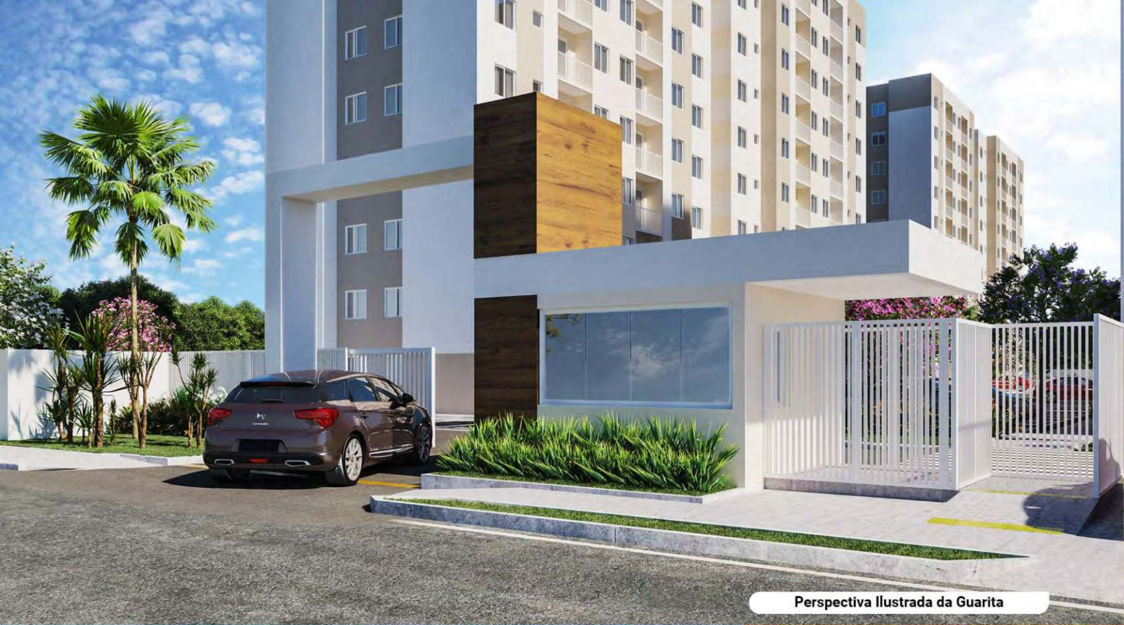
Perspectiva Ilustrada da Guarita