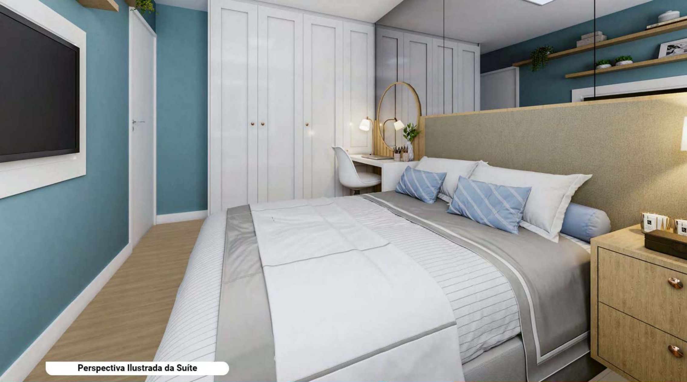
Perspectiva Ilustrada da Suíte