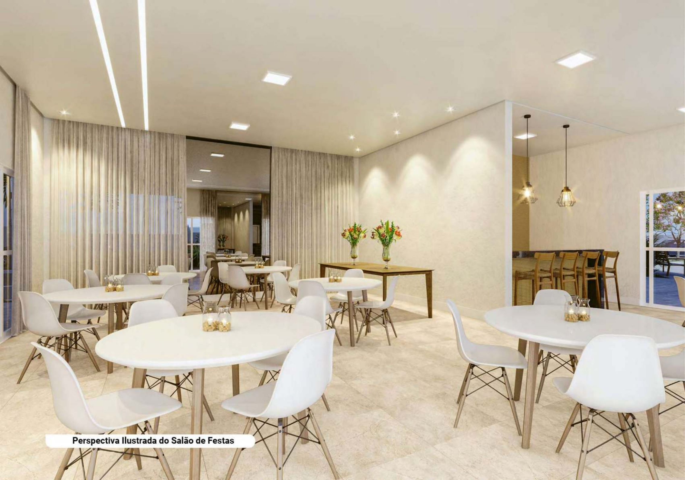
Perspectiva Ilustrada do Salão de Festas