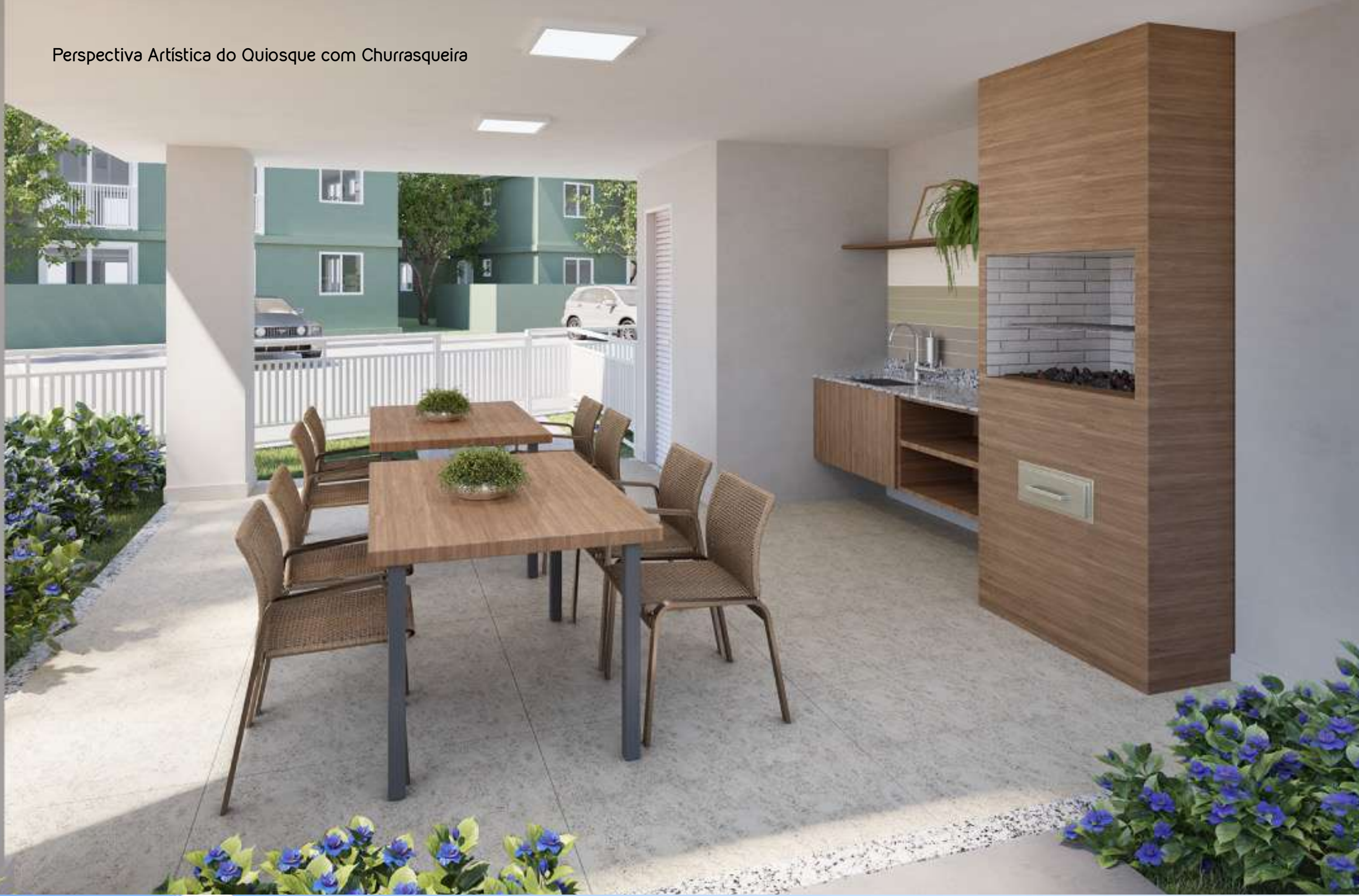
Perspectiva Artística do Quiosque com Churrasqueira