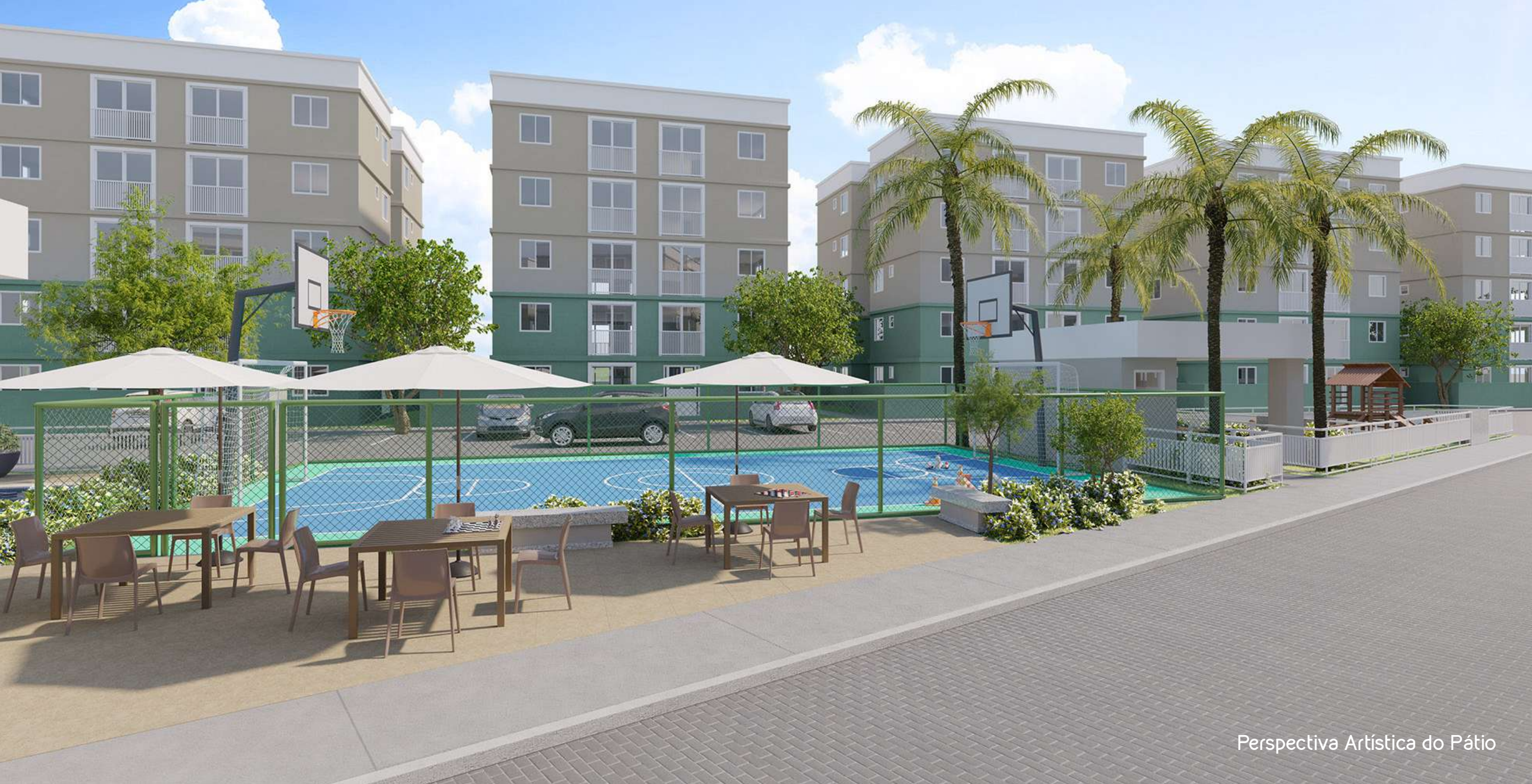
Perspectiva Artística do Pátio