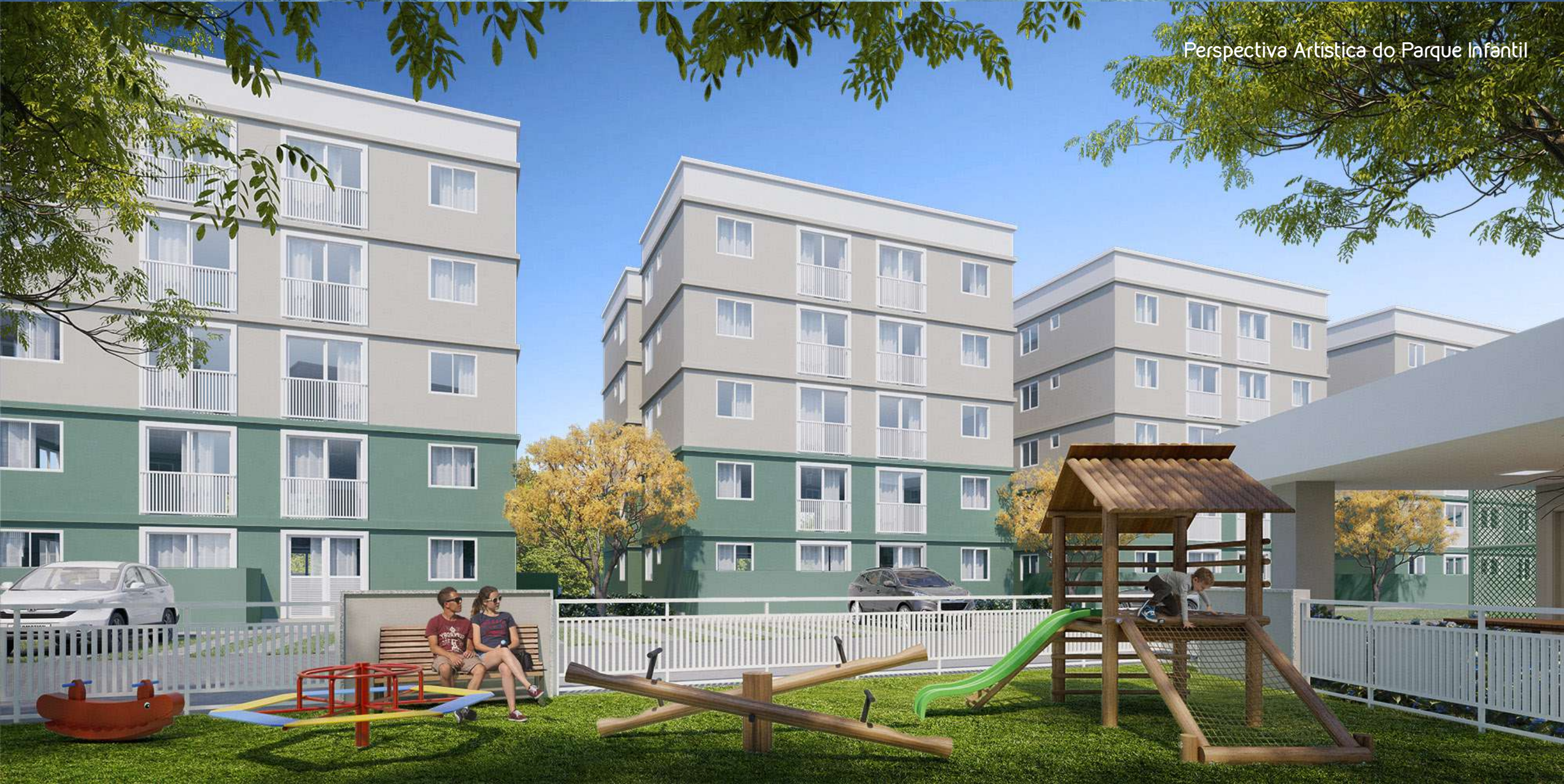
Perspectiva Artística do Parque Infantil