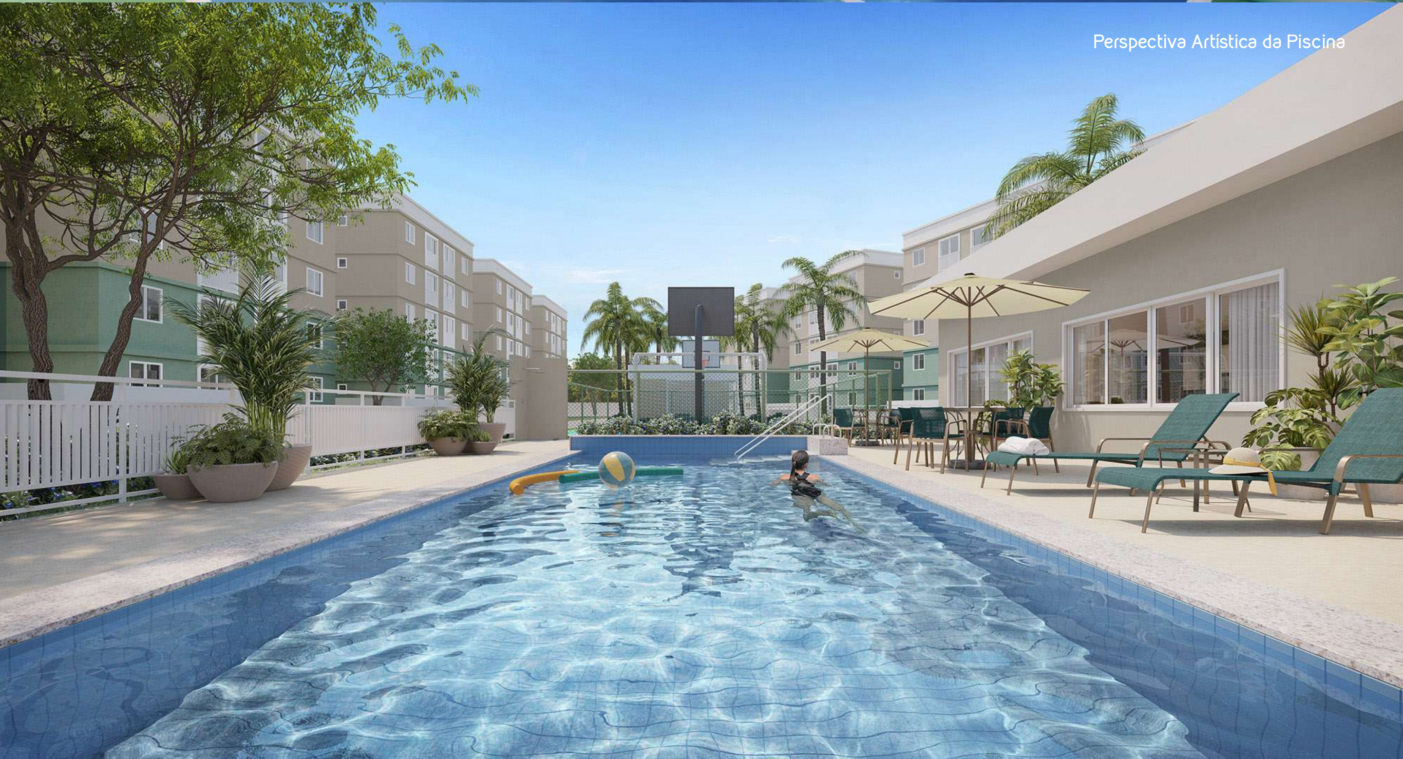
Perspectiva Artística da Piscina