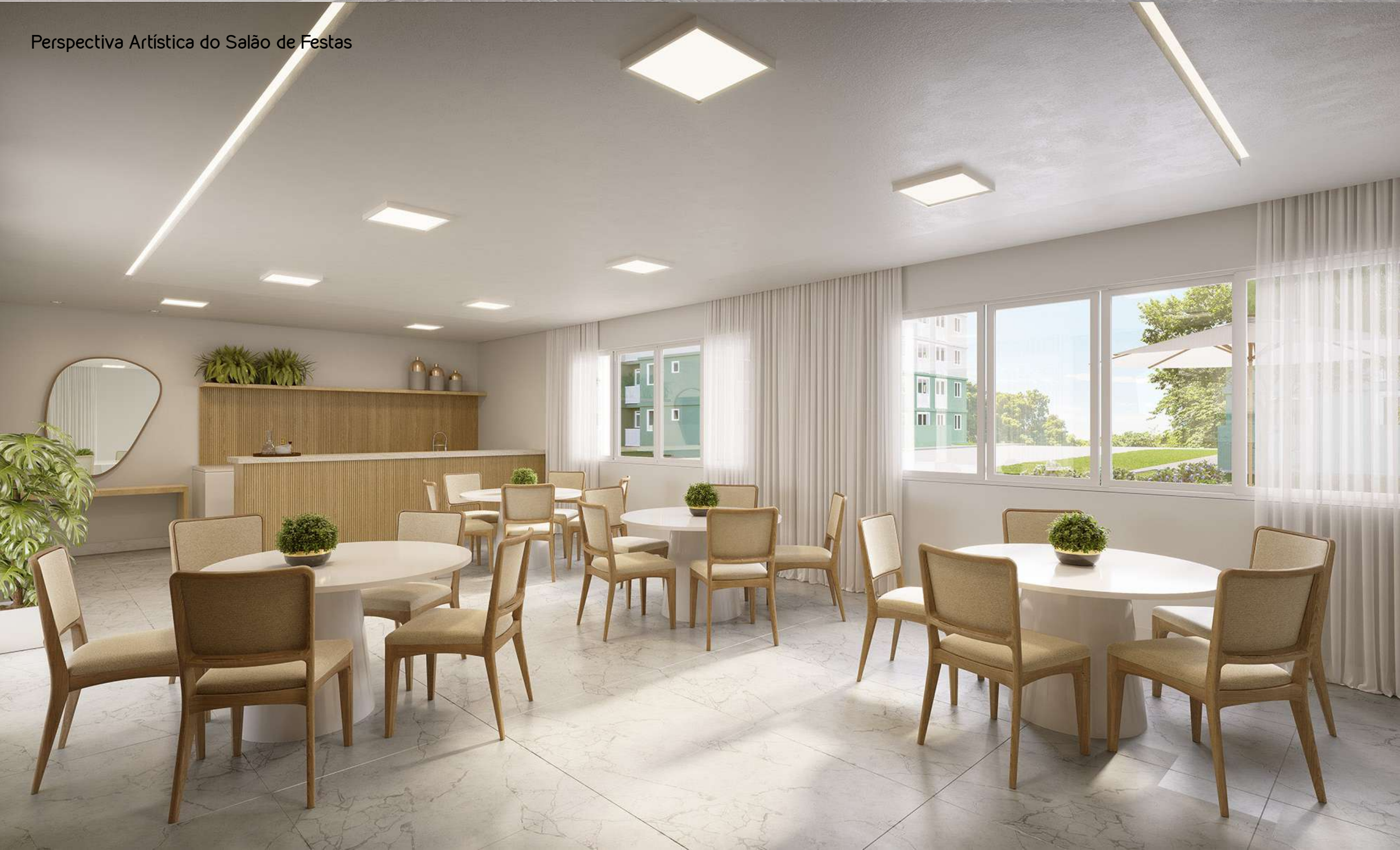
Perspectiva Artística do Salão de Festas