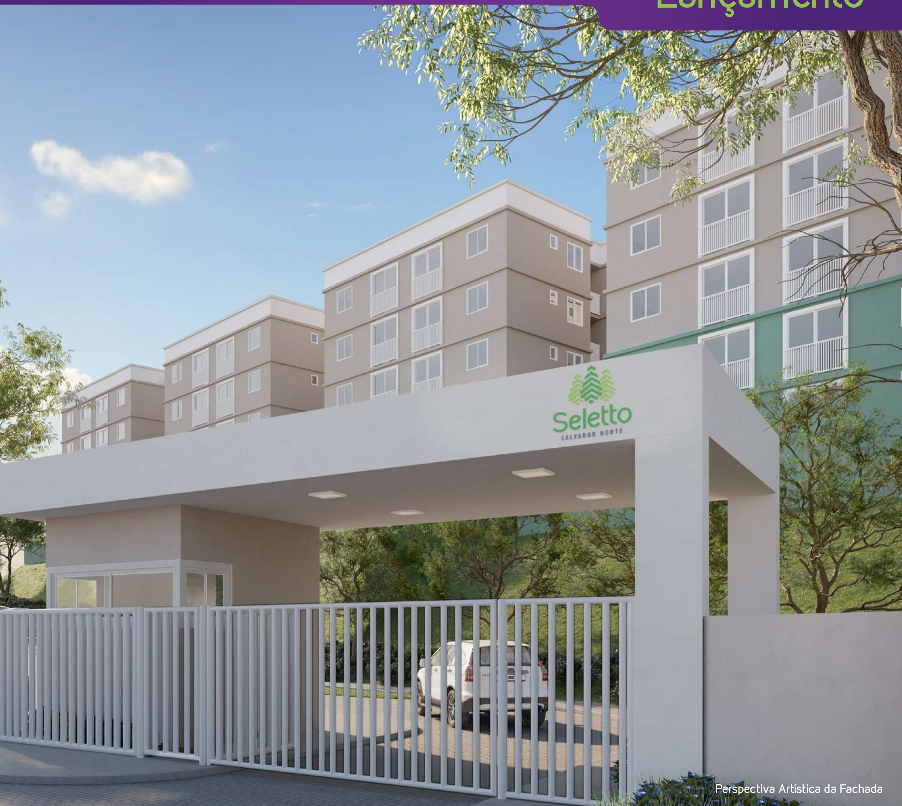
Perspectiva Artística da Fachada

Seu 2 quartos pertinho do Salvador Norte Shopping e com muito espaço reservado para sua felicidade.