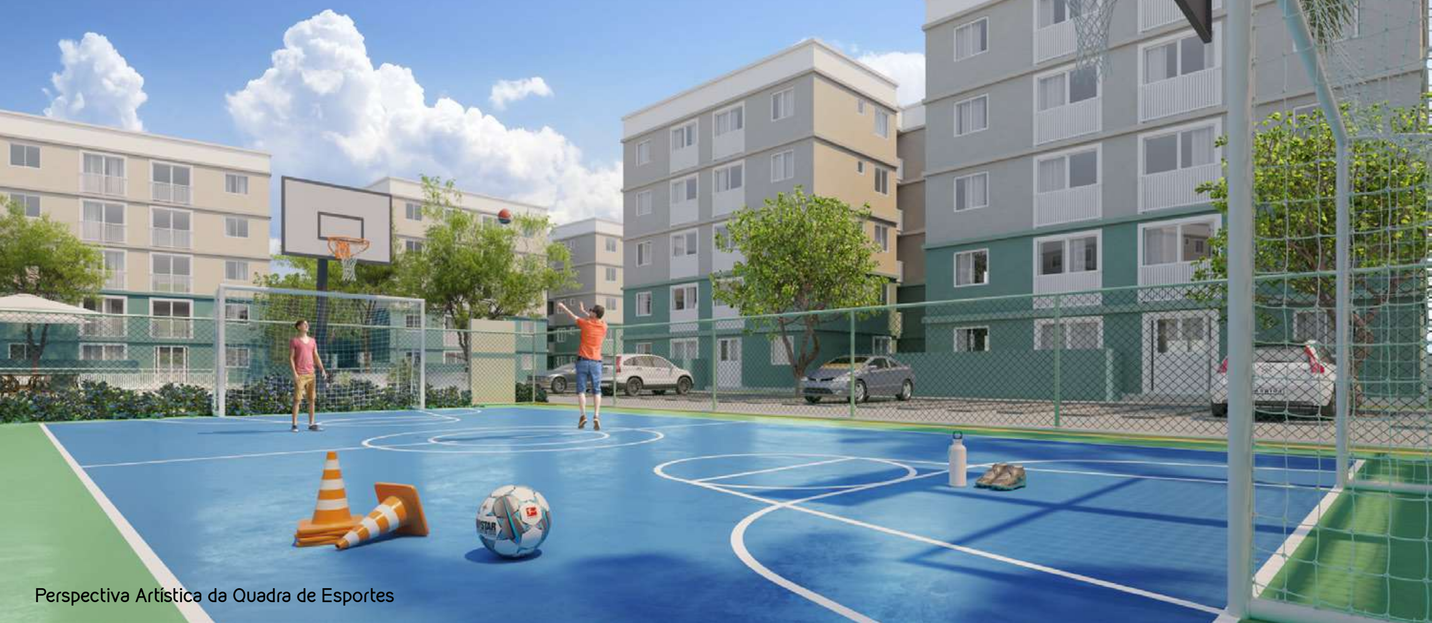
Perspectiva Artística da Quadra de Esportes

Condomínio fechado com lazer completo. Onde o conforto encontra a tranquilidade.