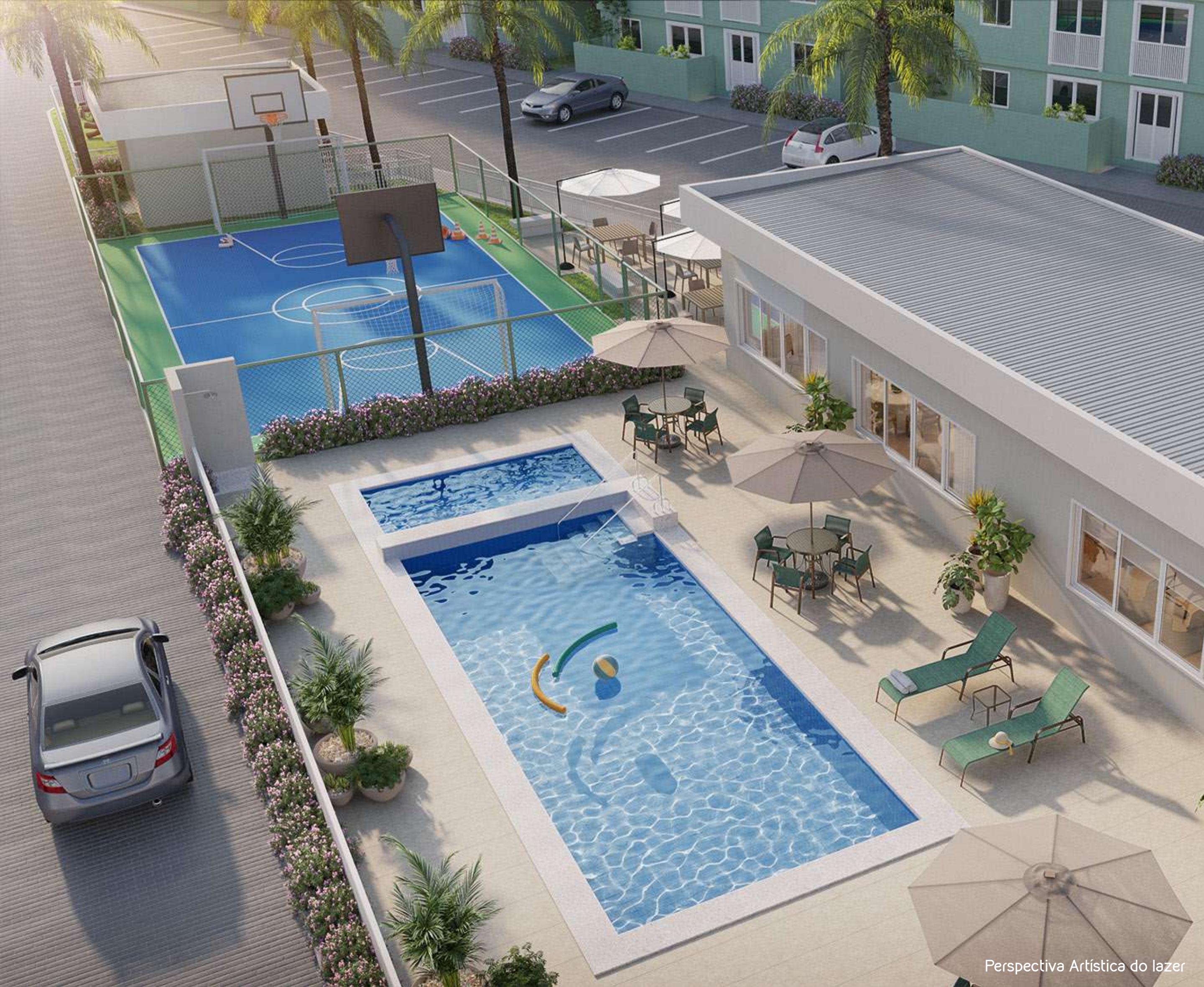
Perspectiva Artística do lazer