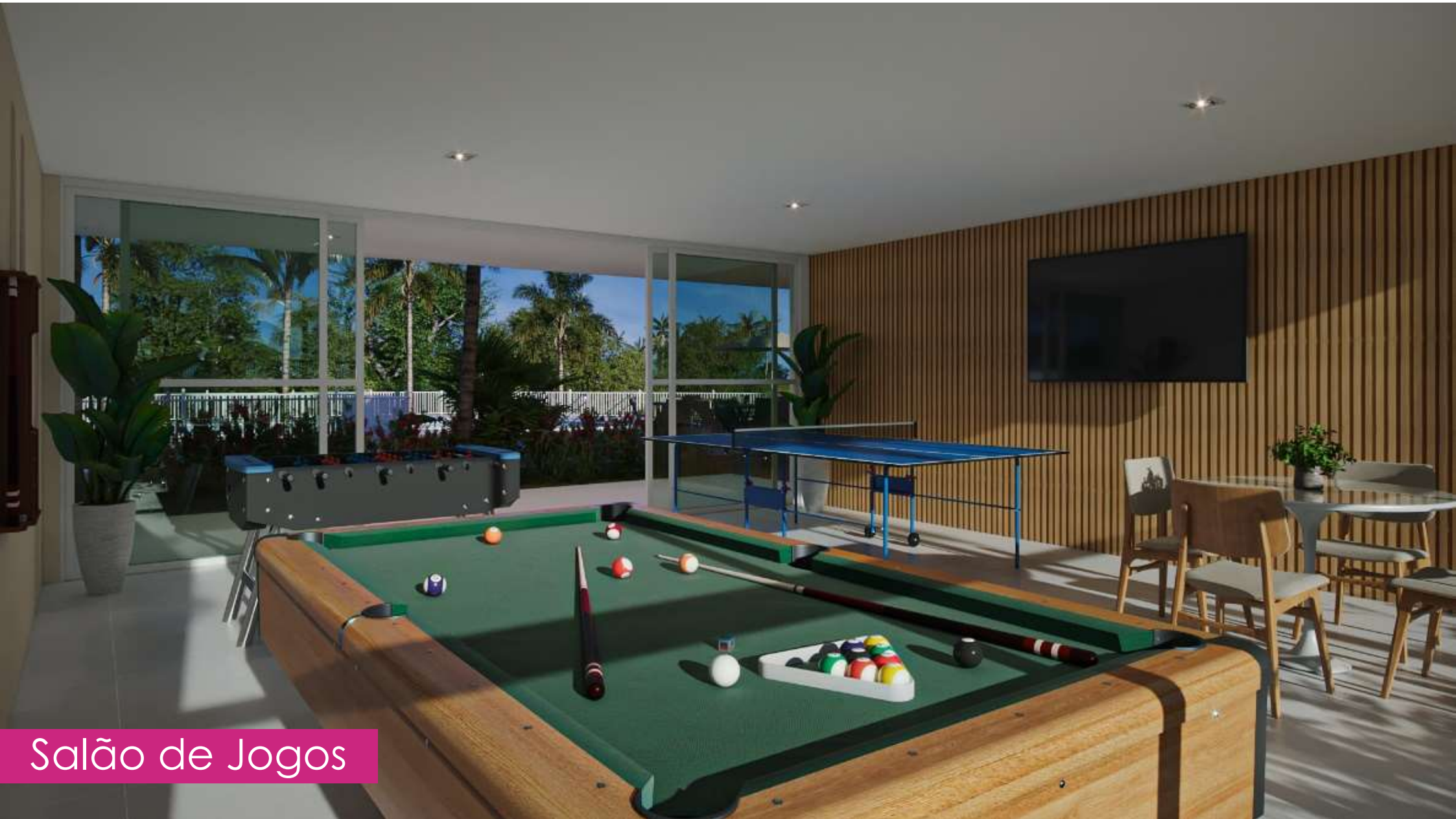
Salão de Jogos