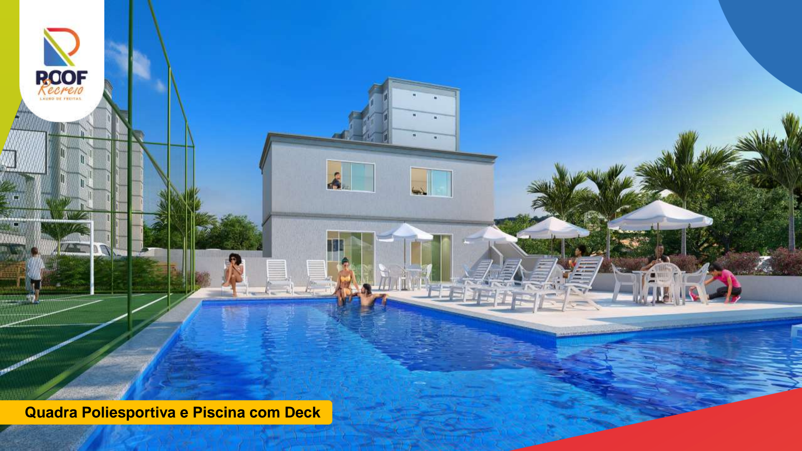
Quadra Poliesportiva e Piscina com Deck