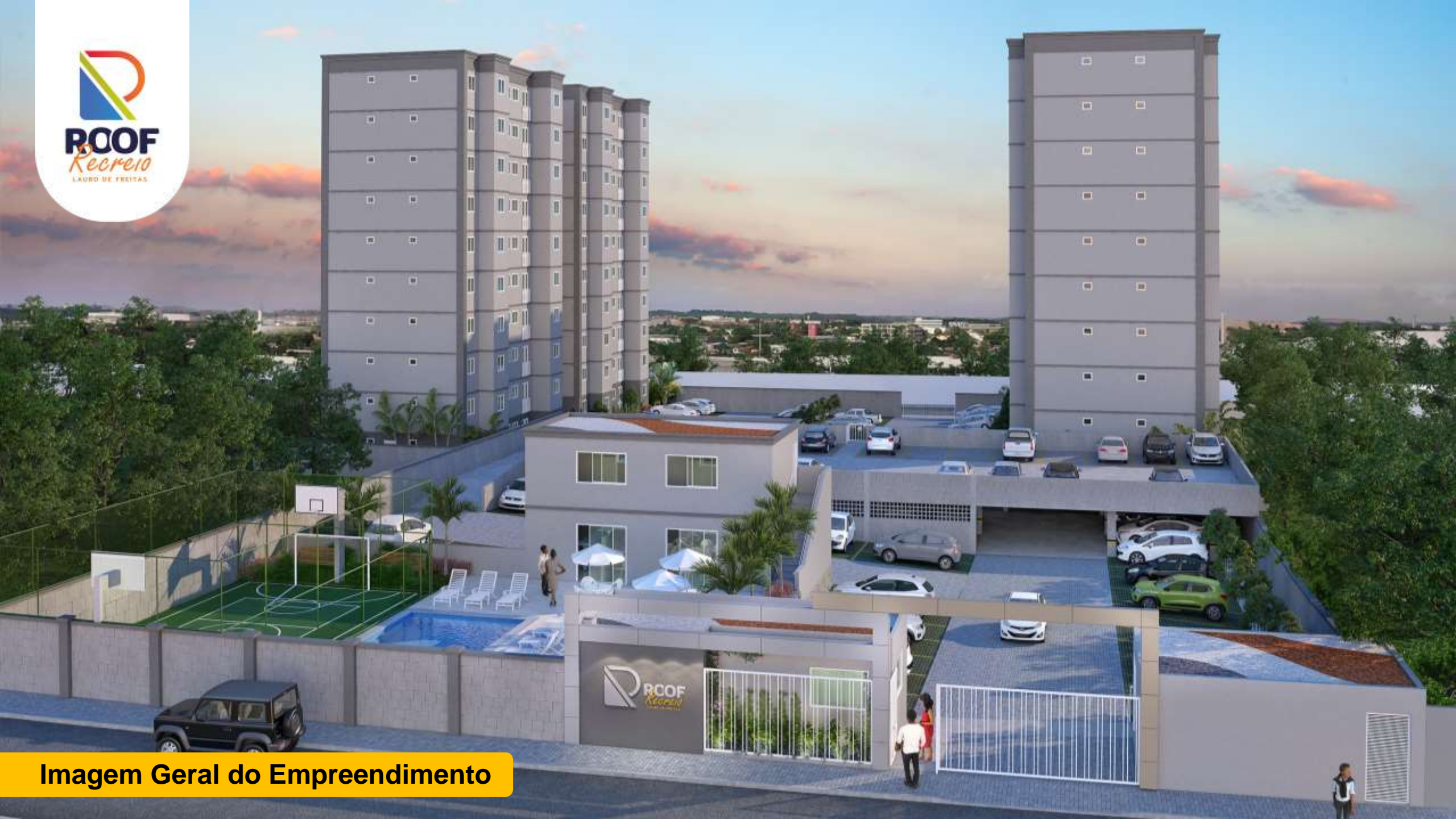
Imagem Geral do Empreendimento