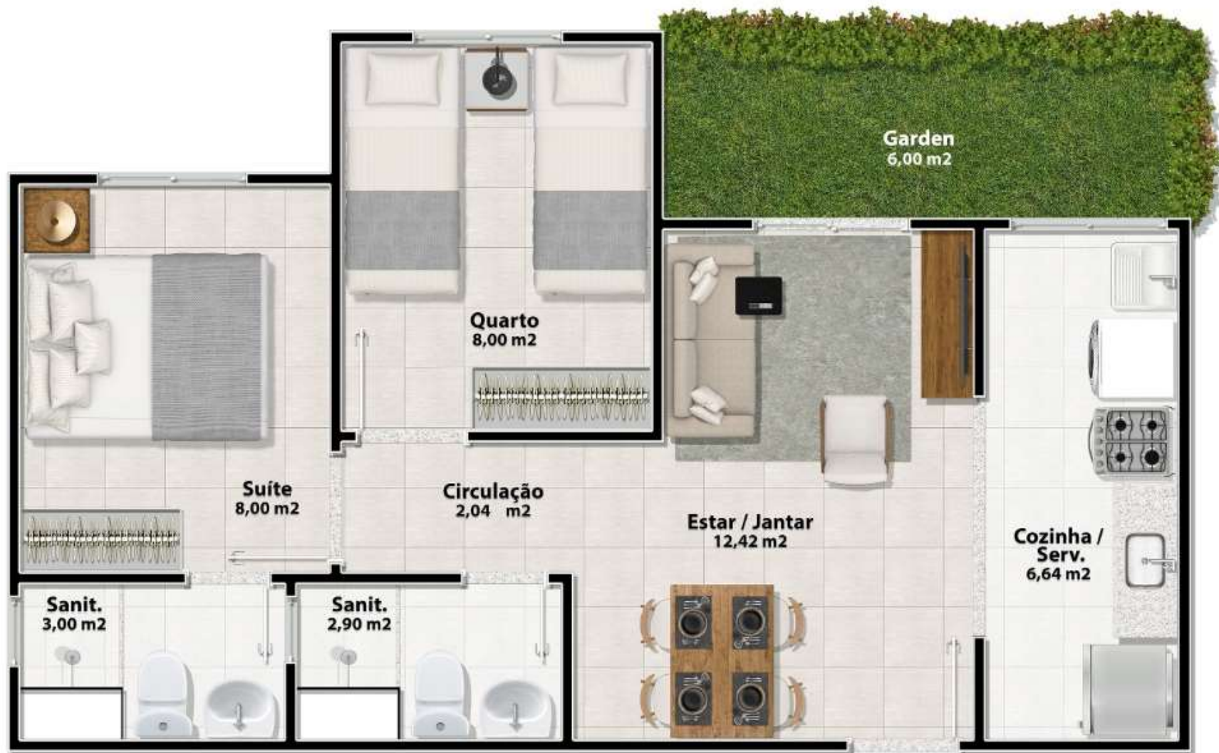
Layout apartamento 49,00 m 2