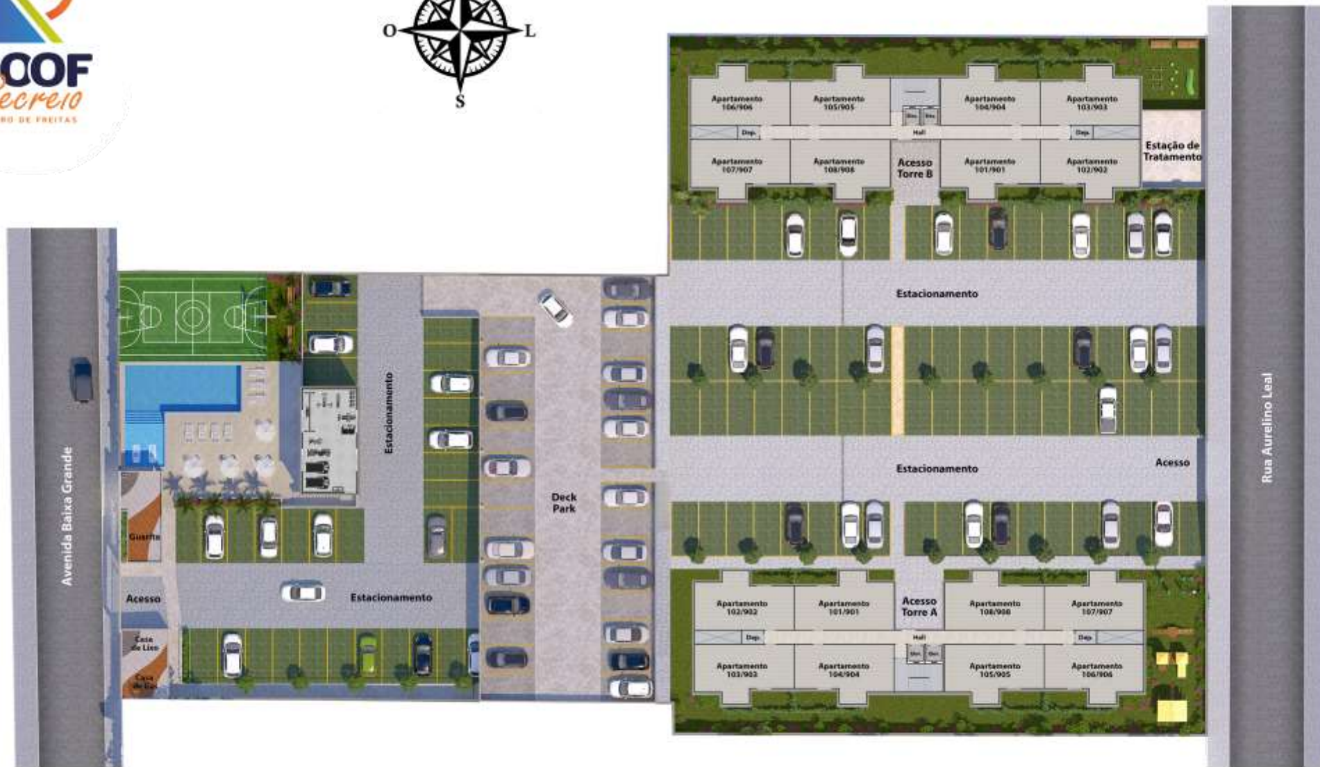
Implantação pavimento superior