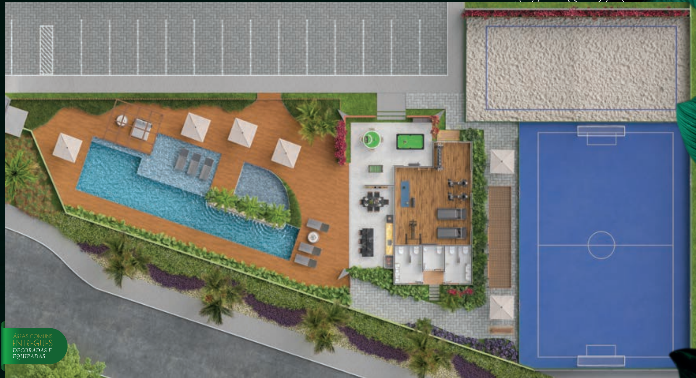
PERSPECTIVA CLUBE 1