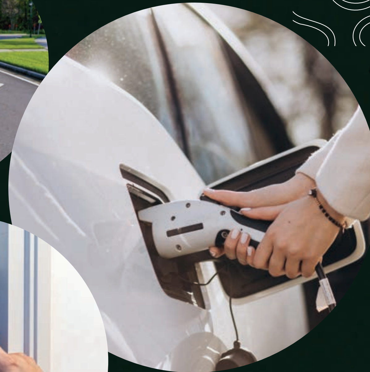
Carregamento compartilhado para carros elétricos