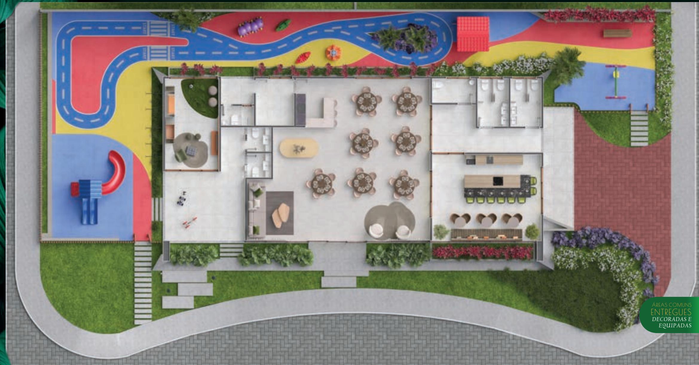
PERSPECTIVA CLUBE 2