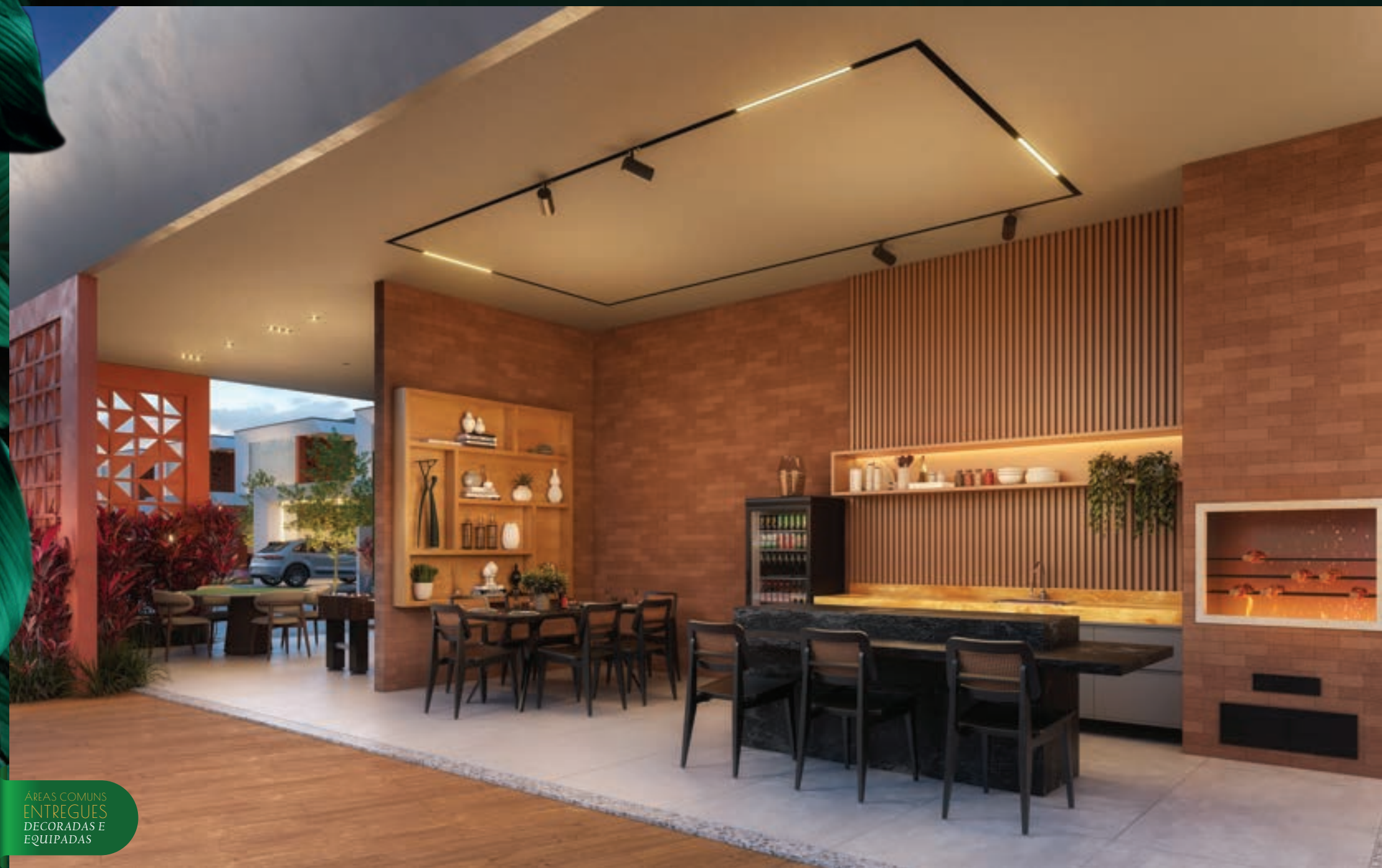
PERSPECTIVA DA VARANDA

ÁREAS COMUNS ENTREGUES DECORADAS E EQUIPADAS