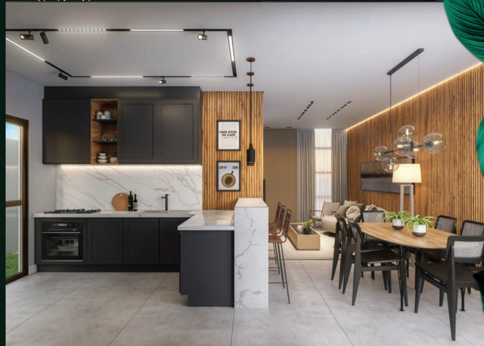
PERSPECTIVA DA COZINHA