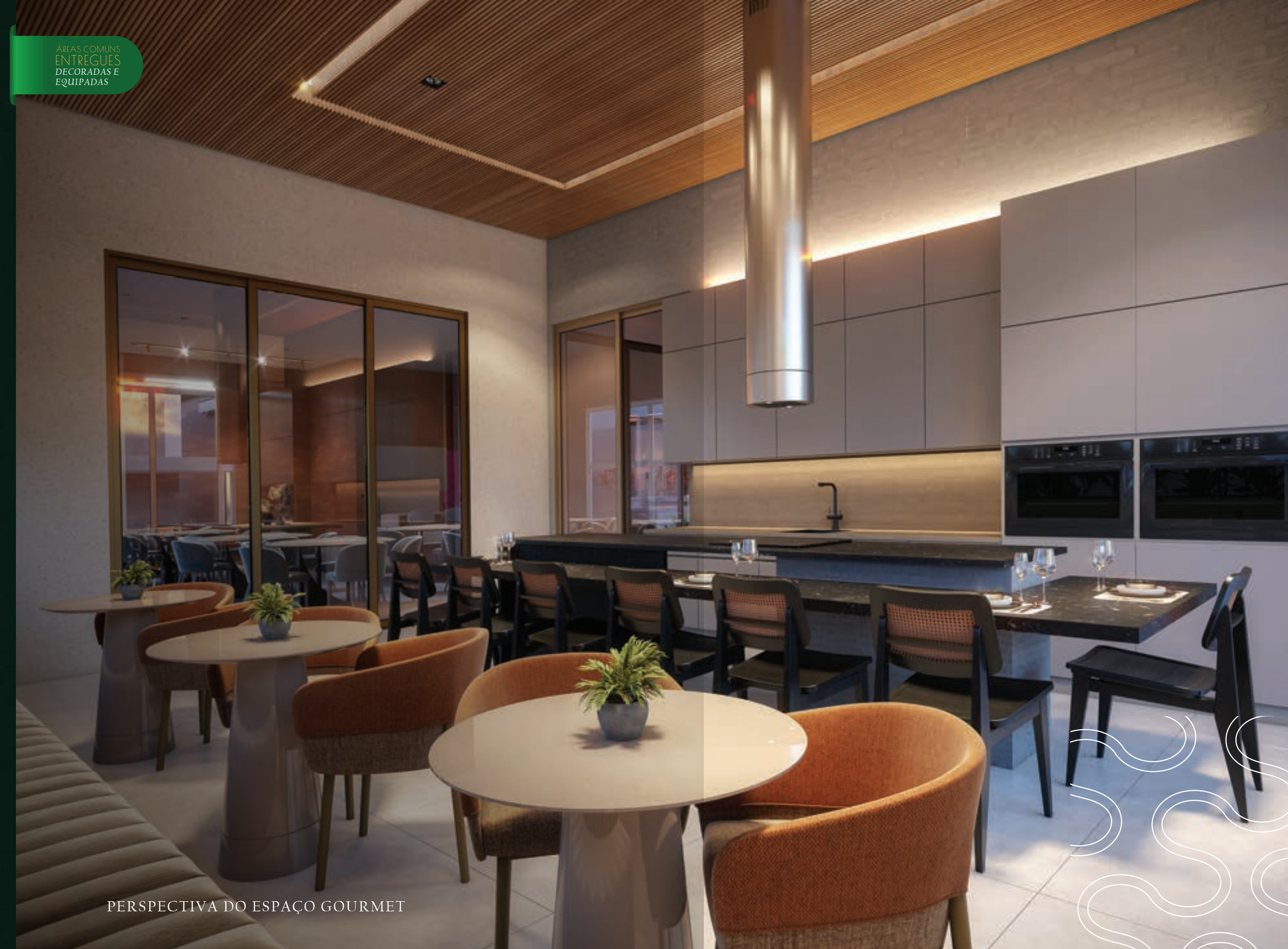
PERSPECTIVA DO ESPAÇO GOURMET