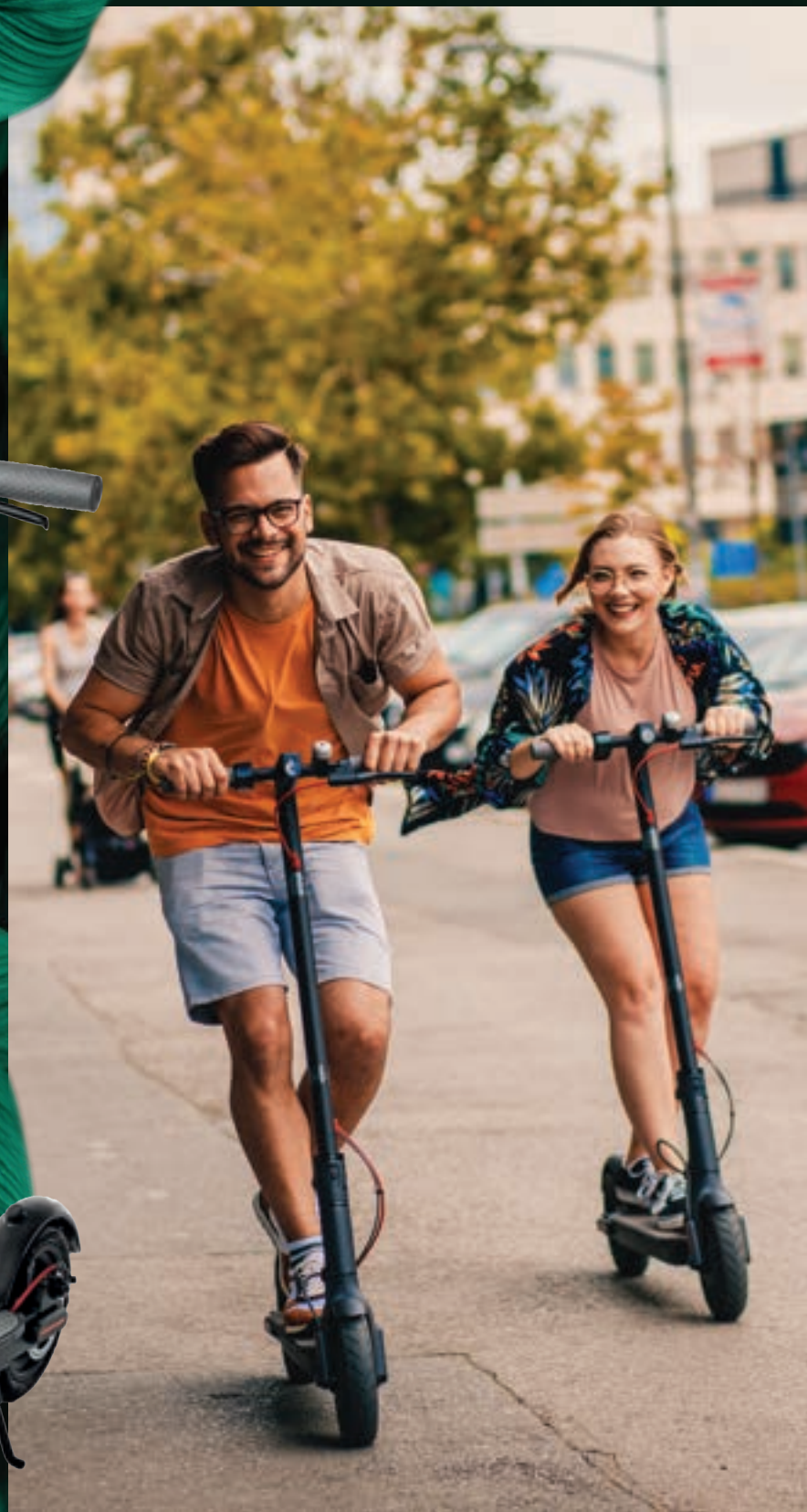
Patinetes elétricos e bikes para uso compartilhado