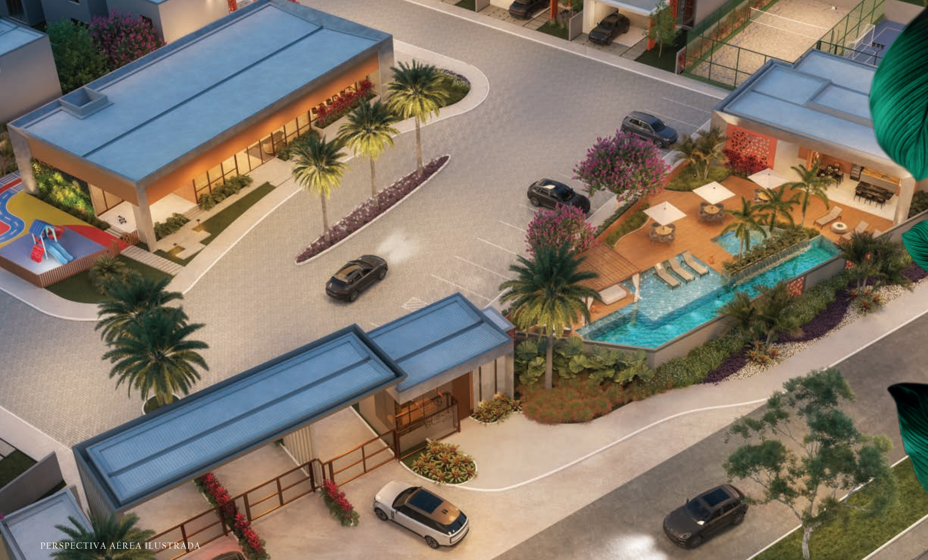
PERSPECTIVA AÉREA ILUSTRADA