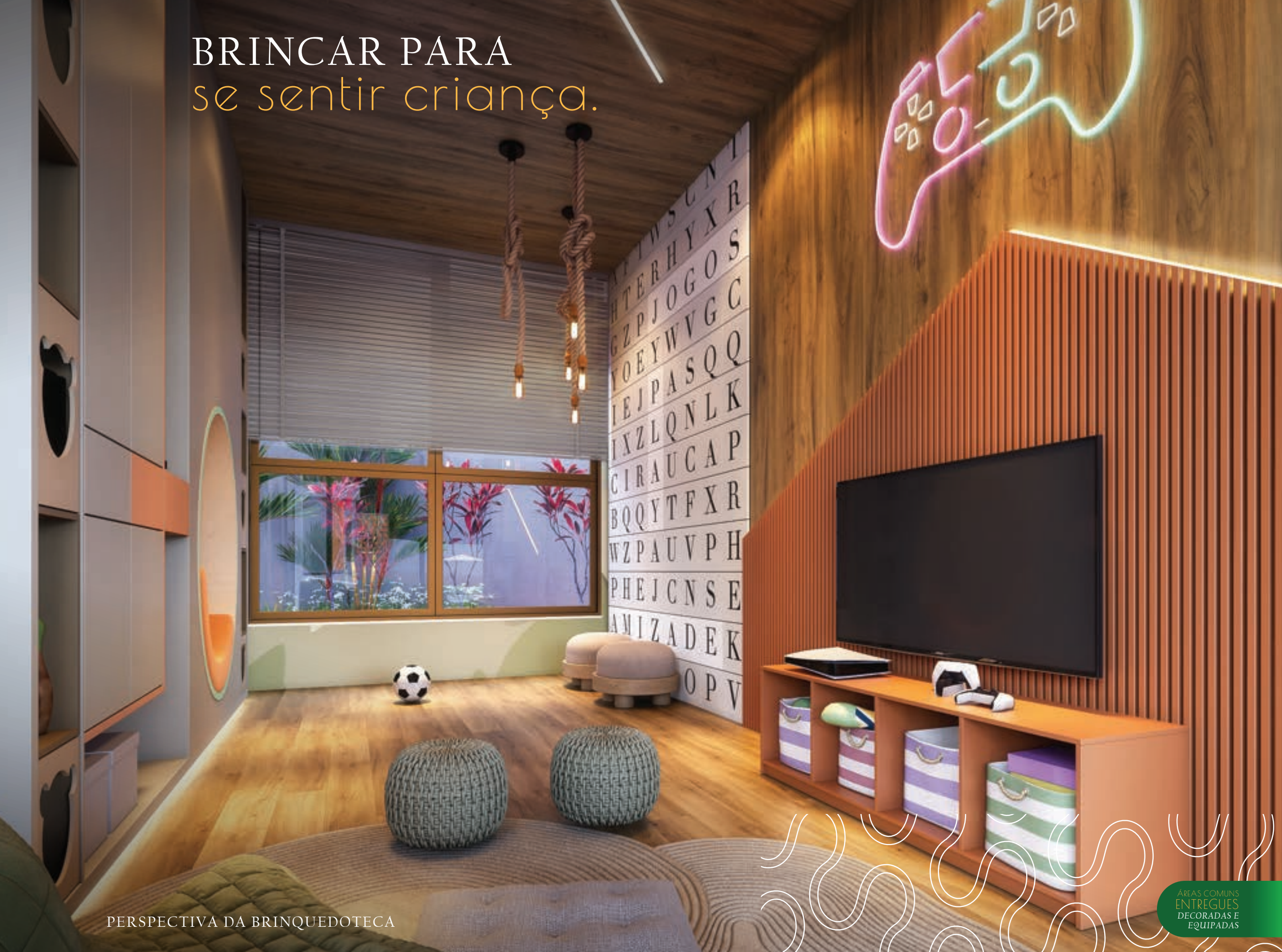
PERSPECTIVA DA BRINQUEDOTECA

ÁREAS COMUNS ENTREGUES DECORADAS E EQUIPADAS