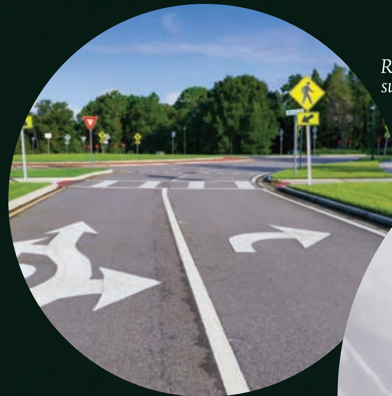
Rede de energia subterrânea