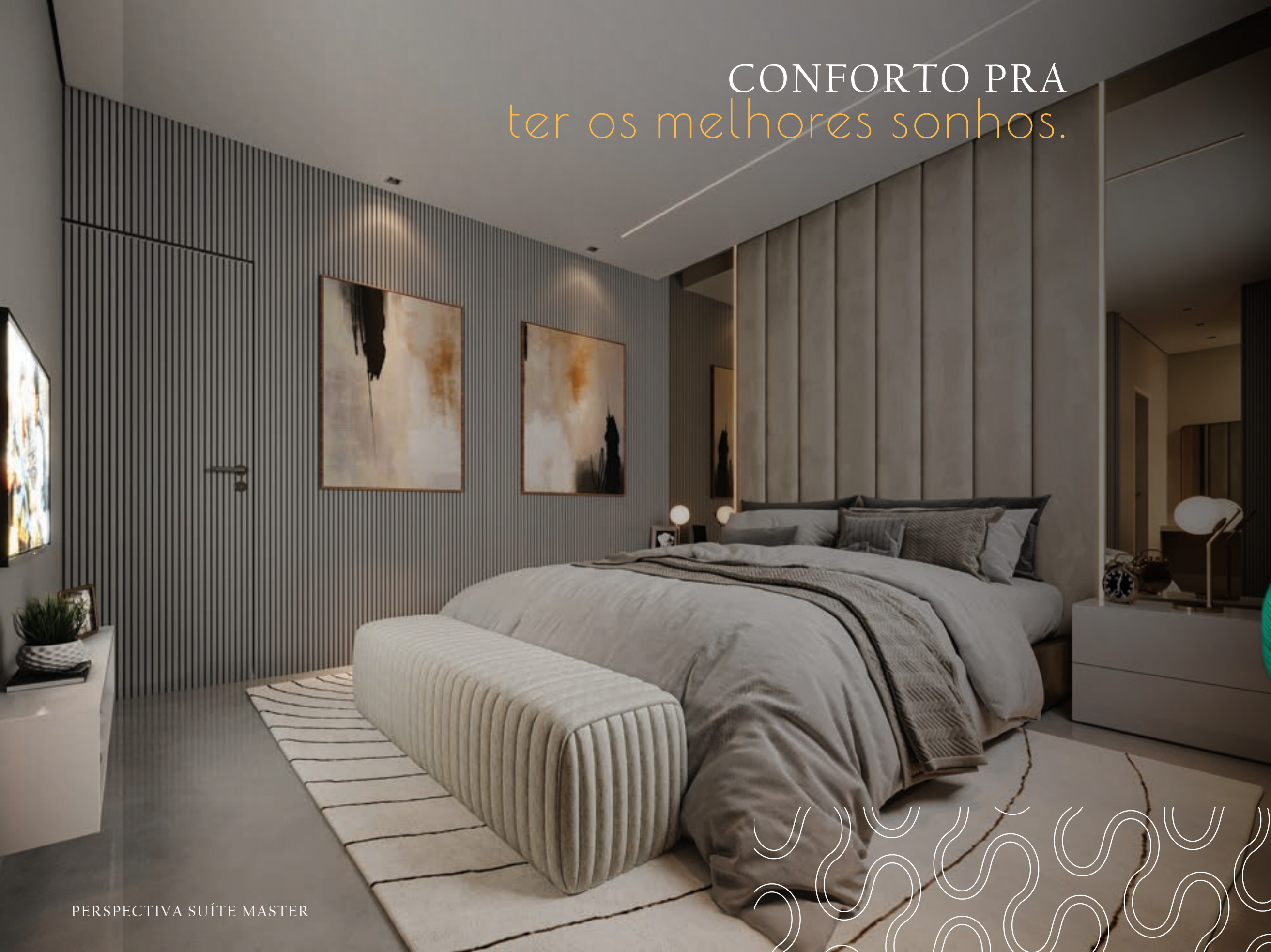
PERSPECTIVA SUÍTE MASTER