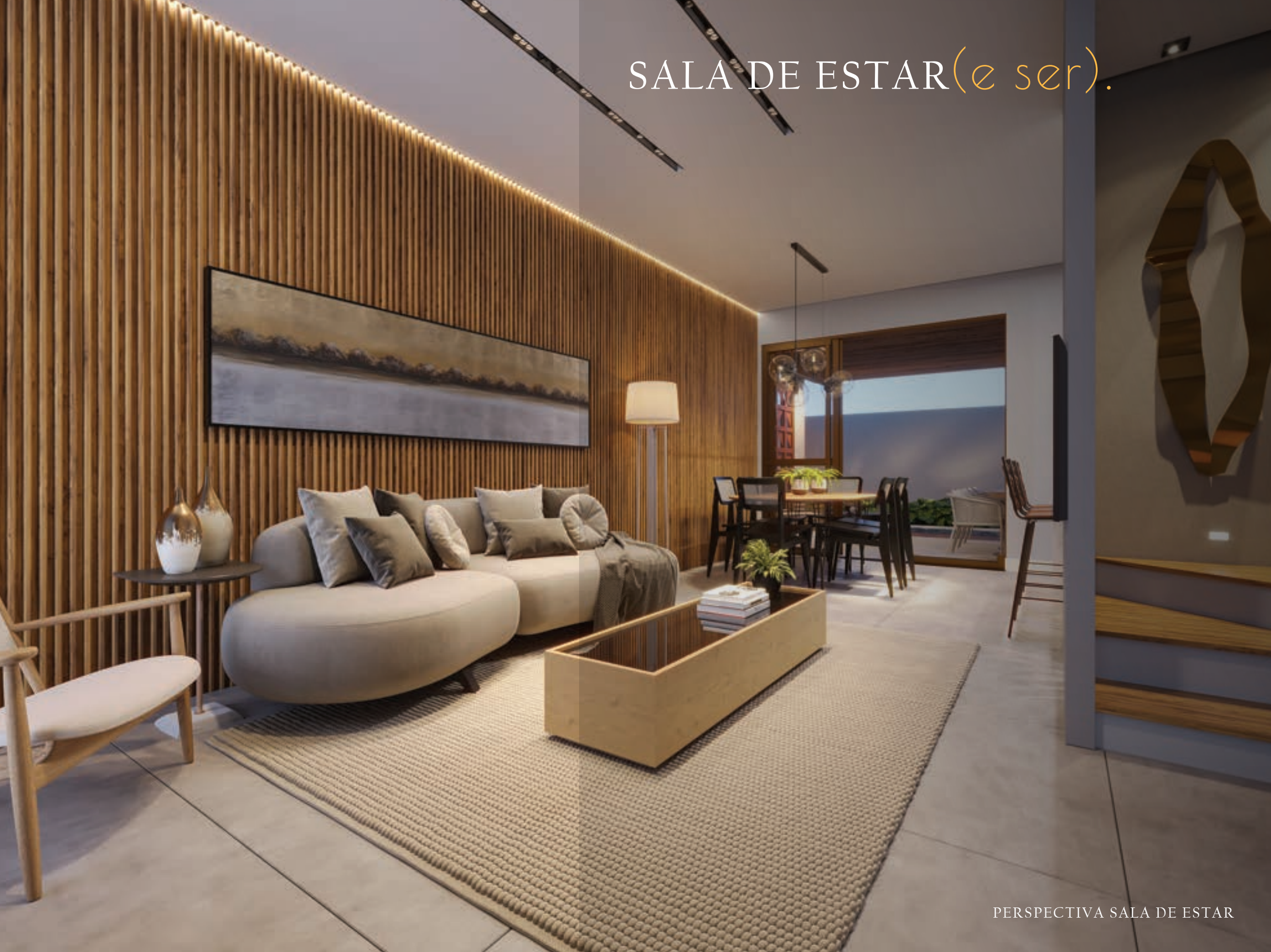
PERSPECTIVA SALA DE ESTAR