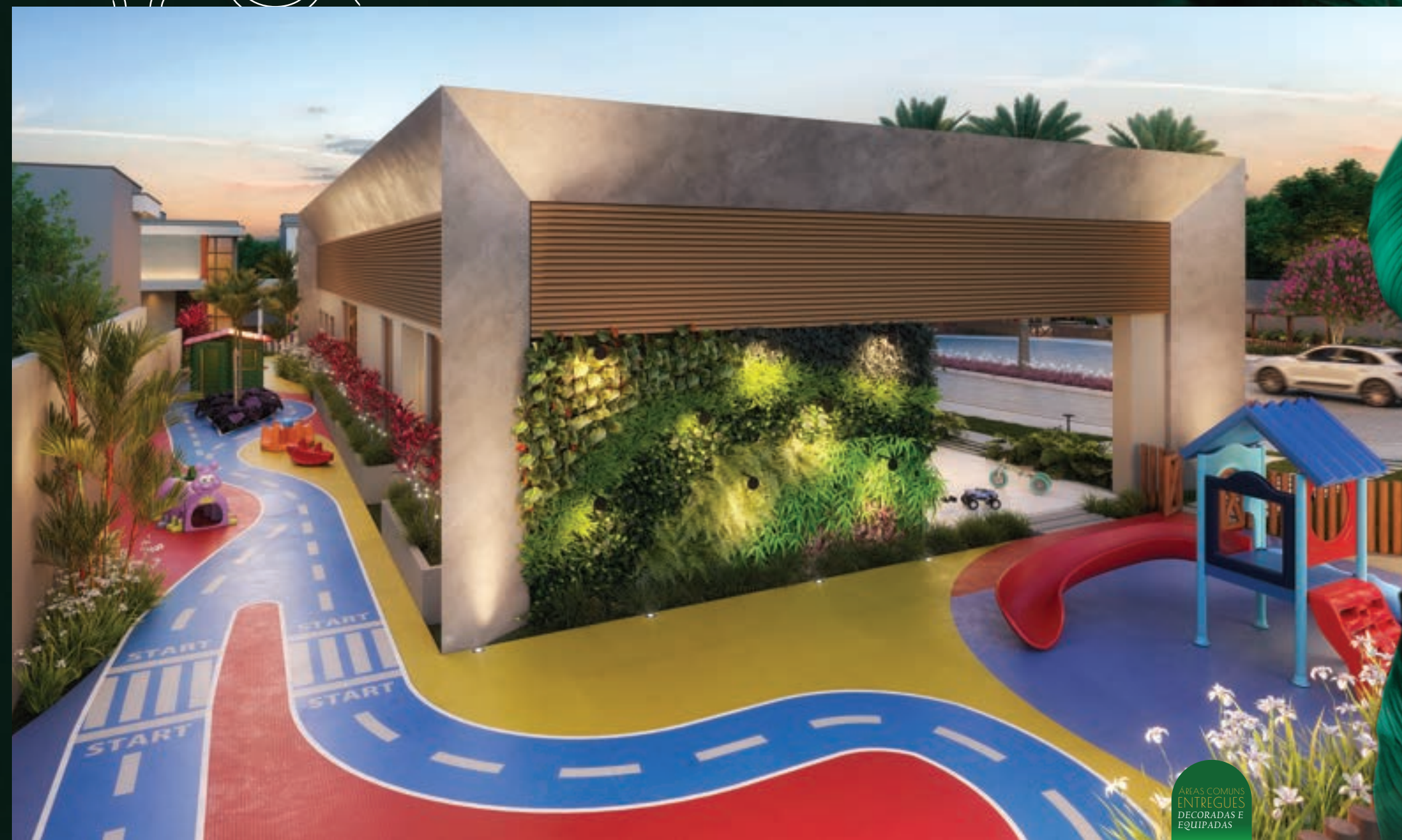
PERSPECTIVA DO KIDS CENTER

PARQUE INFANTIL para sentir a infância acolhida.