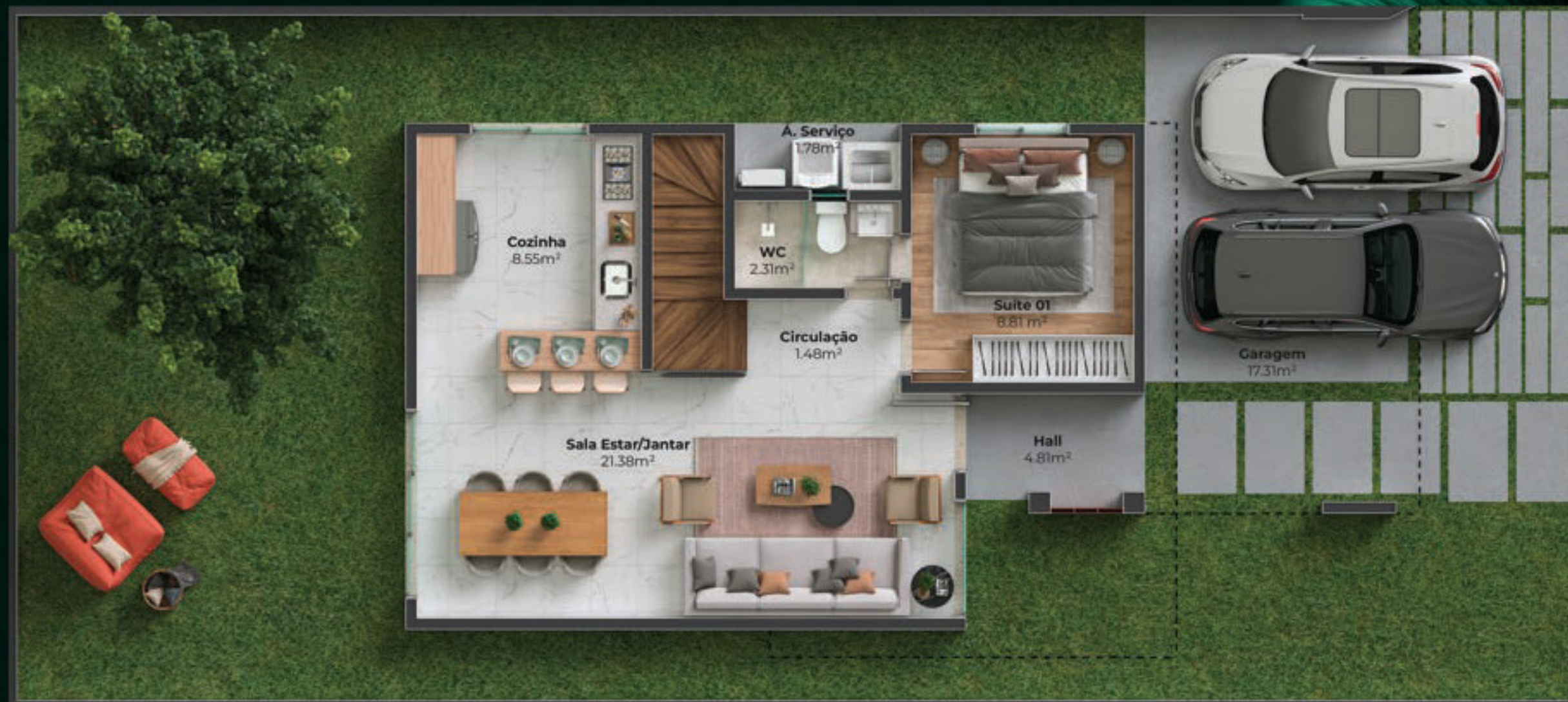
PERSPECTIVA PAVIMENTO TÉRREO