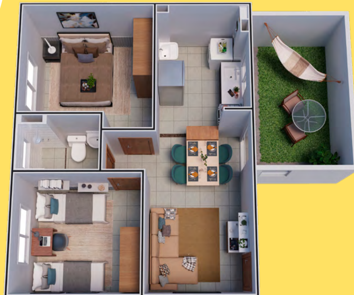
APTO 101 / BLOCO 13

Independente da sua escolha, aqui você escolhe ser feliz.