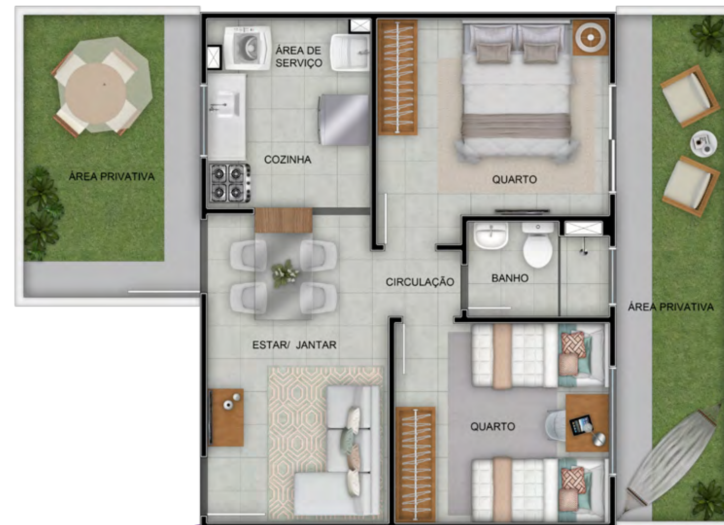
APTO 103 / BLOCO 19

VAGA PCD - Vaga destinada à Pessoas com Deficiência, em cumprimento à Lei de Acessibilidade. Interfone: será instalado sistema de intercomunicação entre guarita e unidades privativas que funcionará através da rede de telefonia móvel disponível no local. (para este caso a responsabilidade de contratação da operadora de telefonia e do aparelho será do cliente) ou sistema tradicional com cabeamento (nesse caso será entregue um aparelho de interfone por apartamento). Independente do sistema utilizado as tubulações seca e sondada serão entregues (sem fiação). Será deixada uma previsão de ponto de interfone para elevador (ou para previsão de elevador) no primeiro andar ou no térreo, no hall de escada sem acesso a guarita. ETE - Estação de Tratamento de Esgoto, Manutenção de responsabilidade do Condomínio. CASTELO D'ÁGUA - Manutenção de responsabilidade do Condomínio. PARQUEAMENTO - As vagas do empreendimento são de área comum e seu uso será por sistema de estacionamento (livre estacionamento), conforme detalhado em Convenção Condominial. O empreendimento possui 66% de vagas em relação ao total de unidades, descontadas as que eventualmente possuam destinação normativa específica. ÁGUA INDIVIDUALIZADA - Preparação para medição de água individualizada. Ligação e cobranças individualizadas conforme regras da concessionária local.