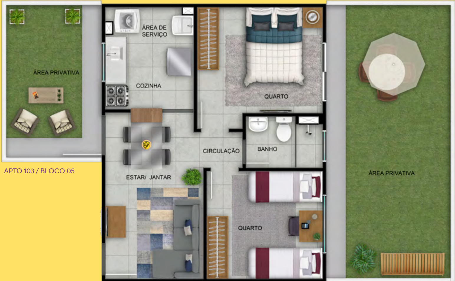
APTO 103 / BLOCO 05