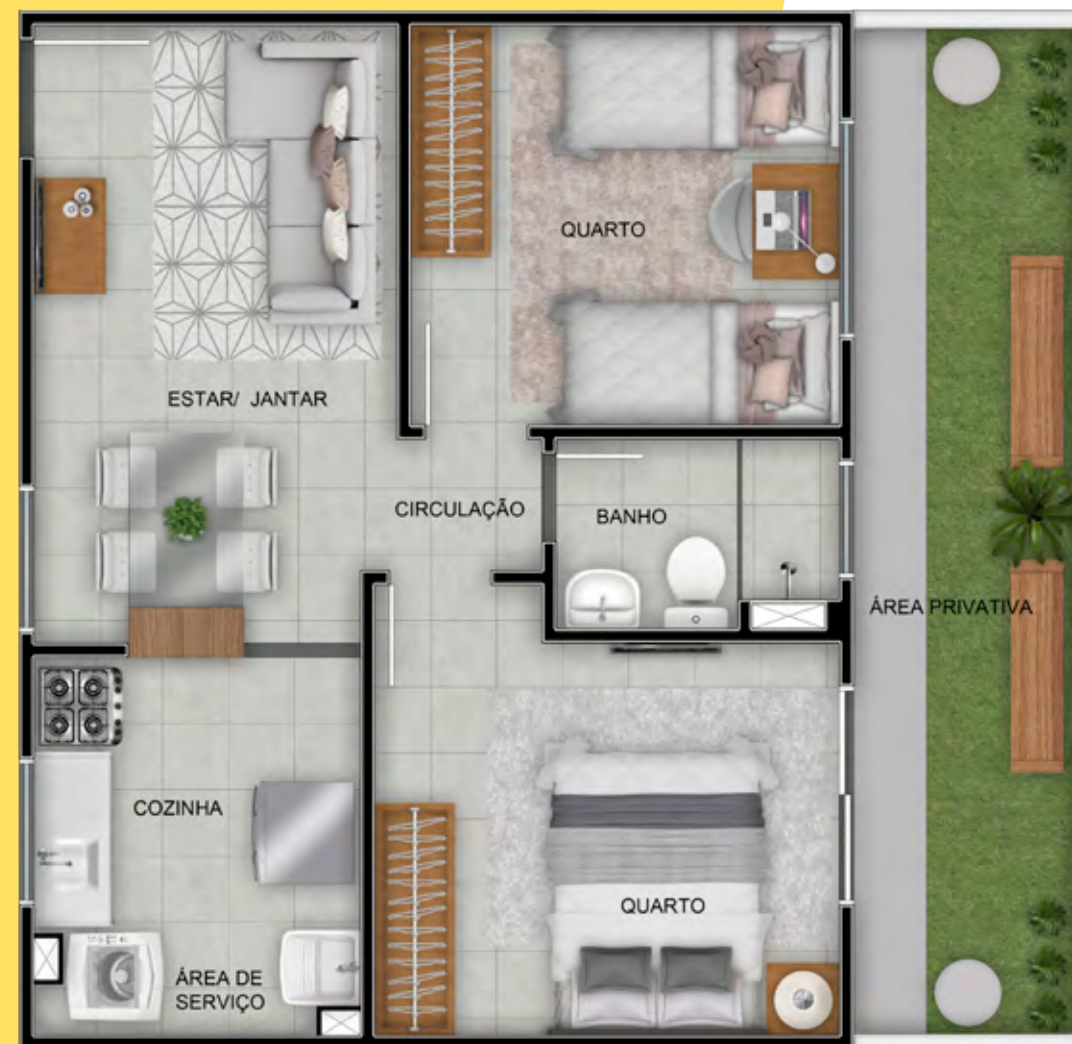
APTO 104 / BLOCO 19