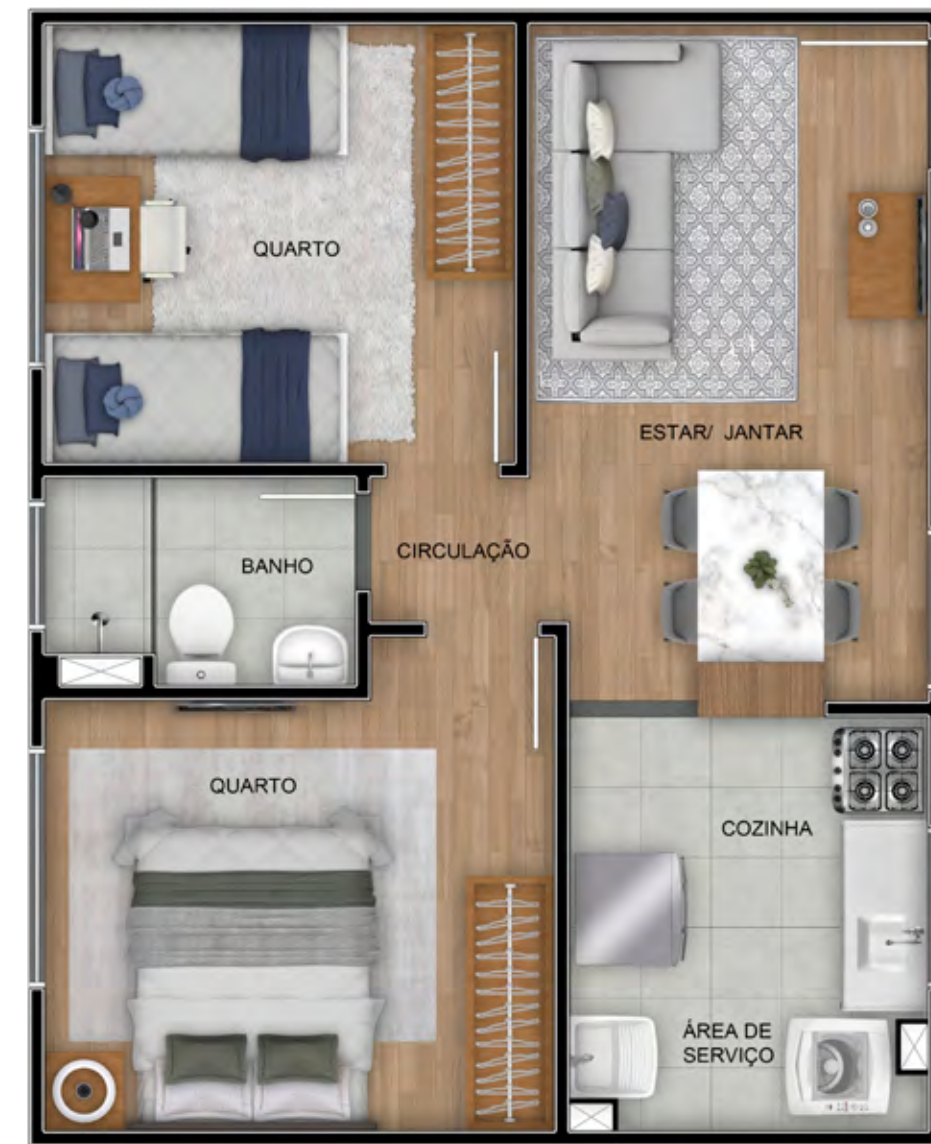
APTO 202 / BLOCO 05