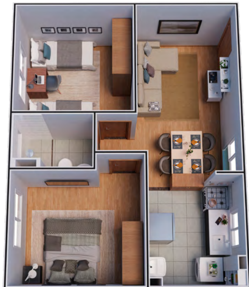
APTO 202 / BLOCO 05