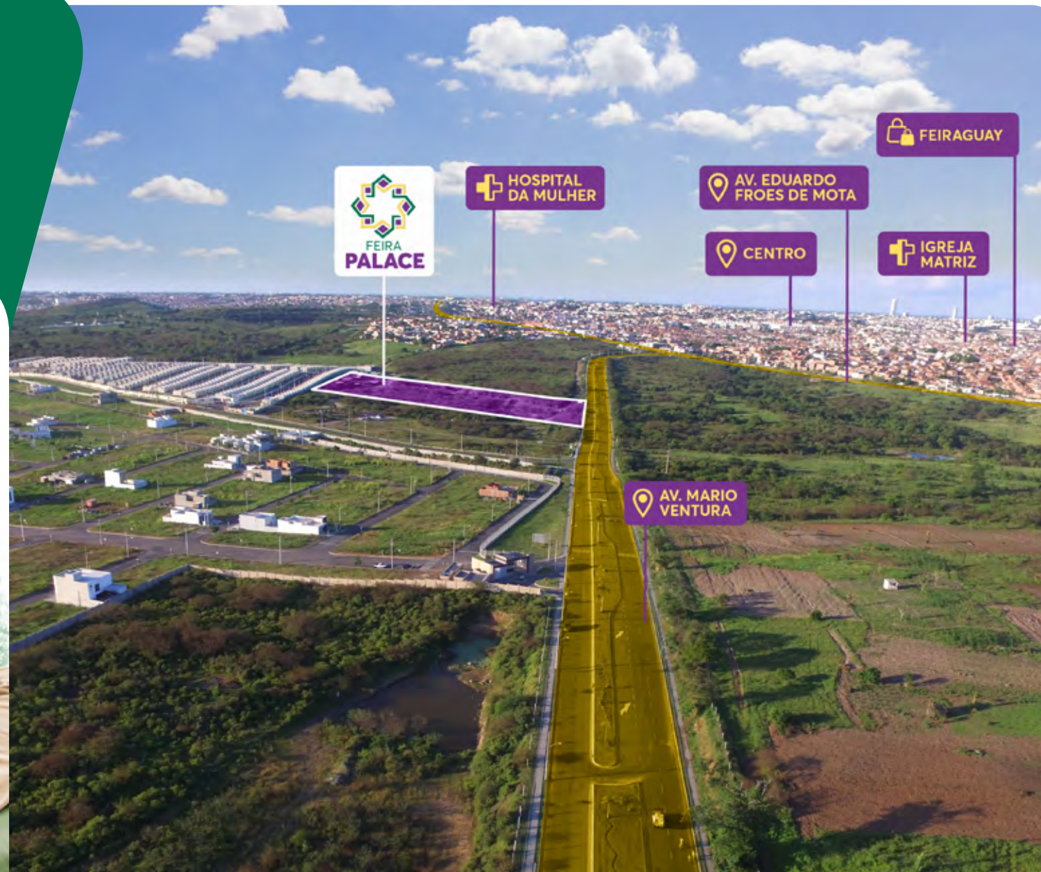
Foto aérea do local