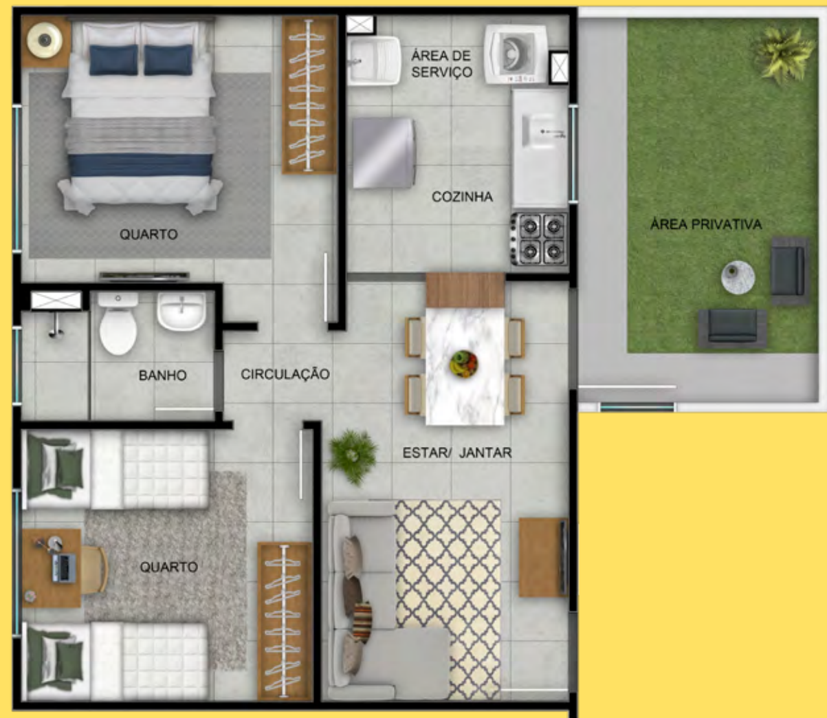
APTO 101 / BLOCO 13

Você conquista seu apê. E seu apê conquista você.