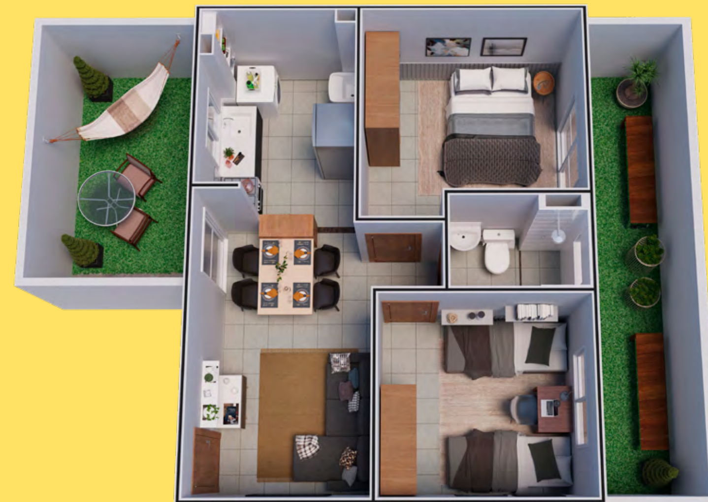
APTO 103 / BLOCO 19

Independente da sua escolha, aqui você escolhe ser feliz.