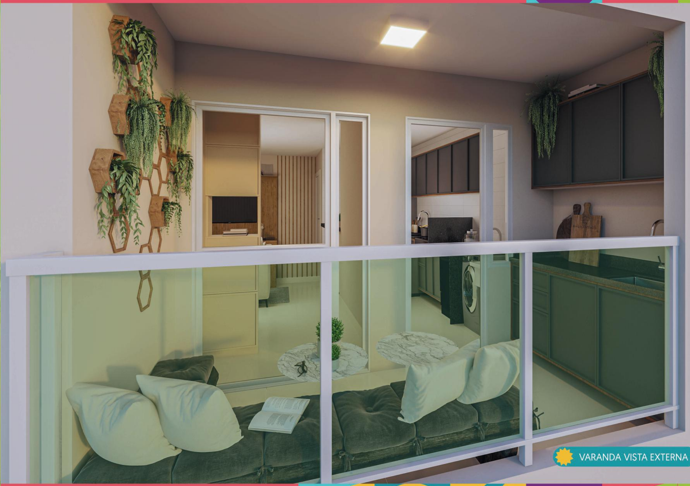
VARANDA VISTA EXTERNA