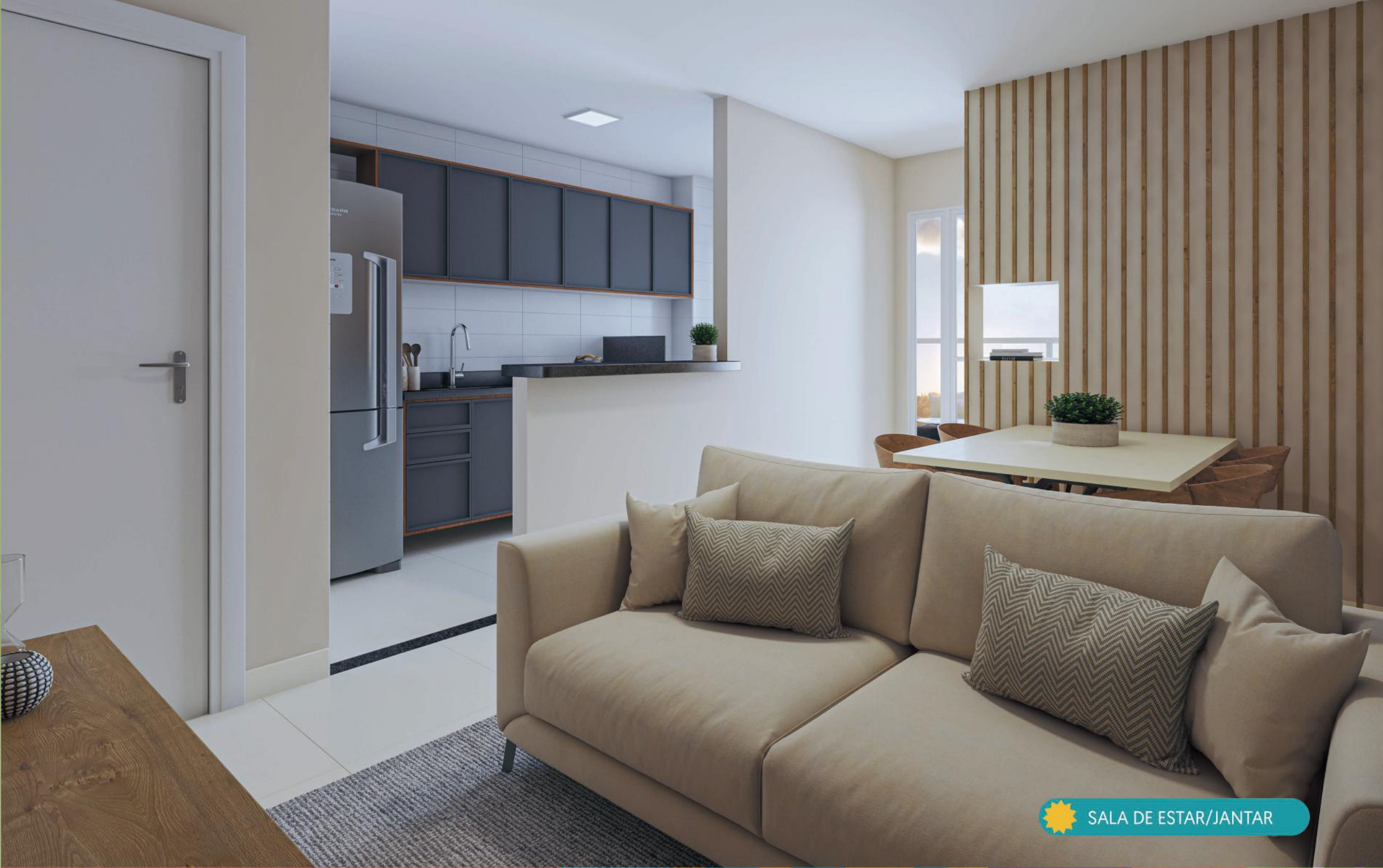
SALA DE ESTAR/JANTAR