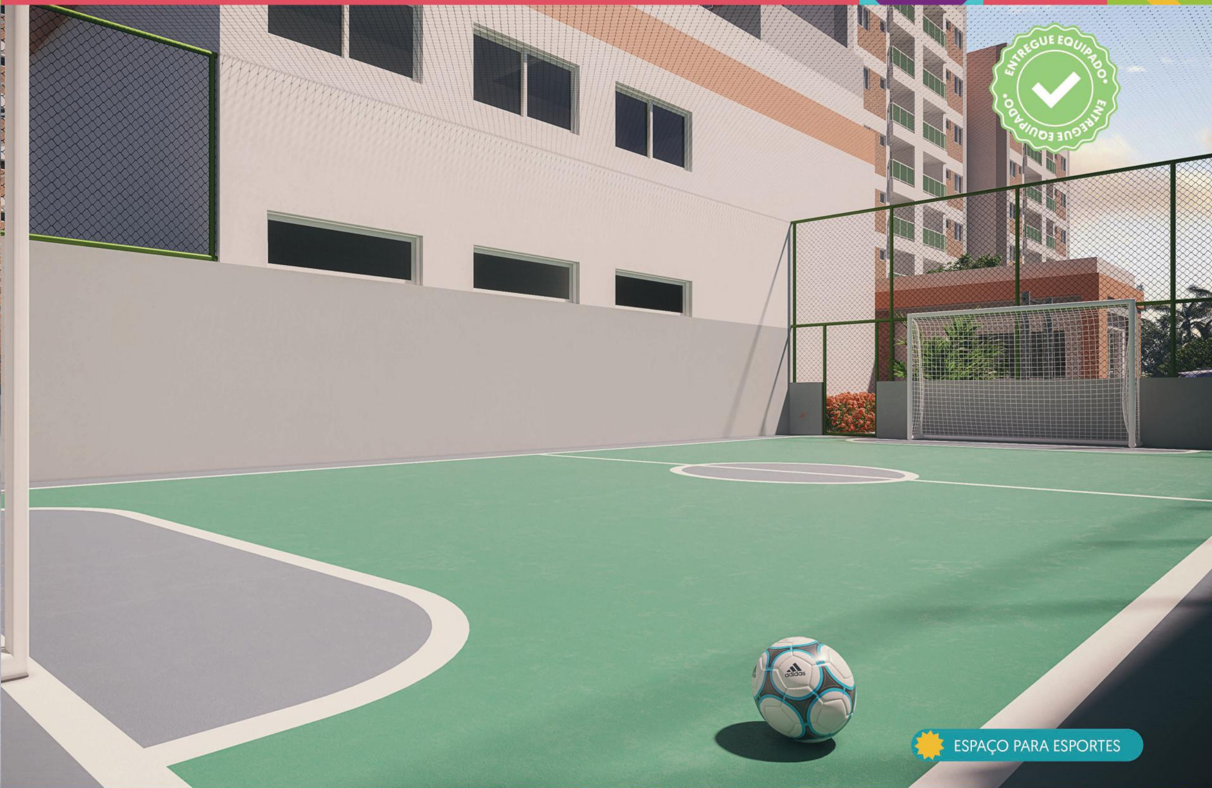
ESPAÇO PARA ESPORTES