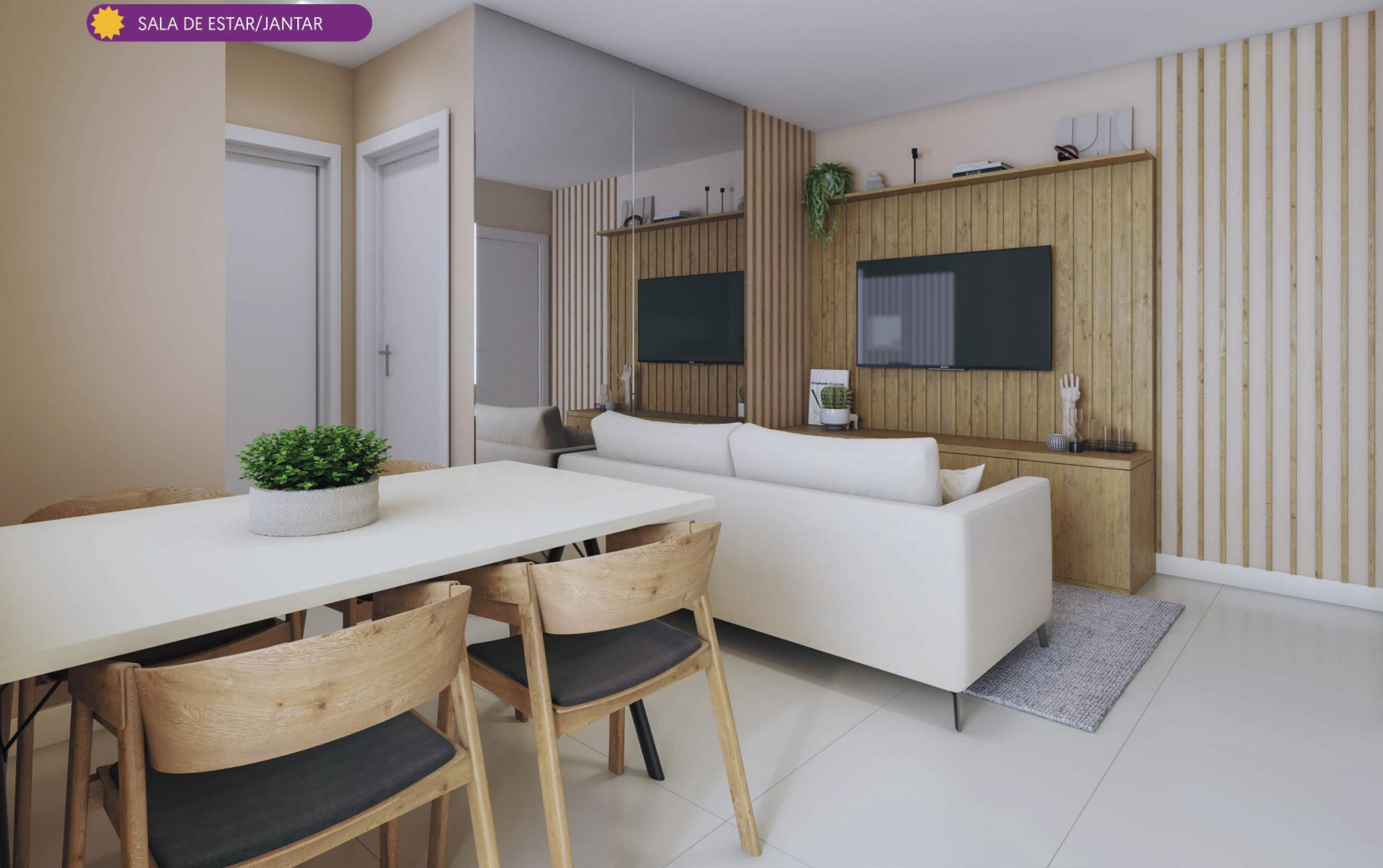
SALA DE ESTAR/JANTAR