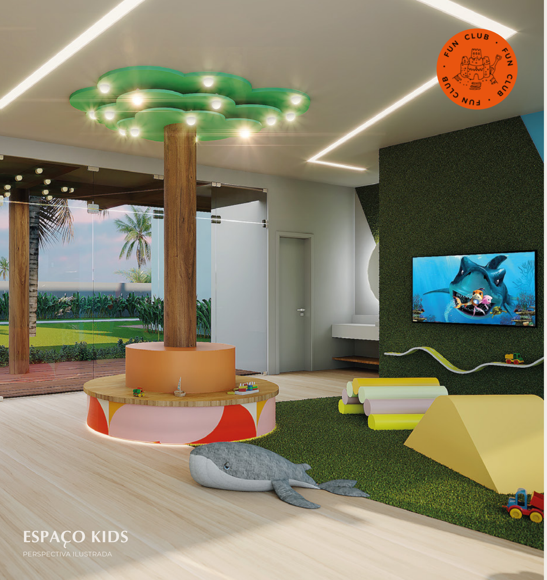
ESPAÇO KIDS PERSPECTIVA ILUSTRADA