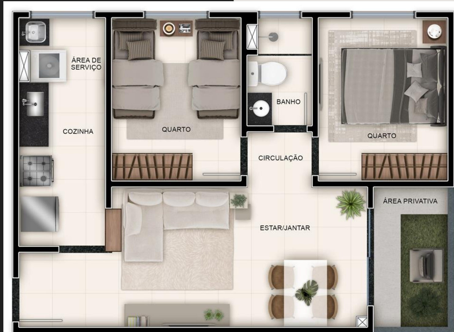
RESERVA DA COLINA - PLANTA APTO 006 - TORRE 01