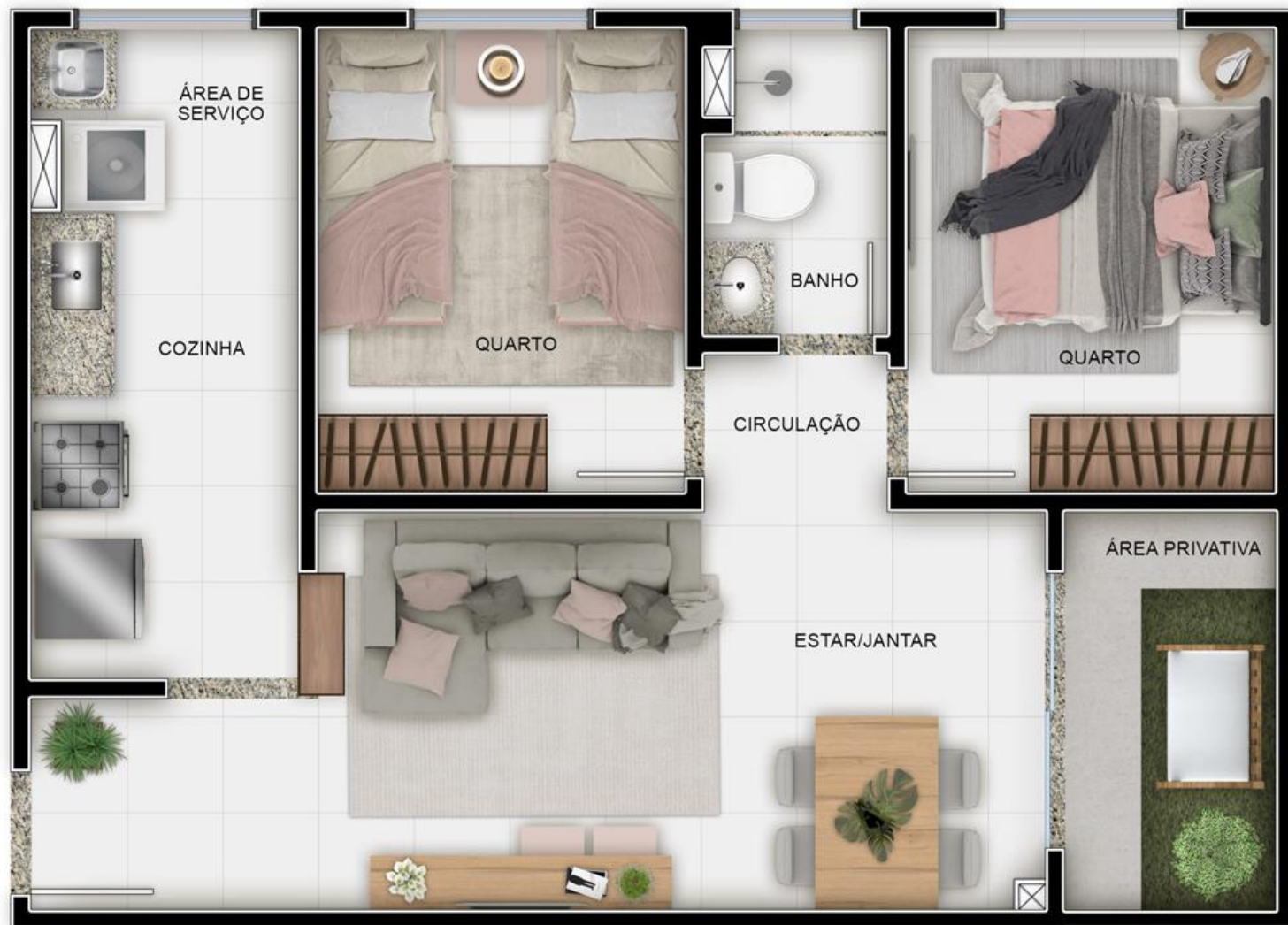
RESERVA DA COLINA - PLANTA APTO 006 - TORRE 02