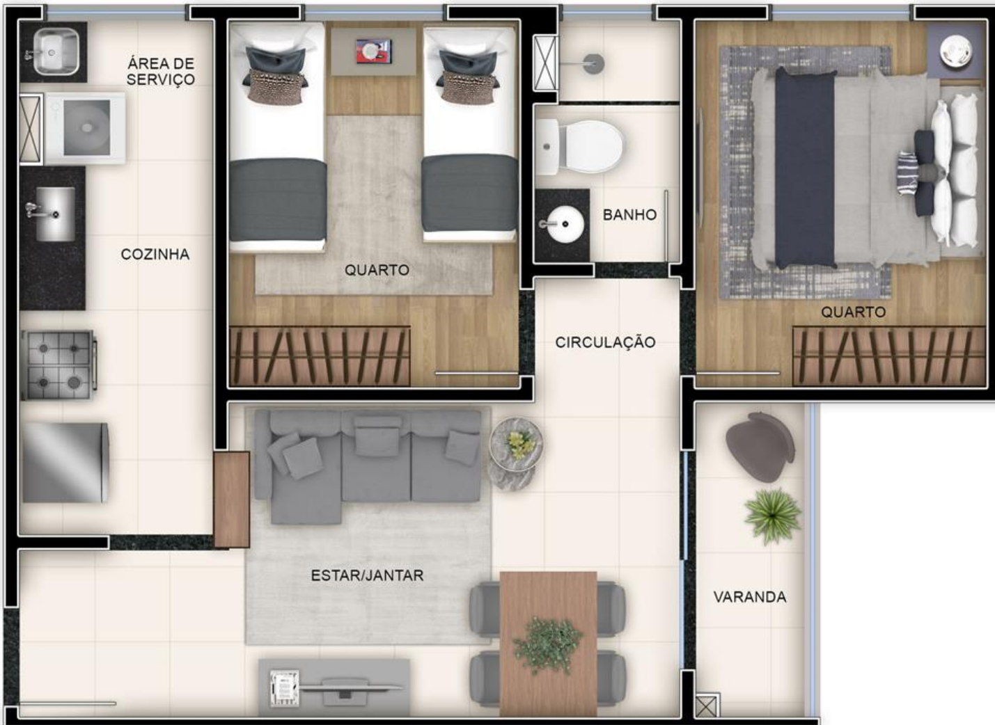
RESERVA DA COLINA - PLANTA APTO 806 - TORRE 01