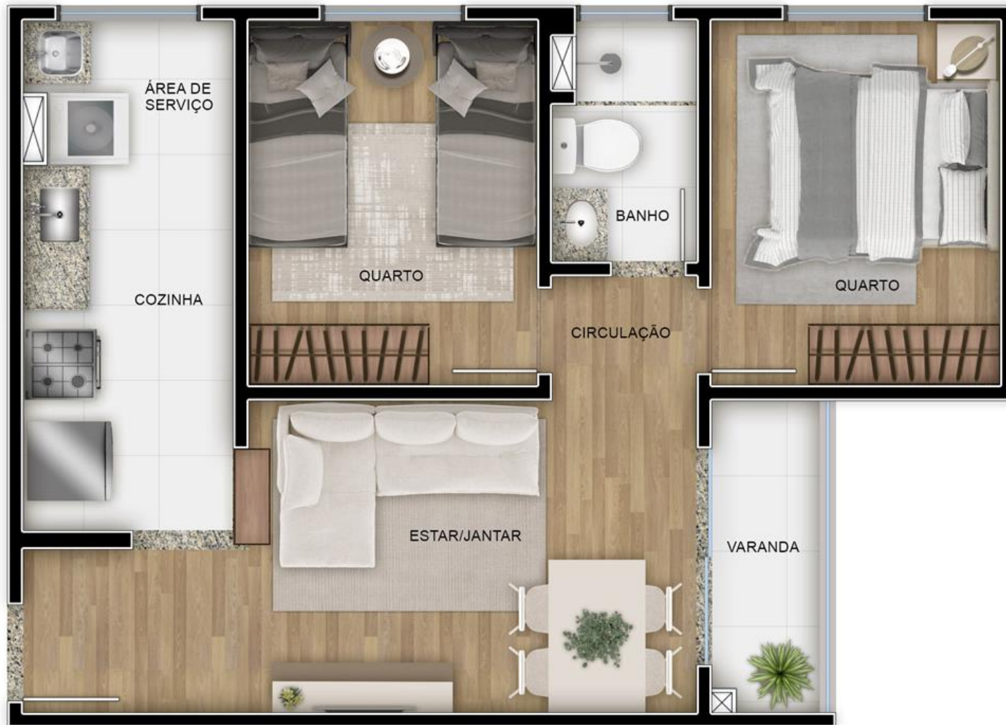
RESERVA DA COLINA - PLANTA APTO 806 - TORRE 02