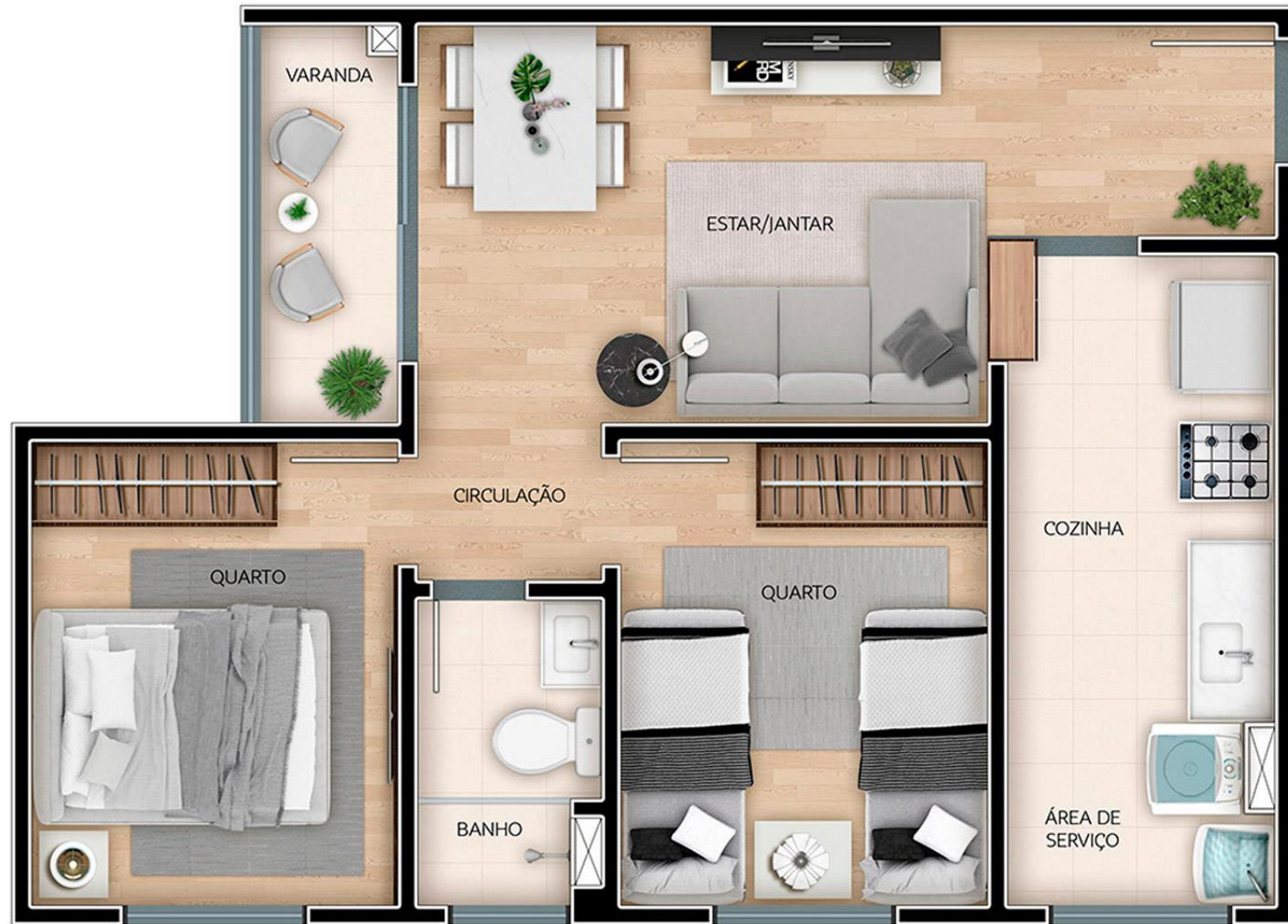
SOLAR VISTA MAR - PLANTA APTO 502 - TORRE 04