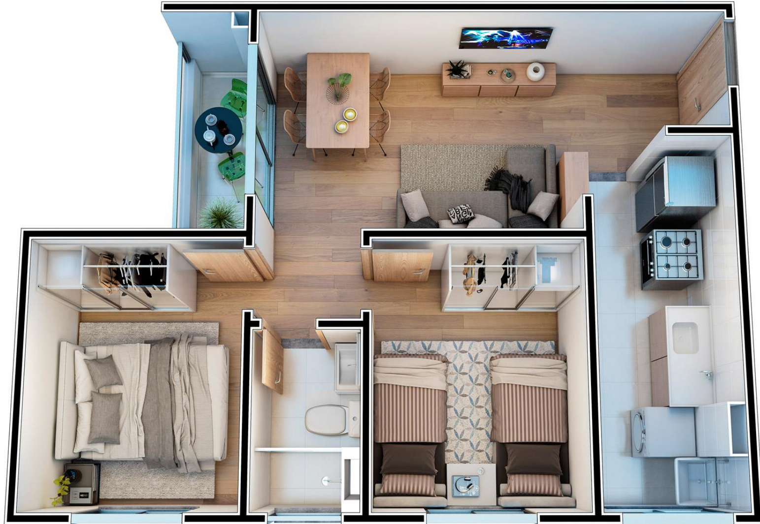
SOLAR VISTA MAR - ISOMÉTRICA - TORRE 04 - APTO 502