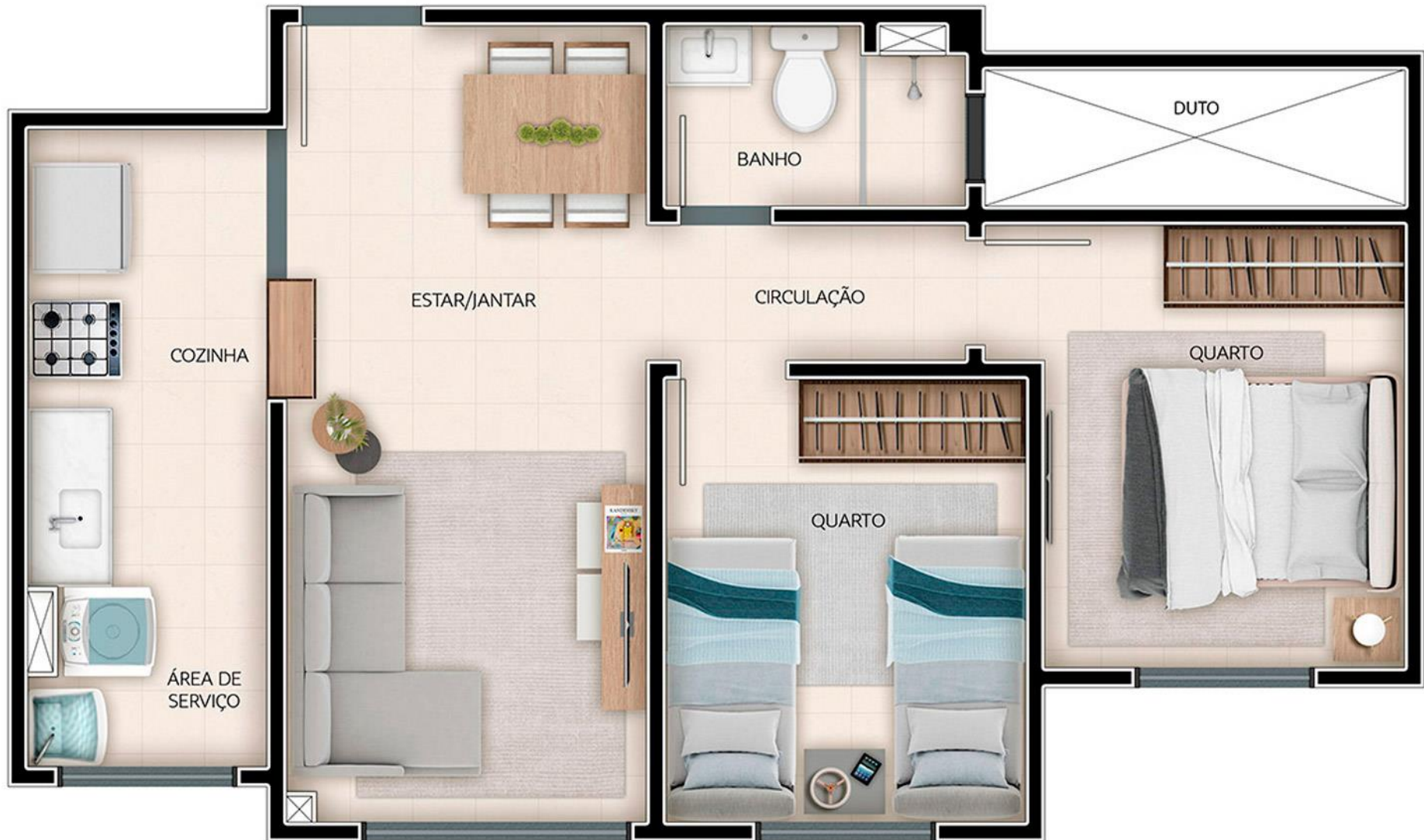
SOLAR VISTA MAR - PLANTA APTO 001 - TORRE 04