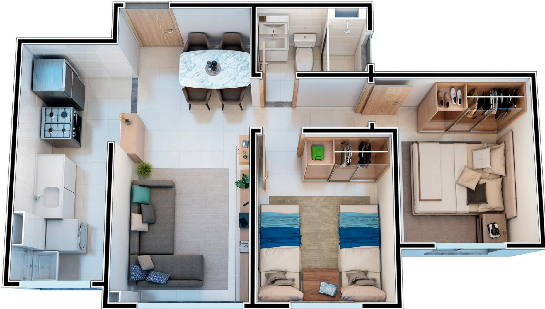
SOLAR VISTA MAR - ISOMÉTRICA - TORRE 04 - APTO 001