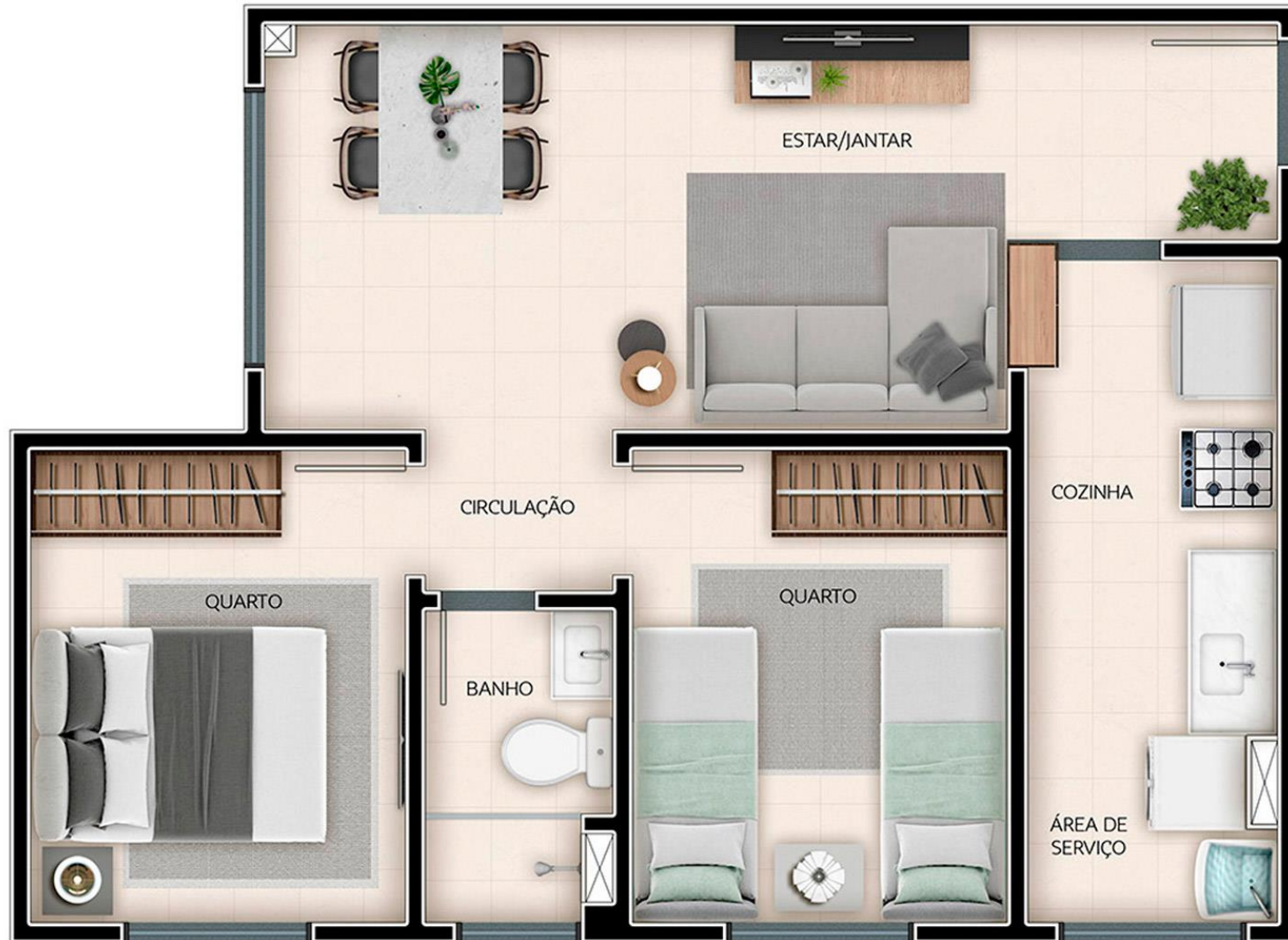
SOLAR VISTA MAR - PLANTA APTO 002 - TORRE 04