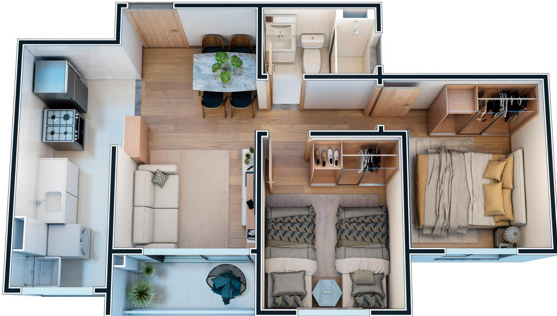
SOLAR VISTA MAR - ISOMÉTRICA - TORRE 04 - APTO 501