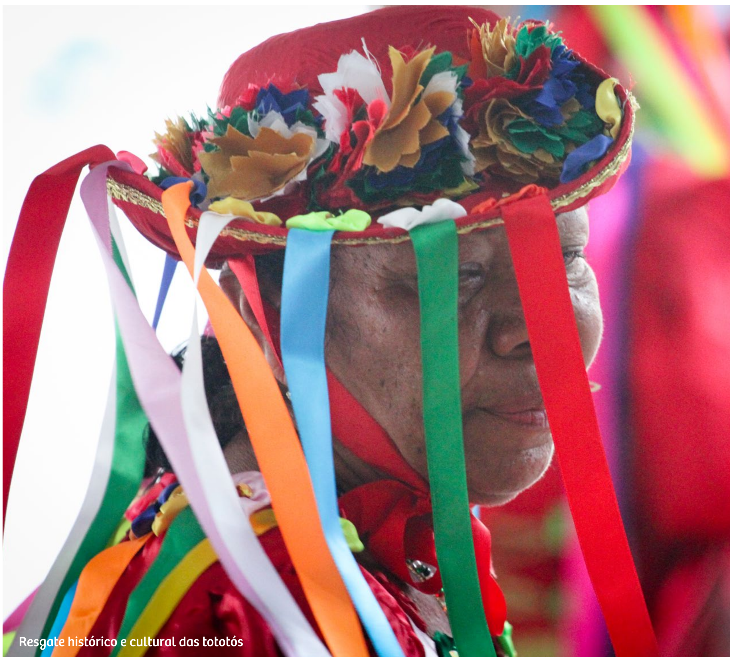
Resgate histórico e cultural das tototós