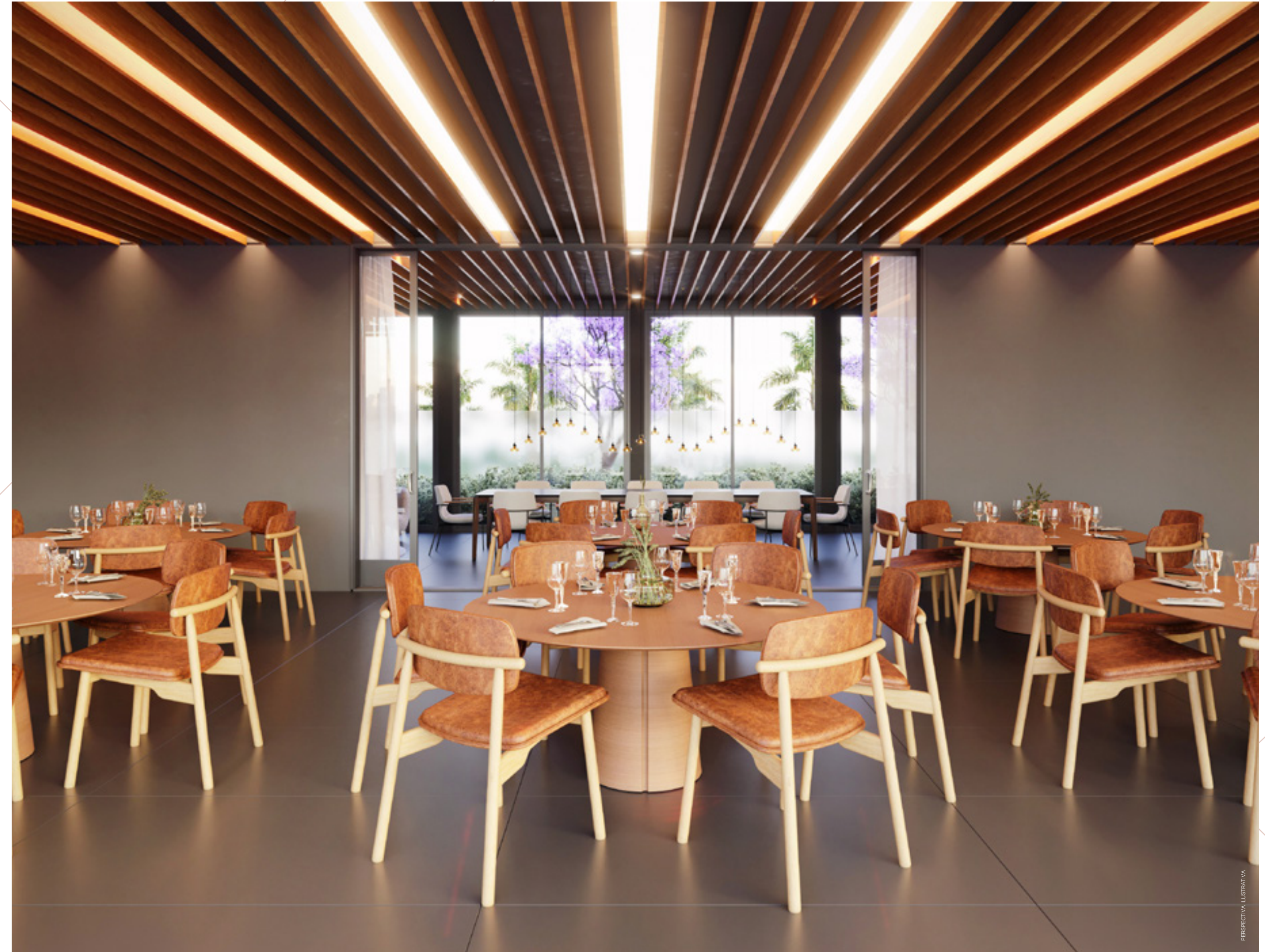
MODERNO E ACONCHEGANTE