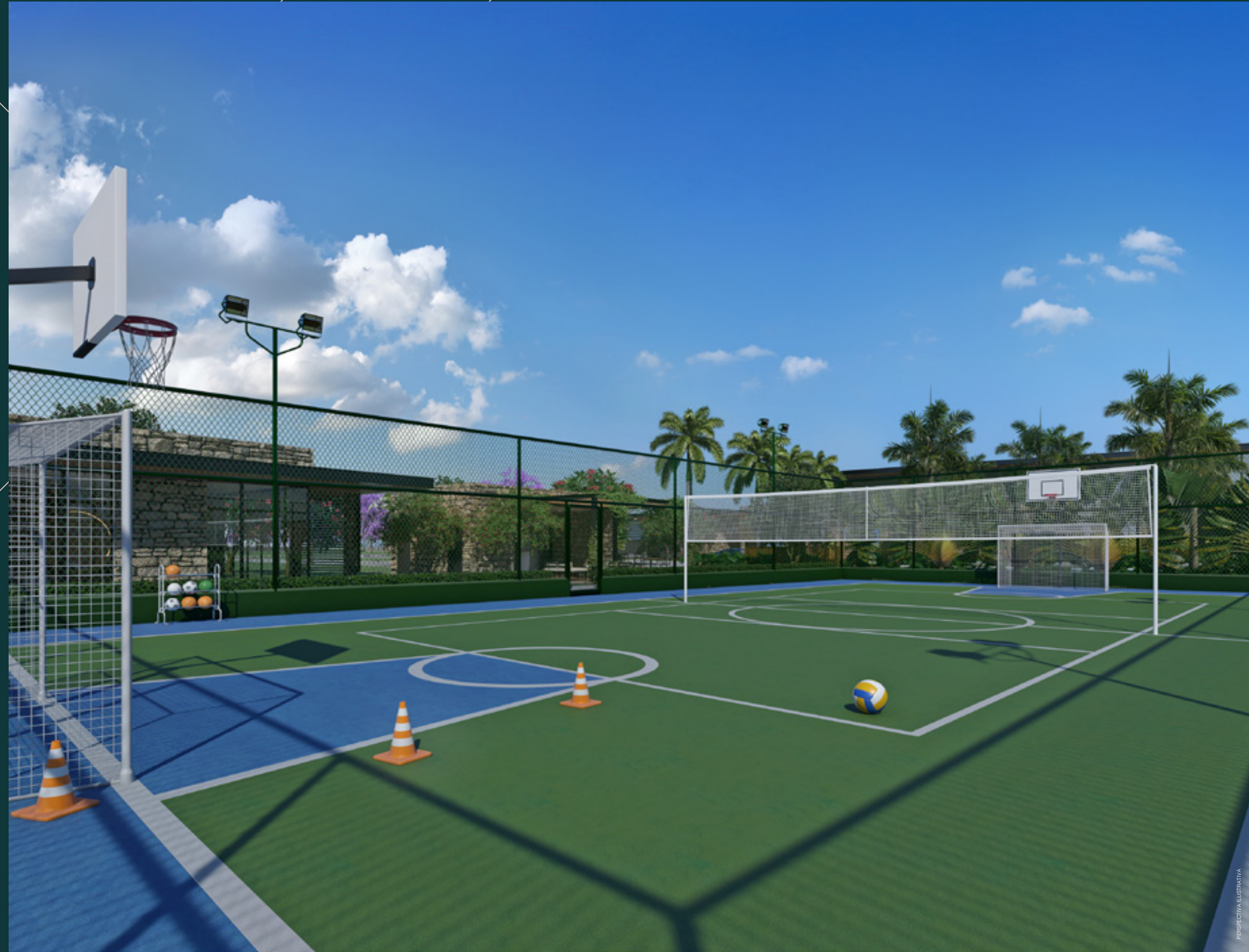
ÁREA DE JOGOS