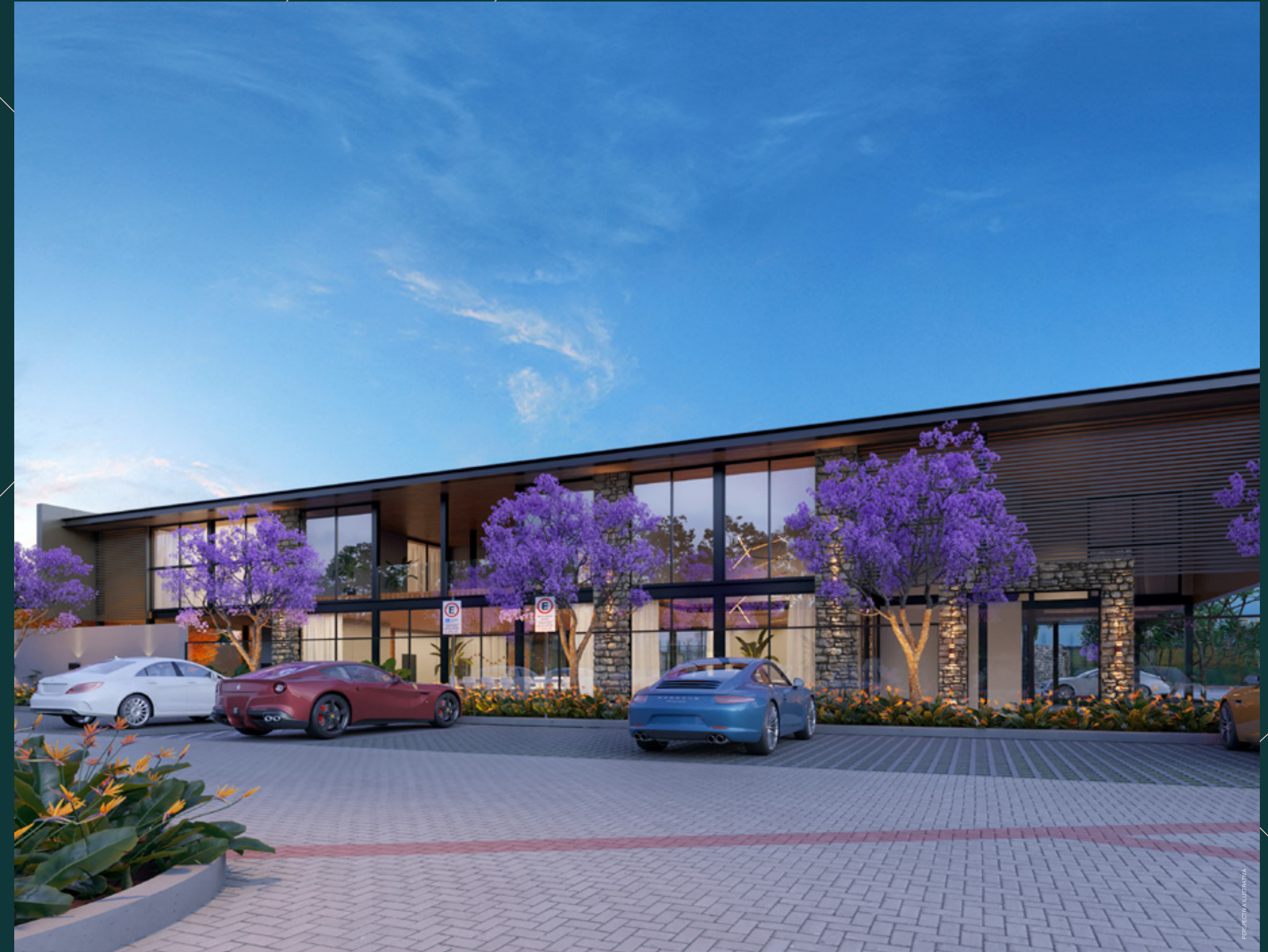
ACESSO INDEPENDENTE PARA O SALÃO DE FESTAS