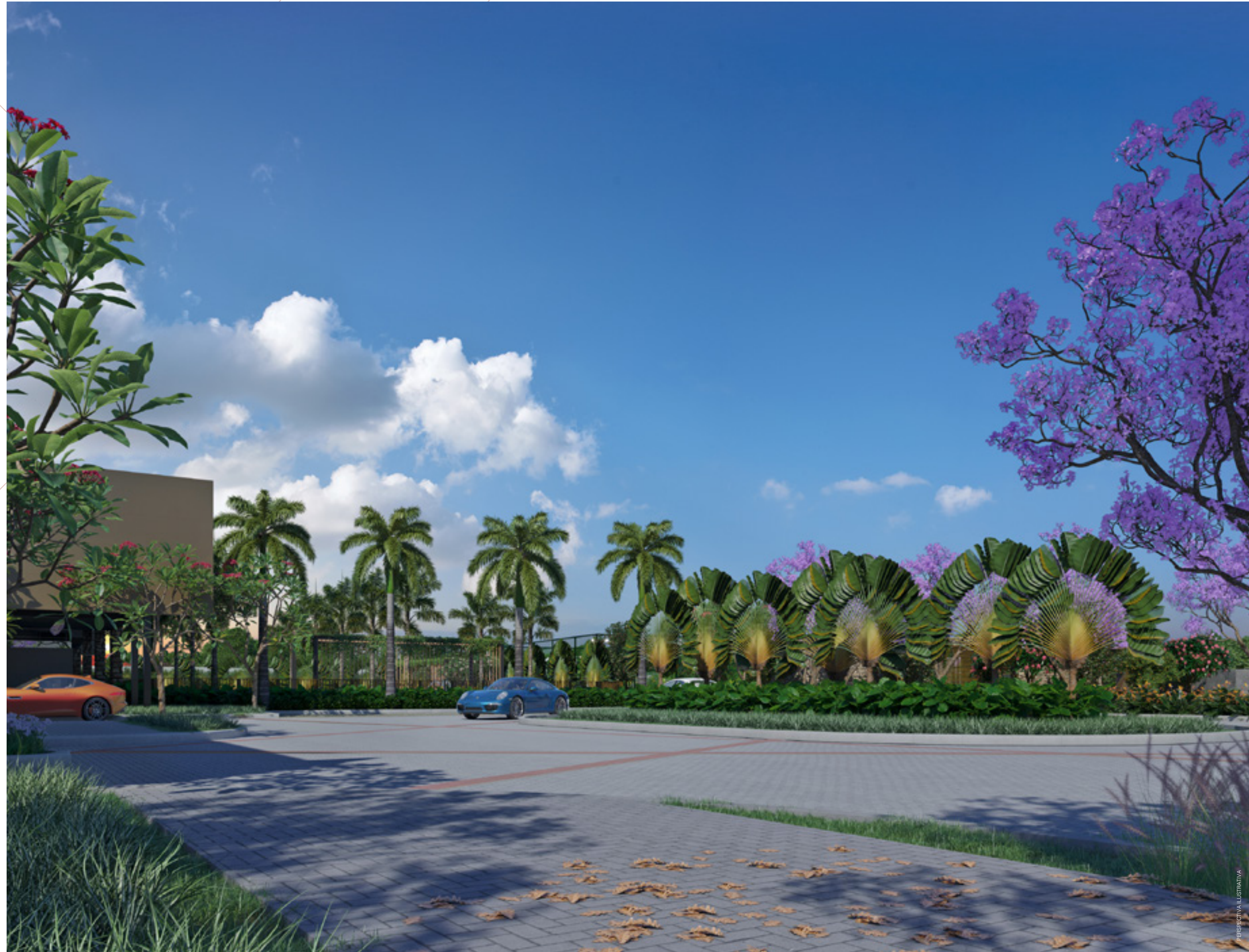
ALAMEDA DE ACESSO