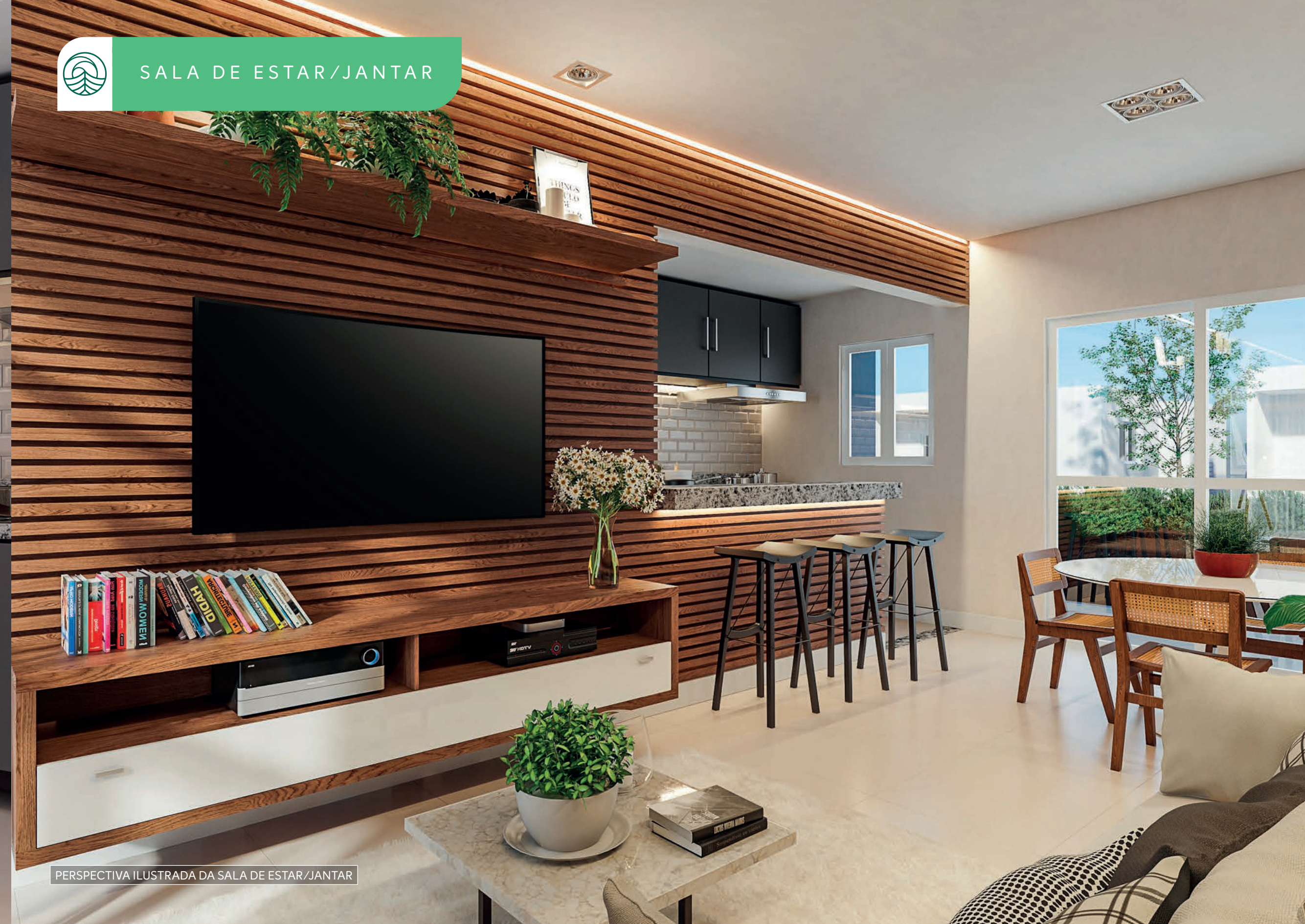
PERSPECTIVA ILUSTRADA DA SALA DE ESTAR/JANTAR