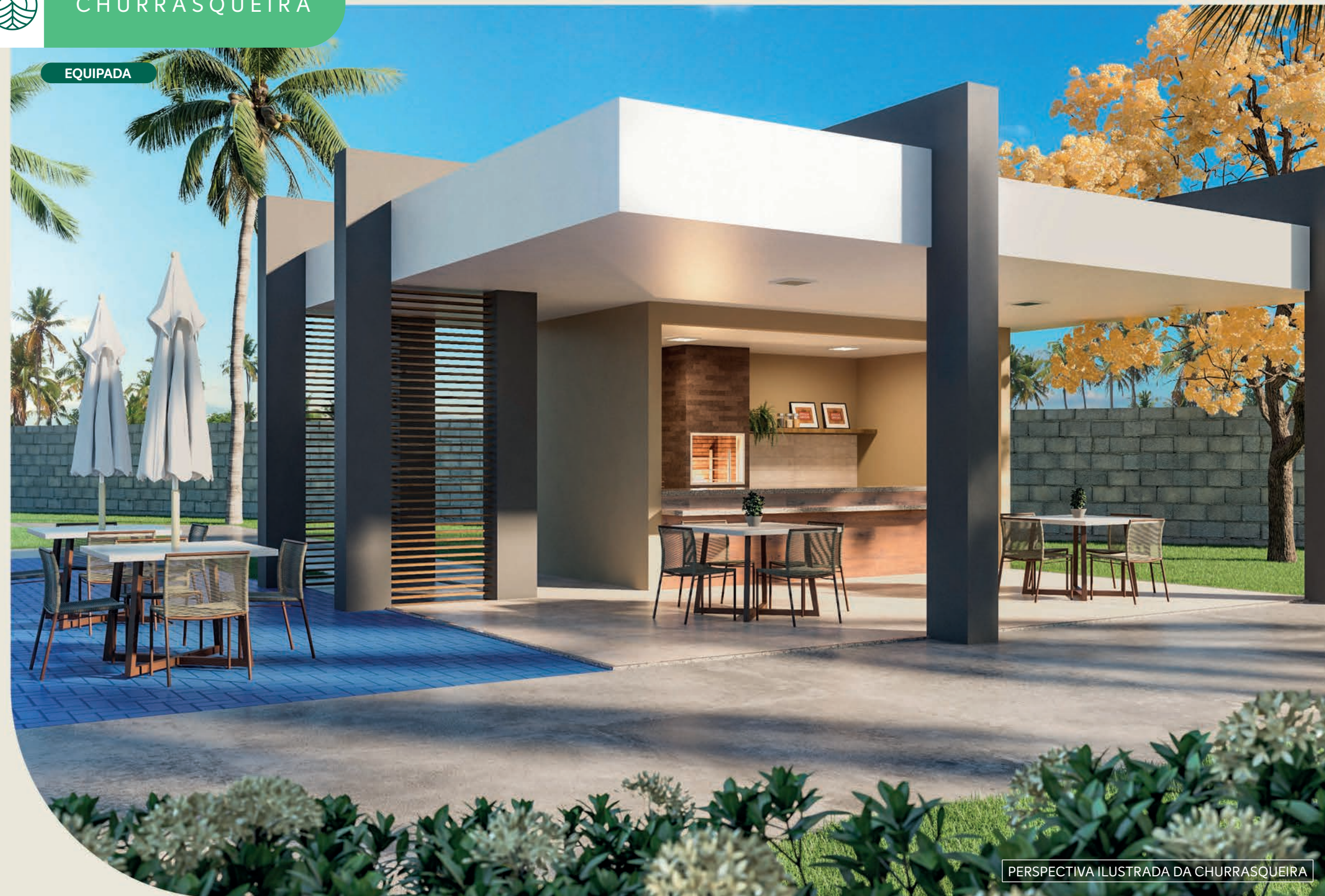
PERSPECTIVA ILUSTRADA DA CHURRASQUEIRA