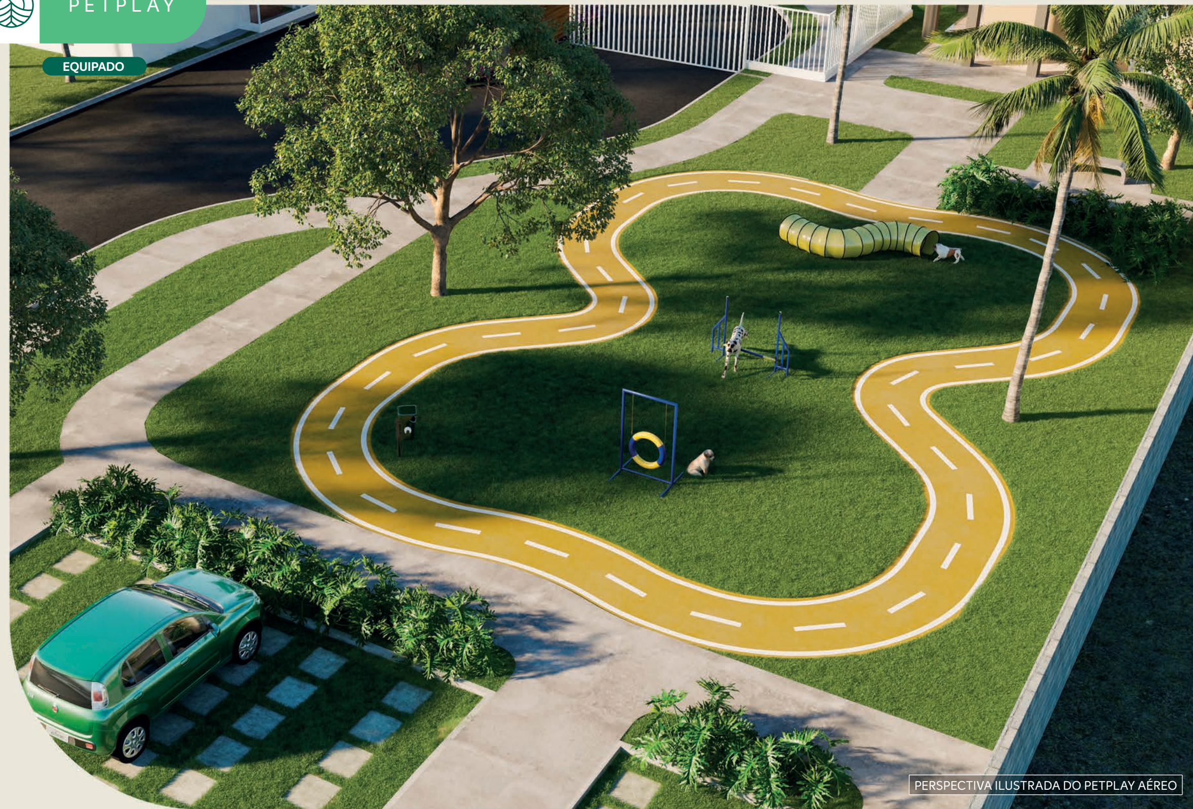
PERSPECTIVA ILUSTRADA DO PETPLAY AÉREO