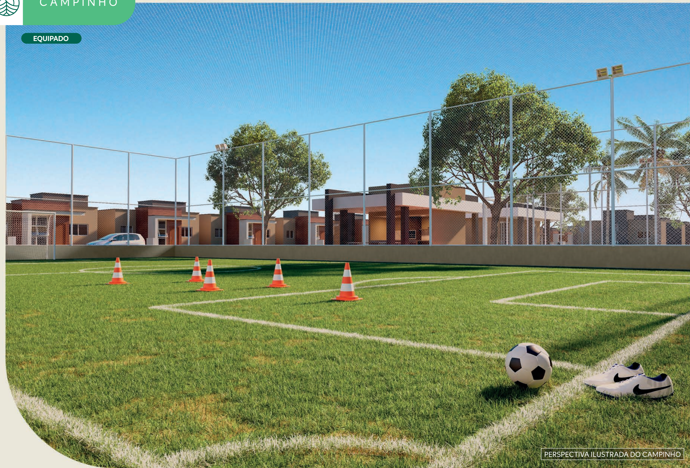
PERSPECTIVA ILUSTRADA DO CAMPINHO