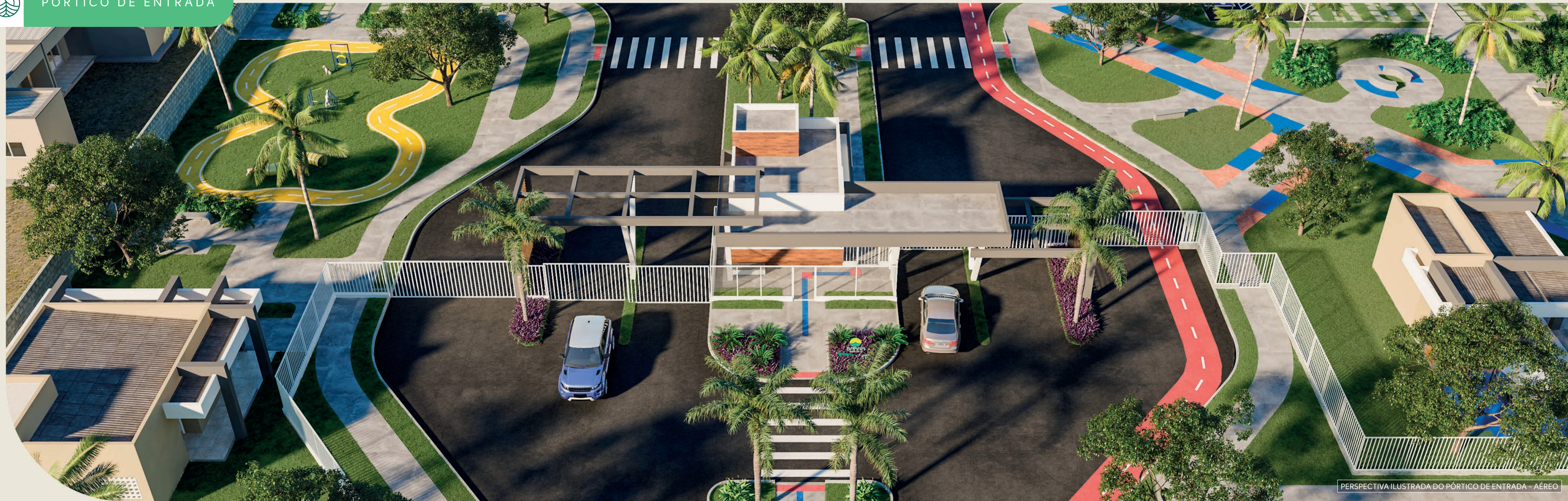
PERSPECTIVA ILUSTRADA DO PÓRTICO DE ENTRADA - AÉREO