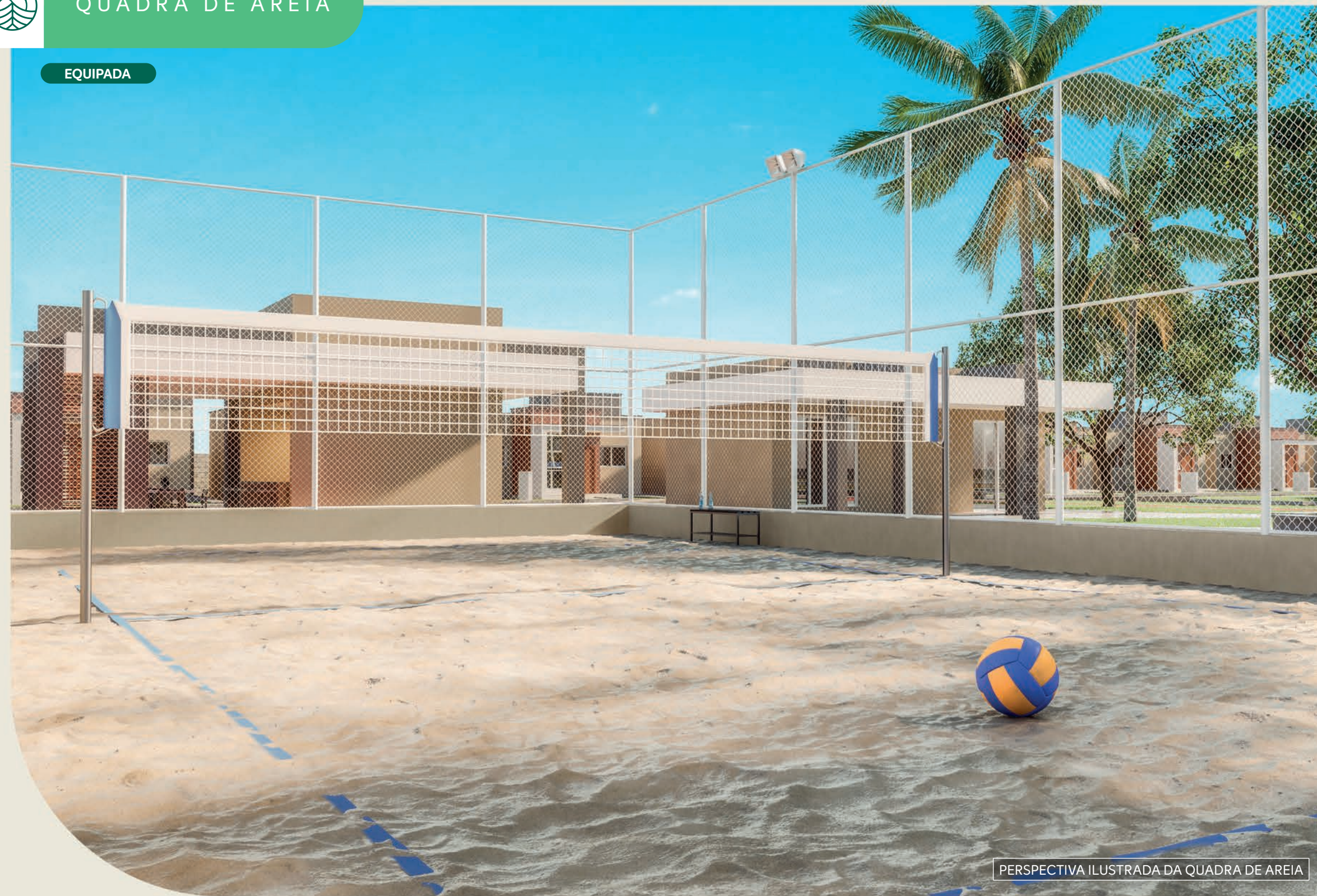
PERSPECTIVA ILUSTRADA DA QUADRA DE AREIA