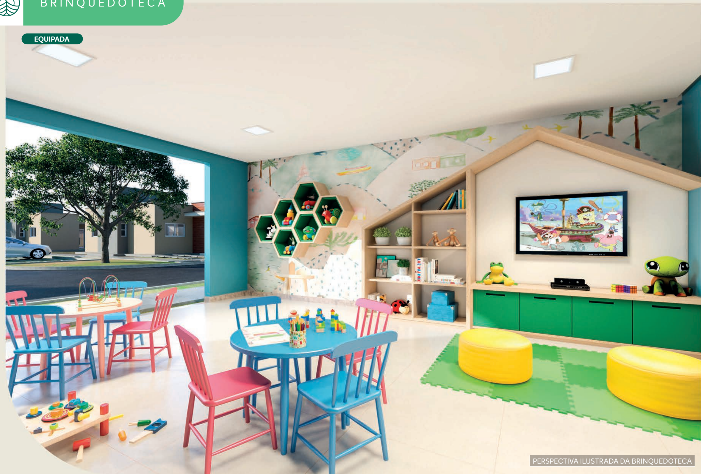
PERSPECTIVA ILUSTRADA DA BRINQUEDOTECA