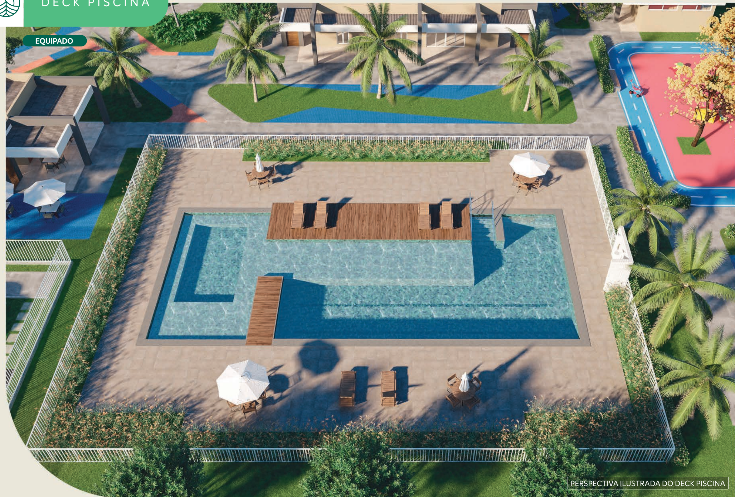
PERSPECTIVA ILUSTRADA DO DECK PISCINA