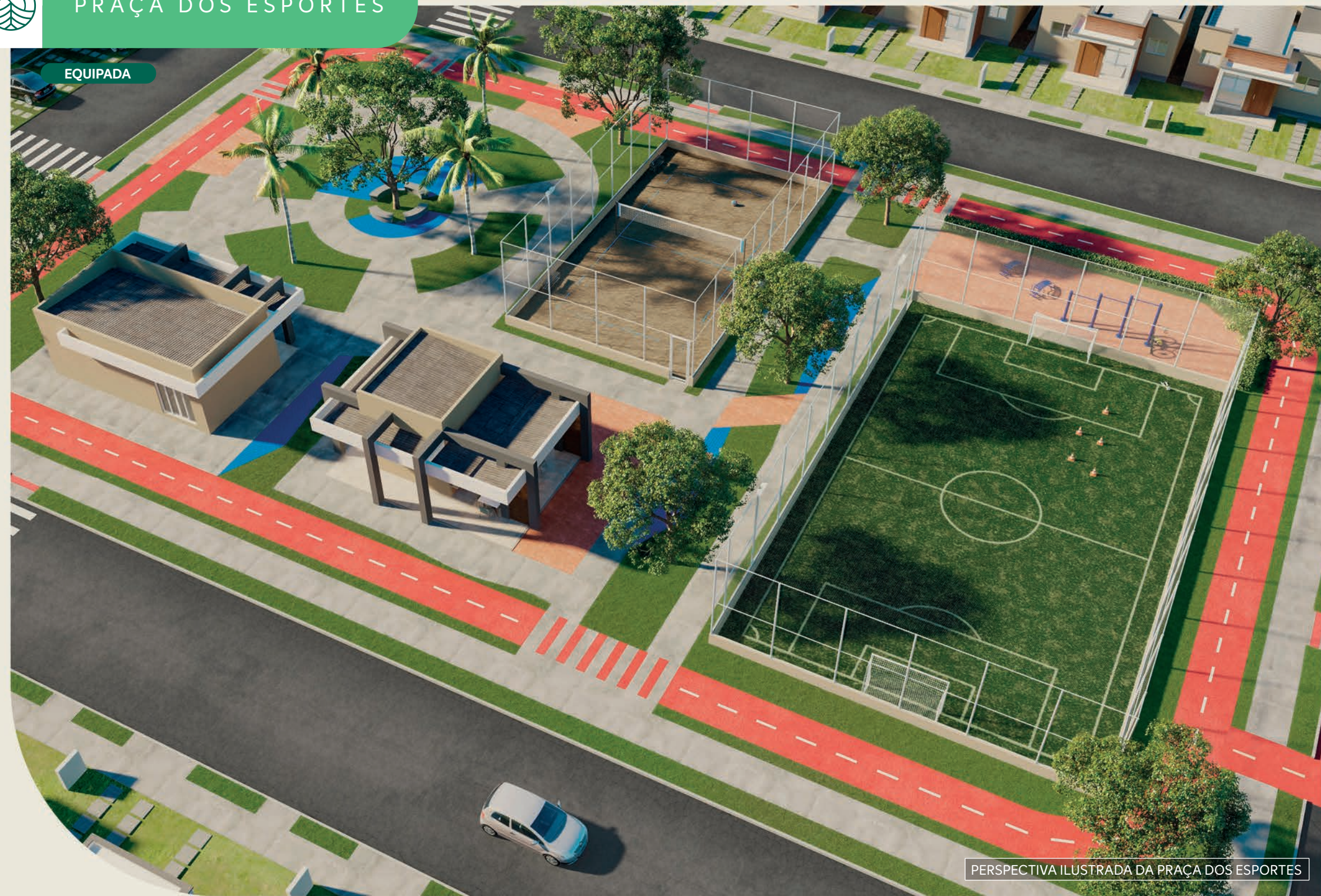
PERSPECTIVA ILUSTRADA DA PRAÇA DOS ESPORTES