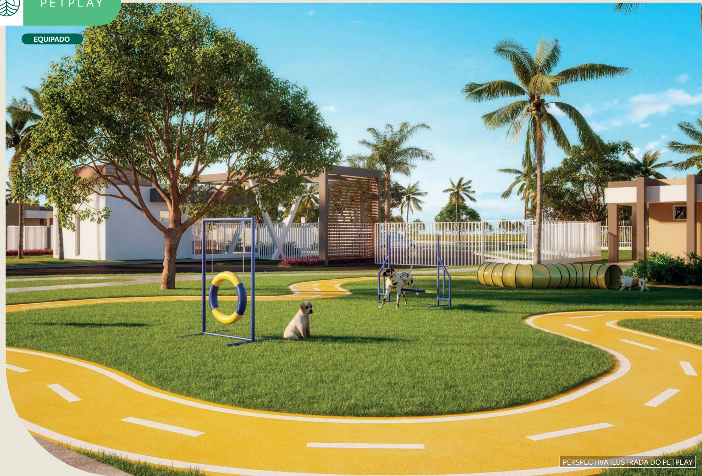
PERSPECTIVA ILUSTRADA DO PETPLAY