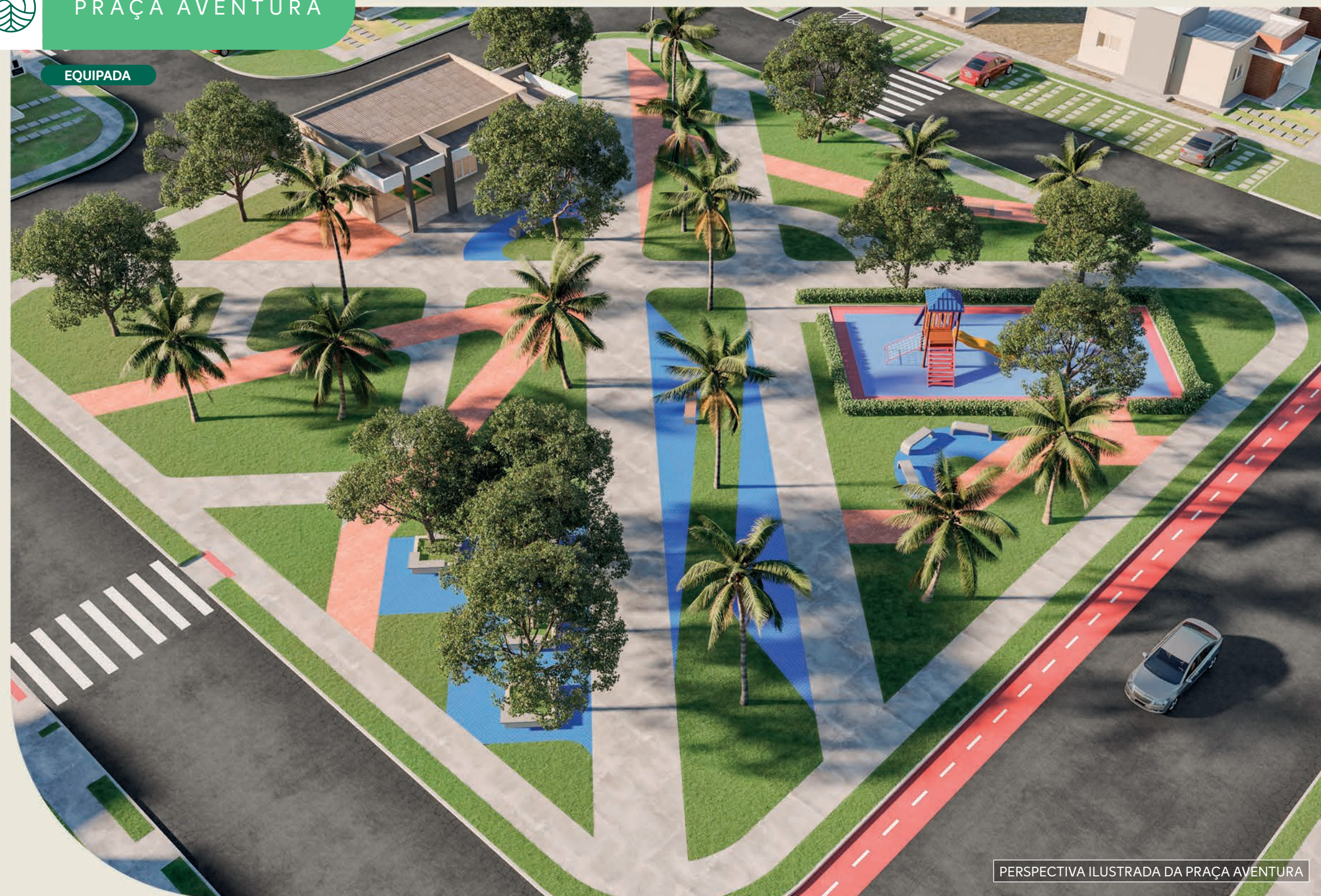
PERSPECTIVA ILUSTRADA DA PRAÇA AVENTURA