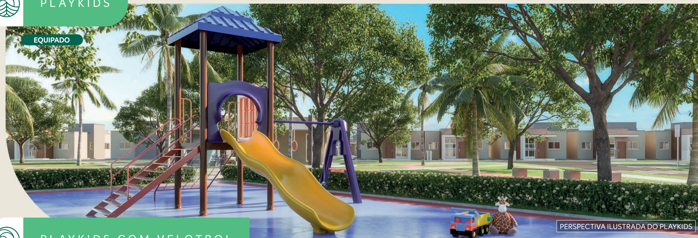
PERSPECTIVA ILUSTRADA DO PLAYKIDS