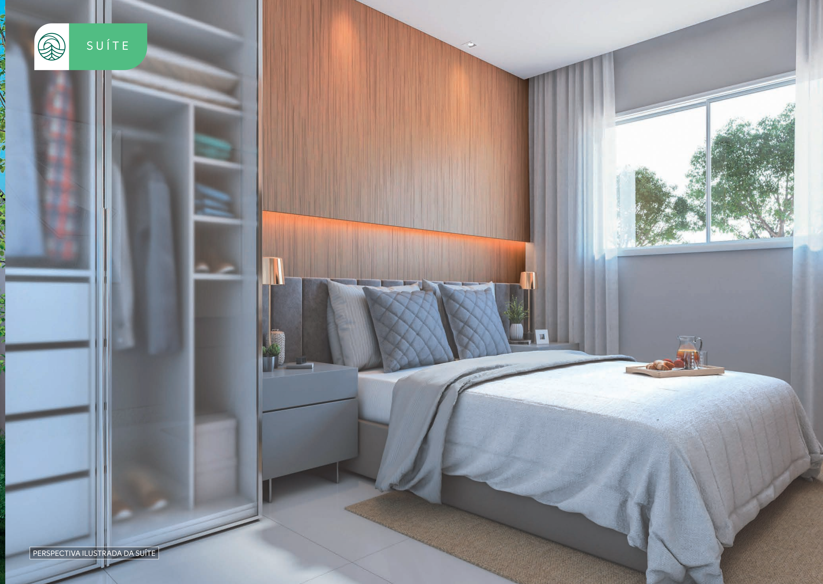
PERSPECTIVA ILUSTRADA DA SUÍTE