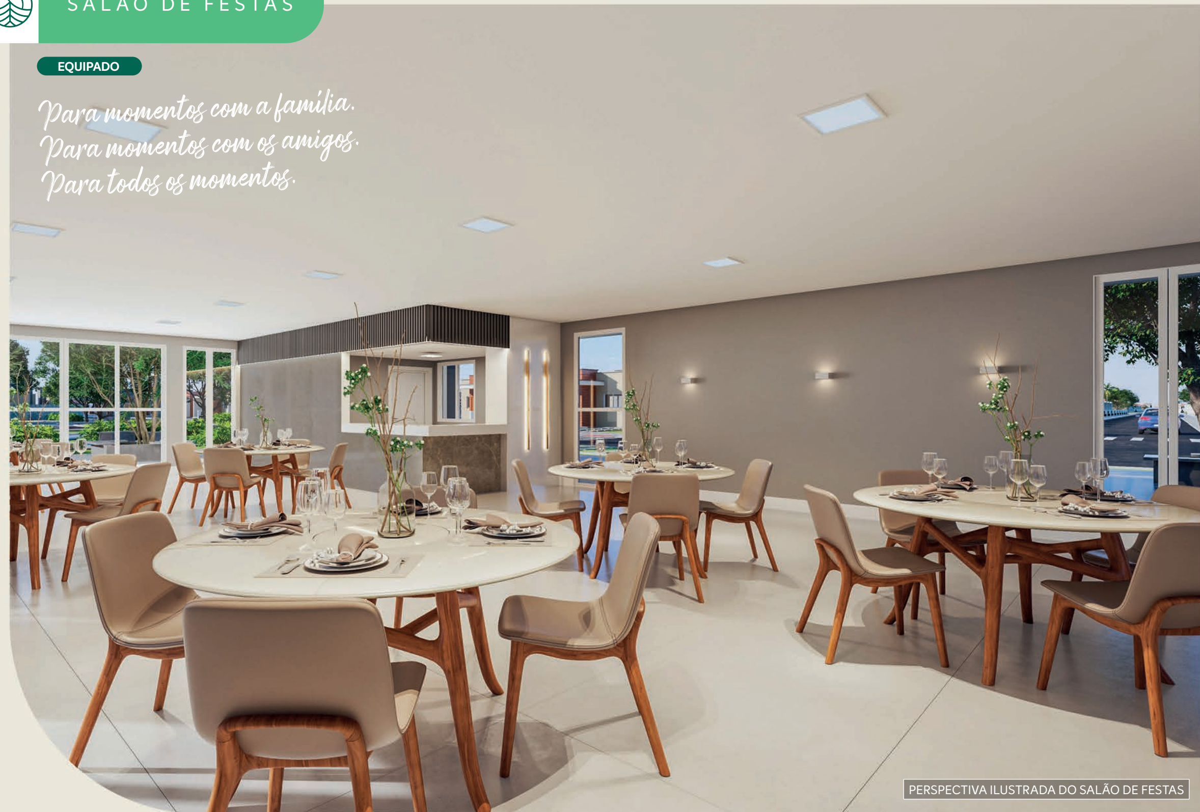
PERSPECTIVA ILUSTRADA DO SALÃO DE FESTAS

Para momentos com a família. Para momentos com os amigos. Para todos os momentos.