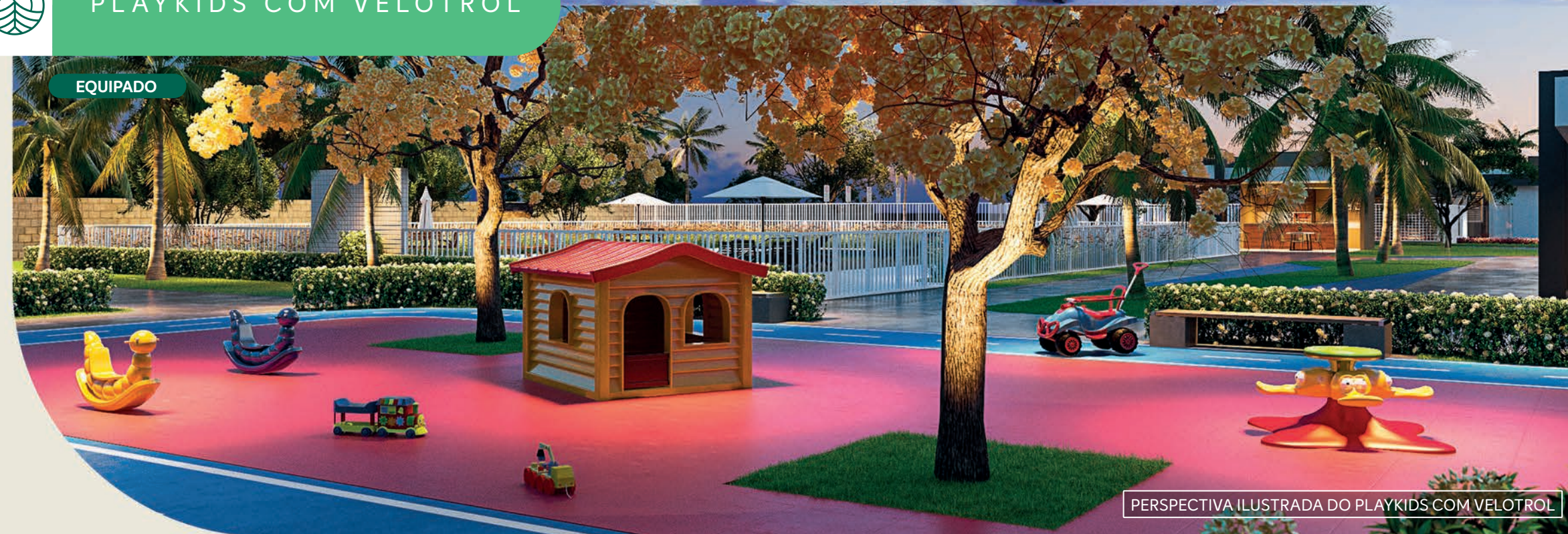
PERSPECTIVA ILUSTRADA DO PLAYKIDS COM VELOTROL