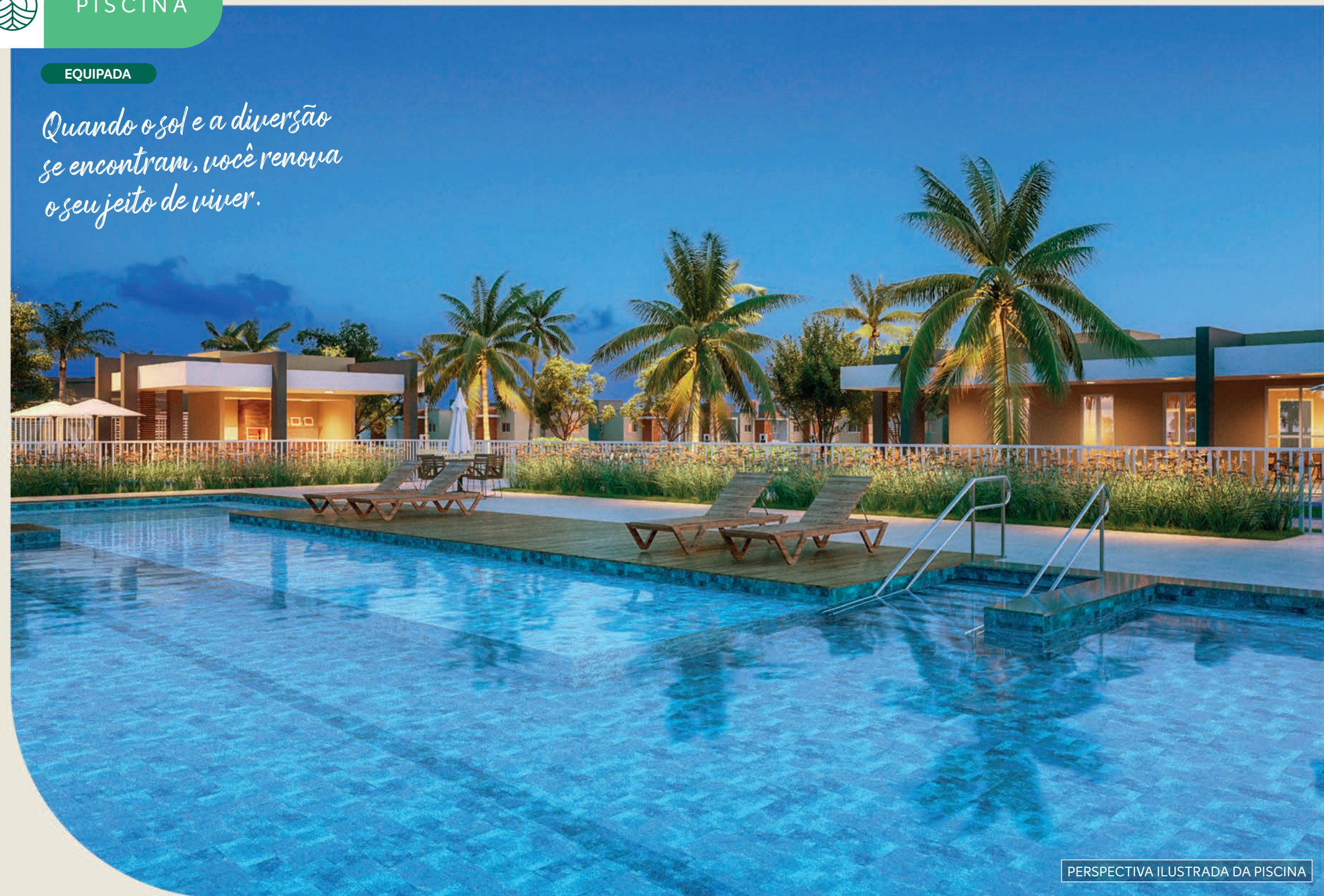
PERSPECTIVA ILUSTRADA DA PISCINA

Quando o sol e a diversão se encontram, você renova o seu jeito de viver.