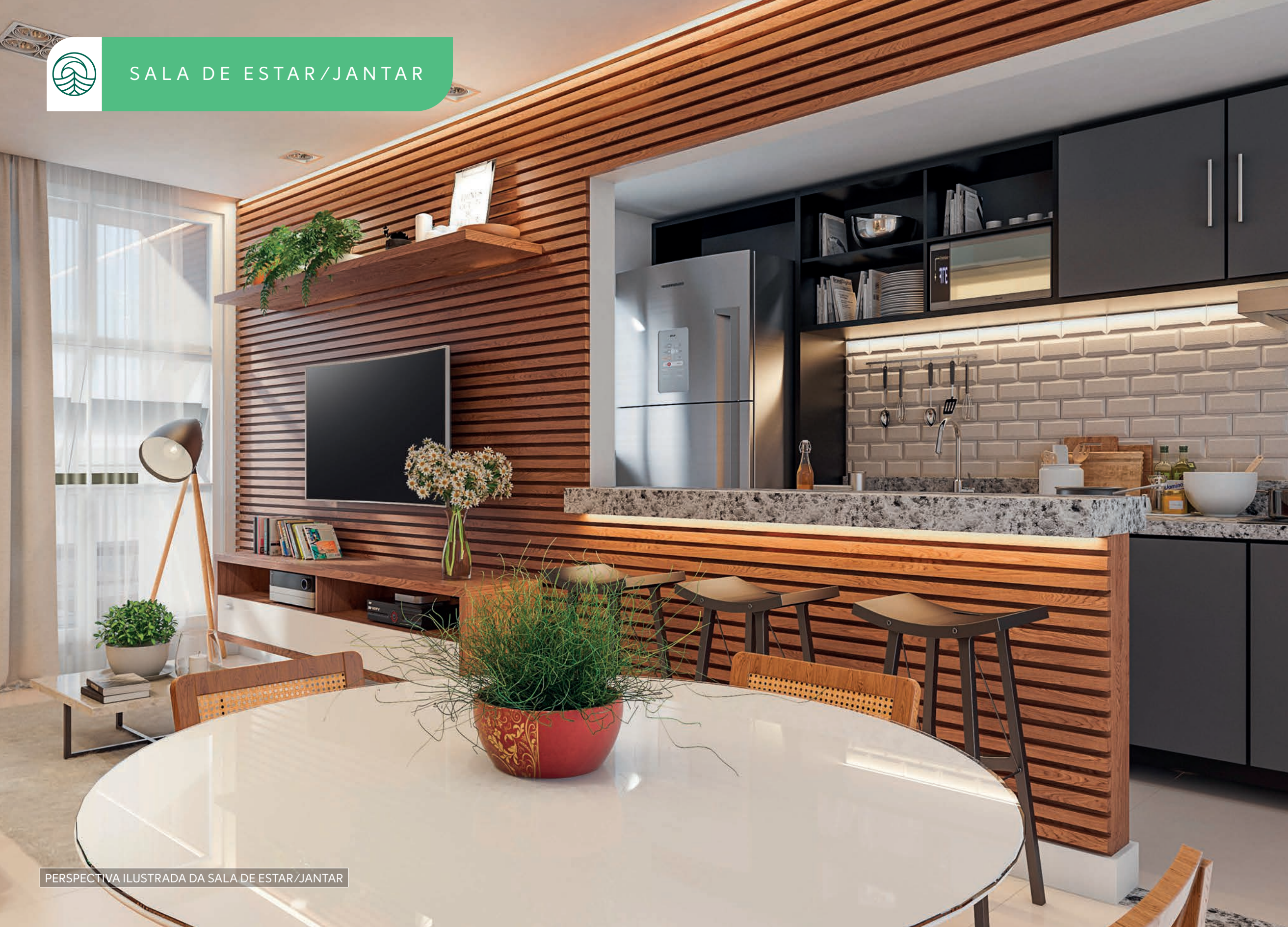
PERSPECTIVA ILUSTRADA DA SALA DE ESTAR/JANTAR