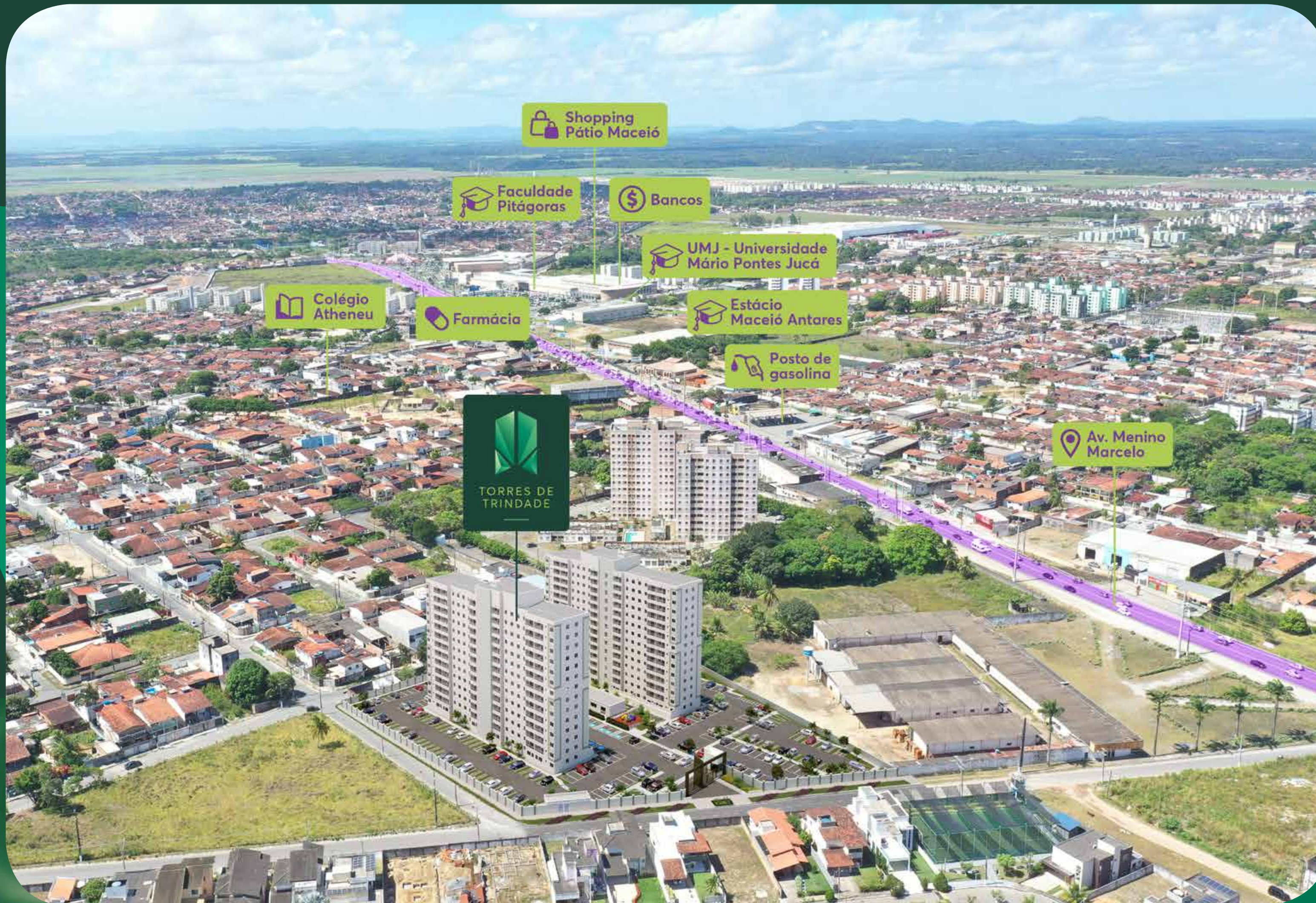
Foto aérea do local

A vida pode ser como um passeio no shopping: leve, animada e divertida.