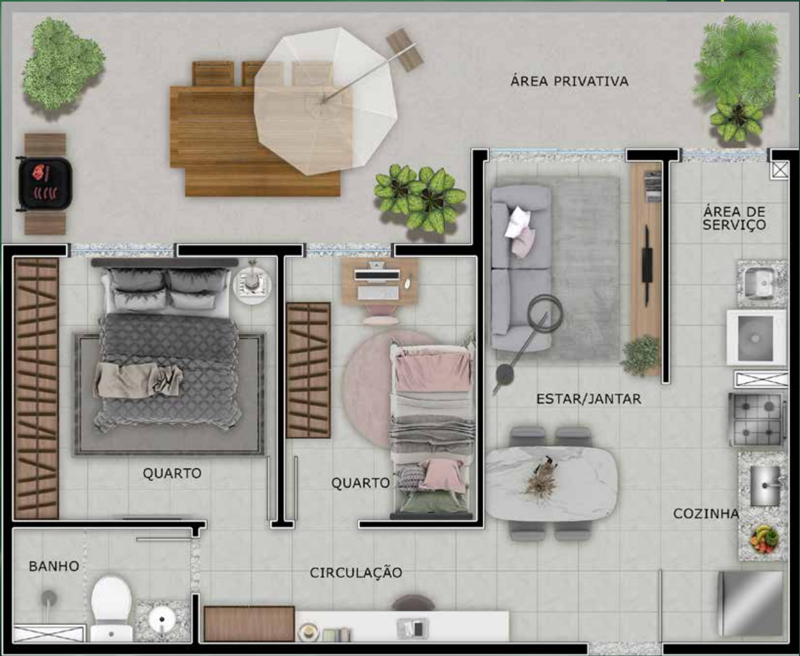
Referência: Apartamento 004 - Torre 1

Diferentes inspirações para diferentes momentos de vida.