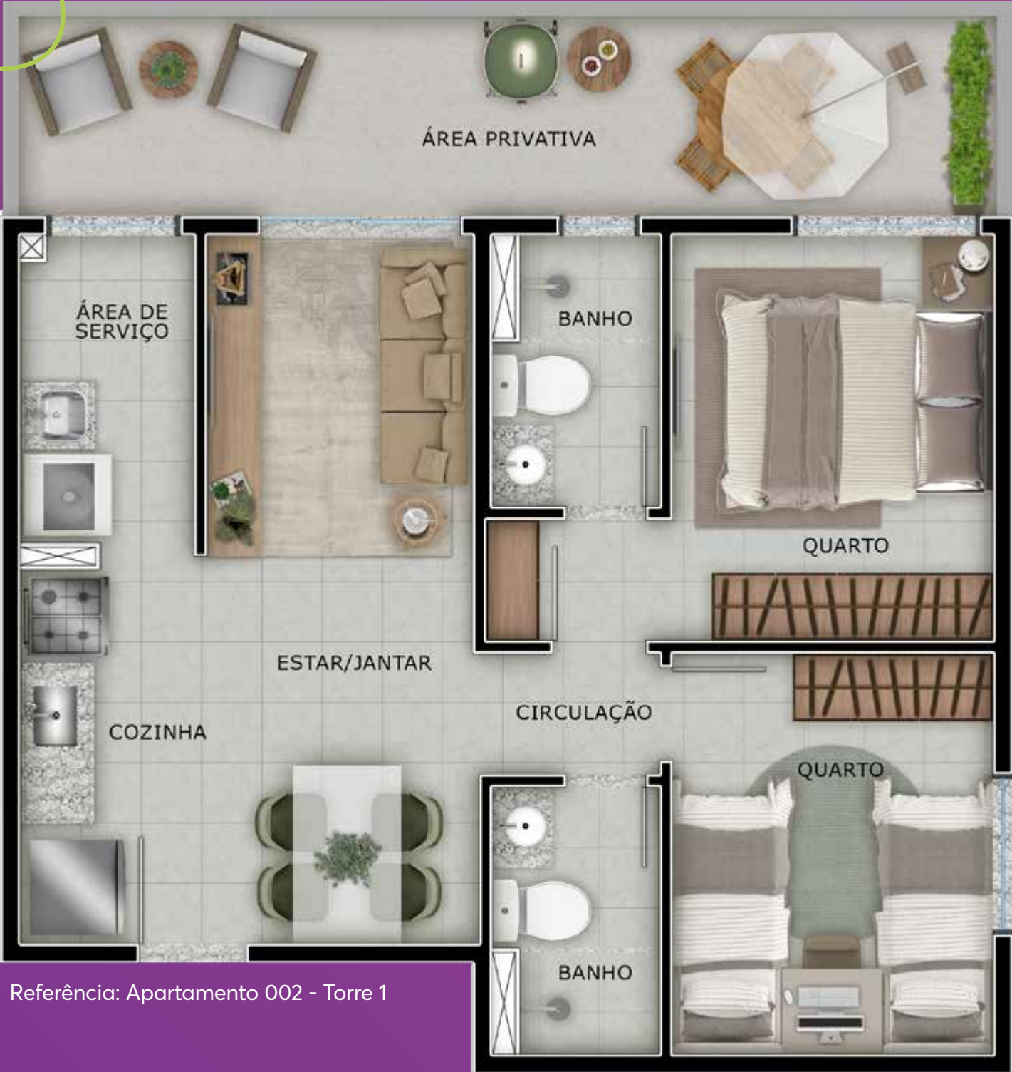
Referência: Apartamento 002 - Torre 1