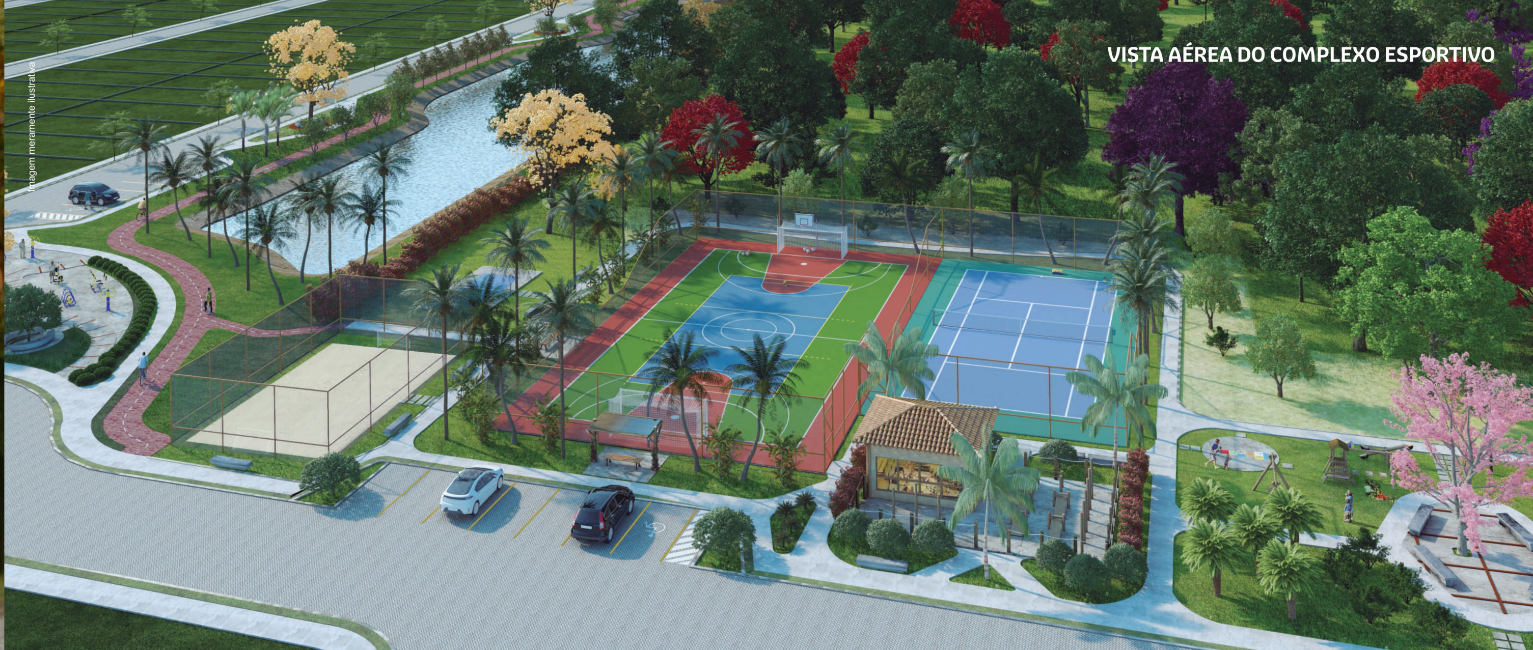
VISTA AÉREA DO COMPLEXO ESPORTIVO