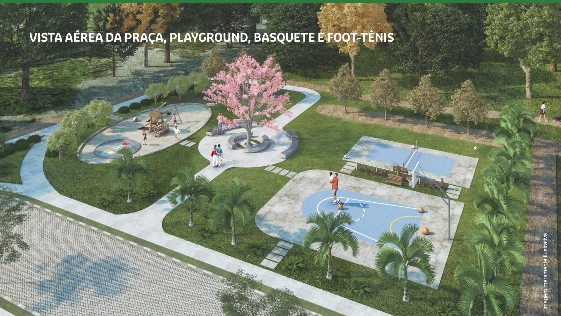
VISTA AÉREA DA PRAÇA, PLAYGROUND, BASQUETE E FOOT-TÊNIS