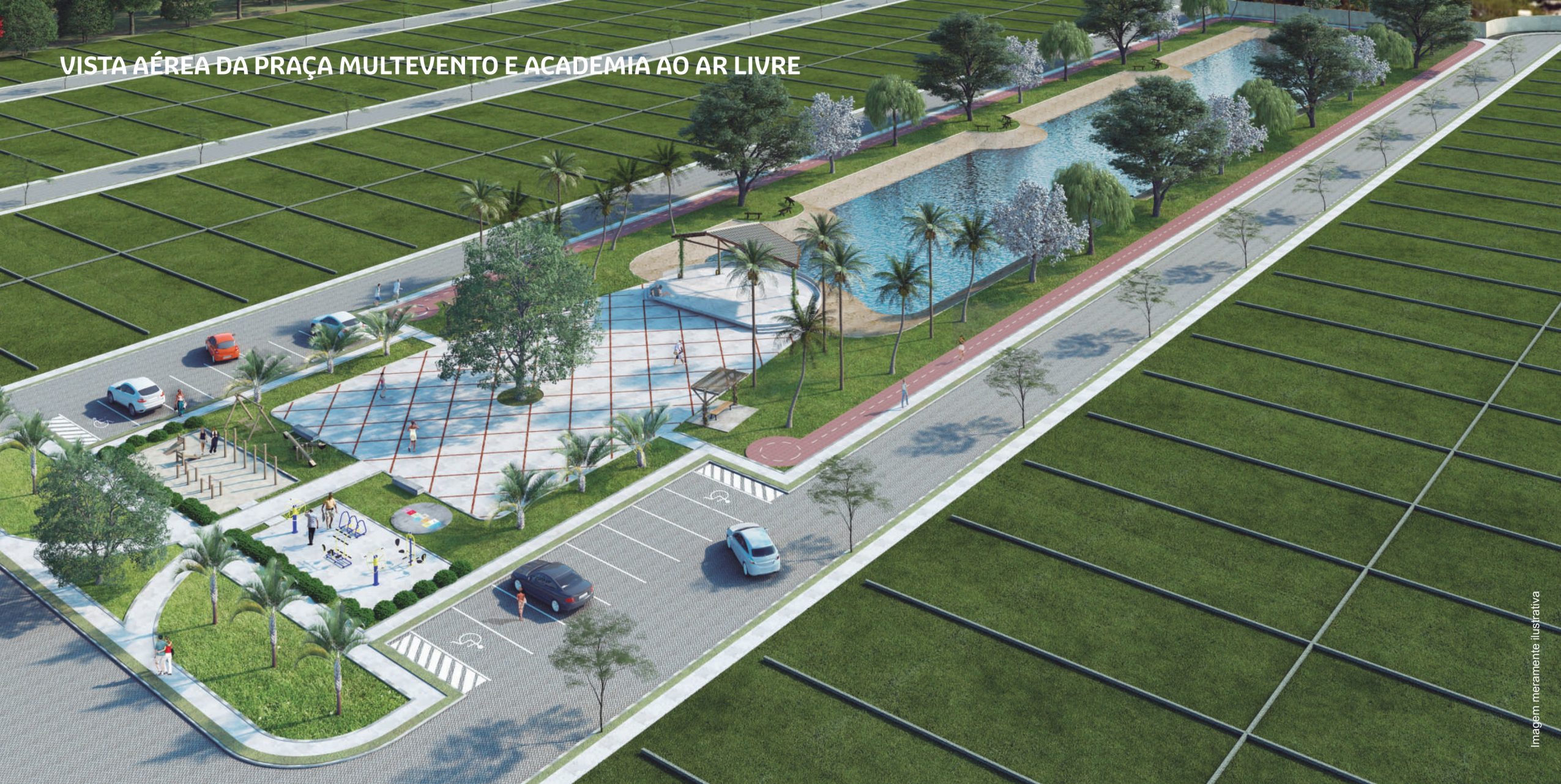
VISTA AÉREA DA PRAÇA MULTEVENTO E ACADEMIA AO AR LIVRE