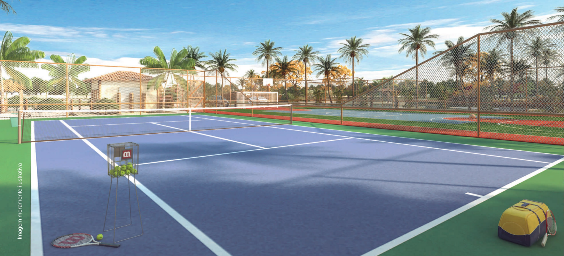
QUADRA DE TÊNIS