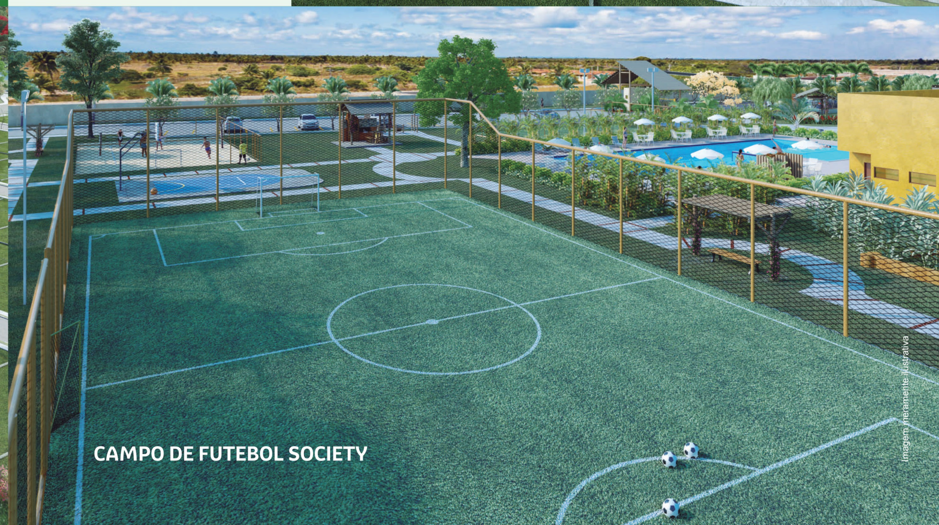
CAMPO DE FUTEBOL SOCIETY