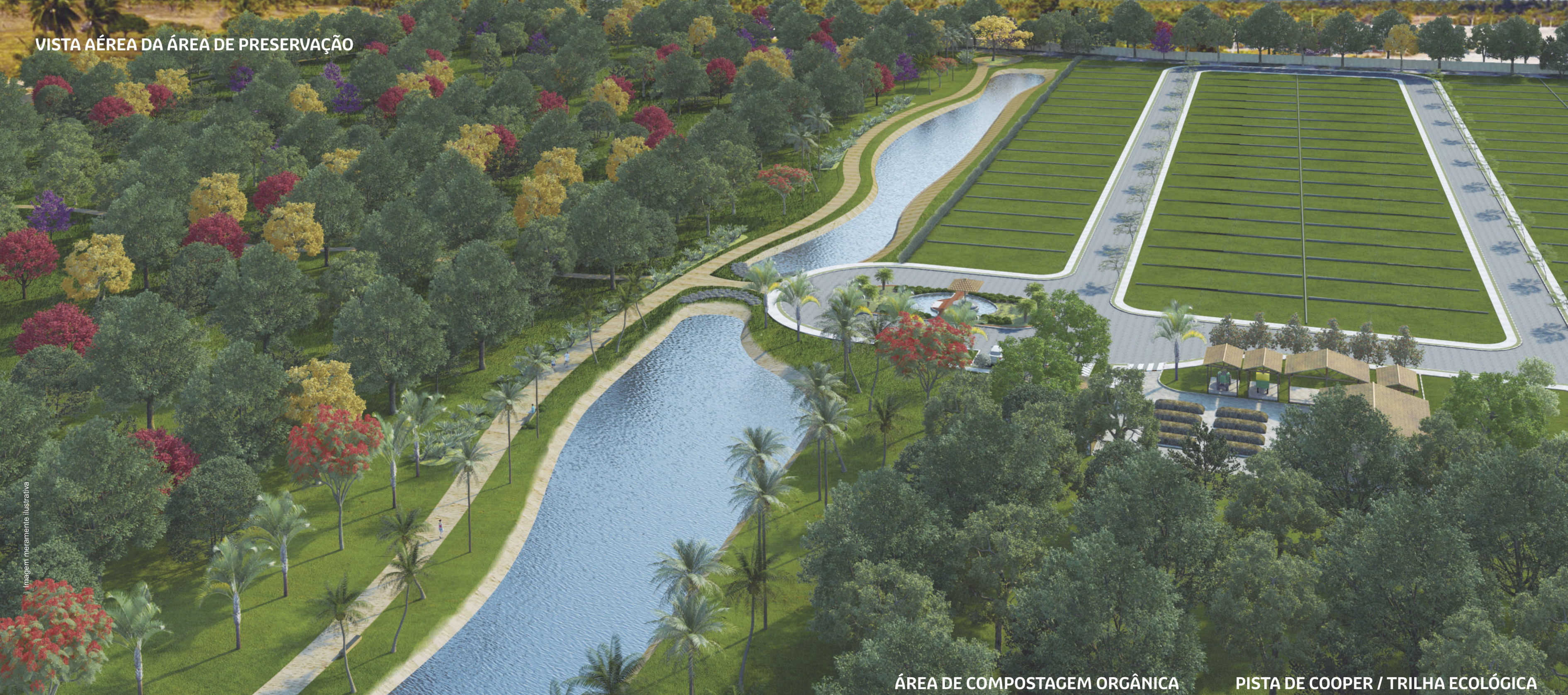
ÁREA DE COMPOSTAGEM ORGÂNICA