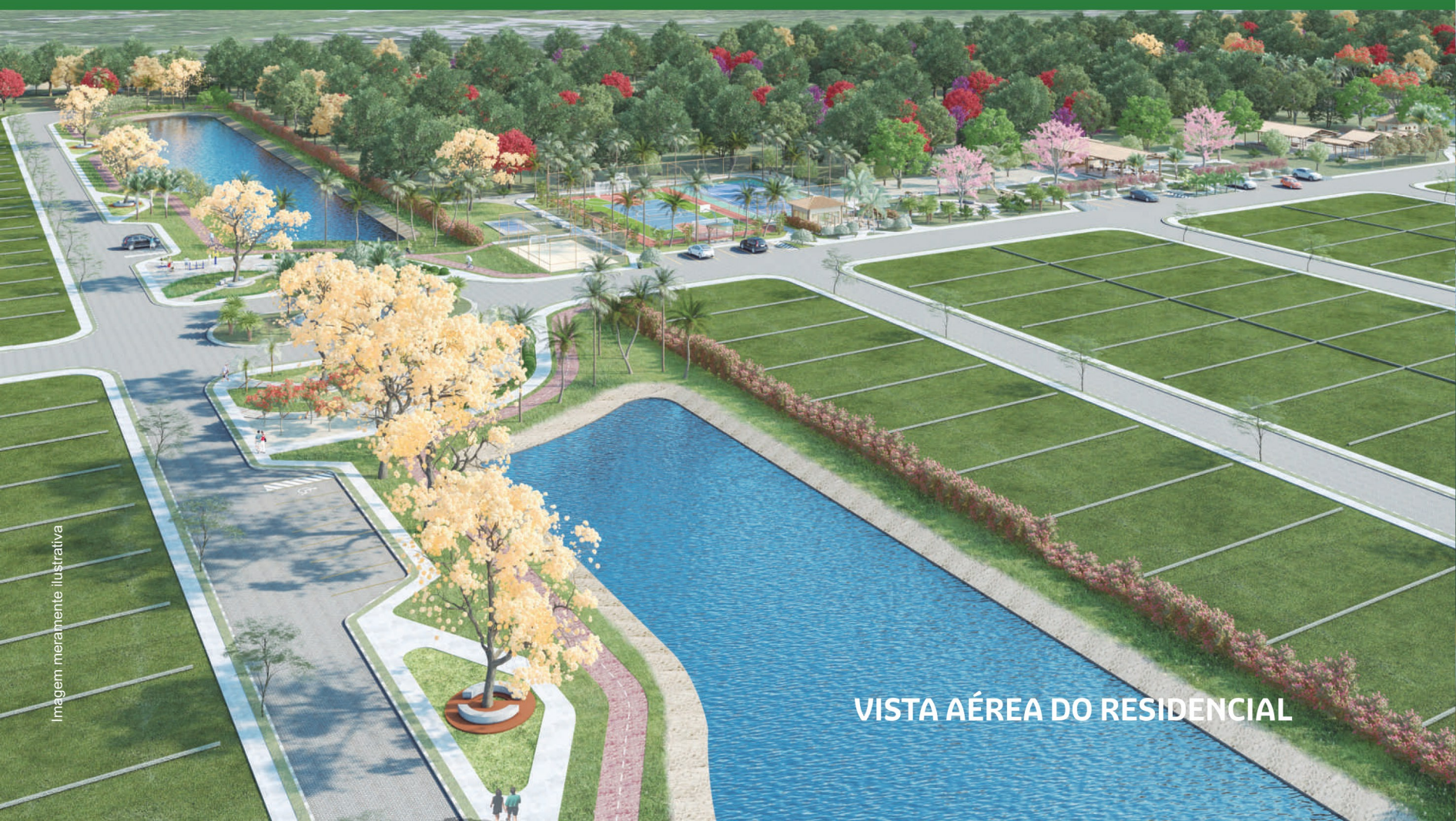
VISTA AÉREA DO RESIDENCIAL