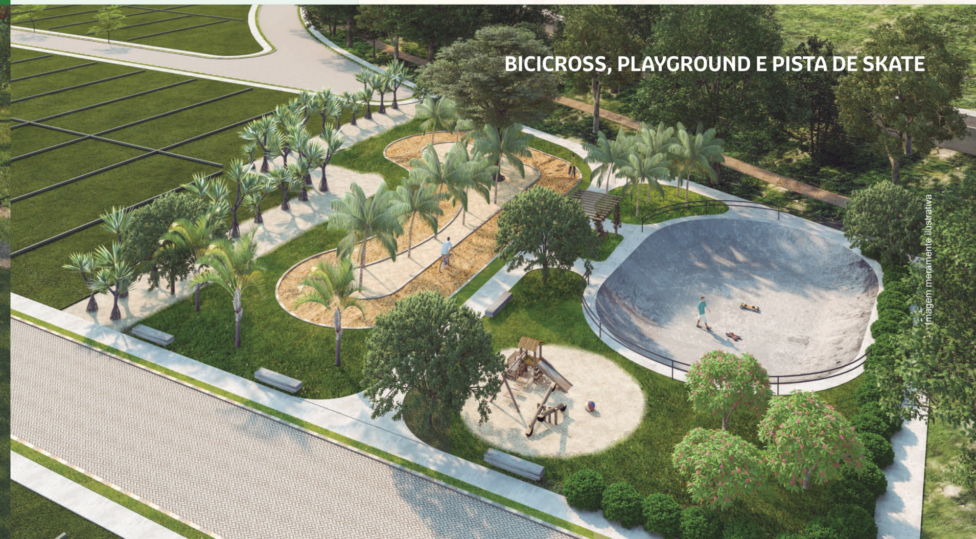
BICICROSS, PLAYGROUND E PISTA DE SKATE