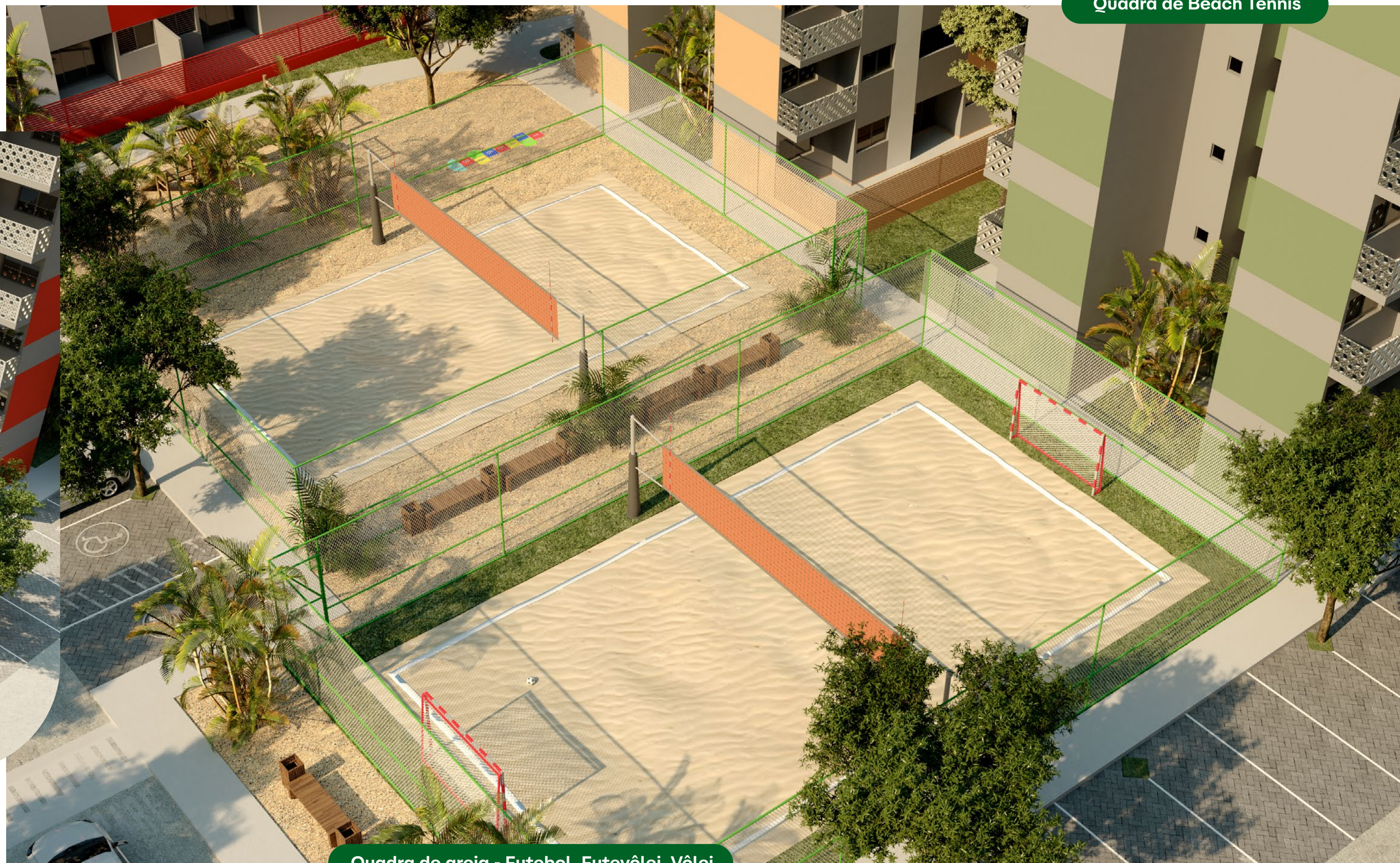
Quadra de areia - Futebol, Futevôlei, Vôlei