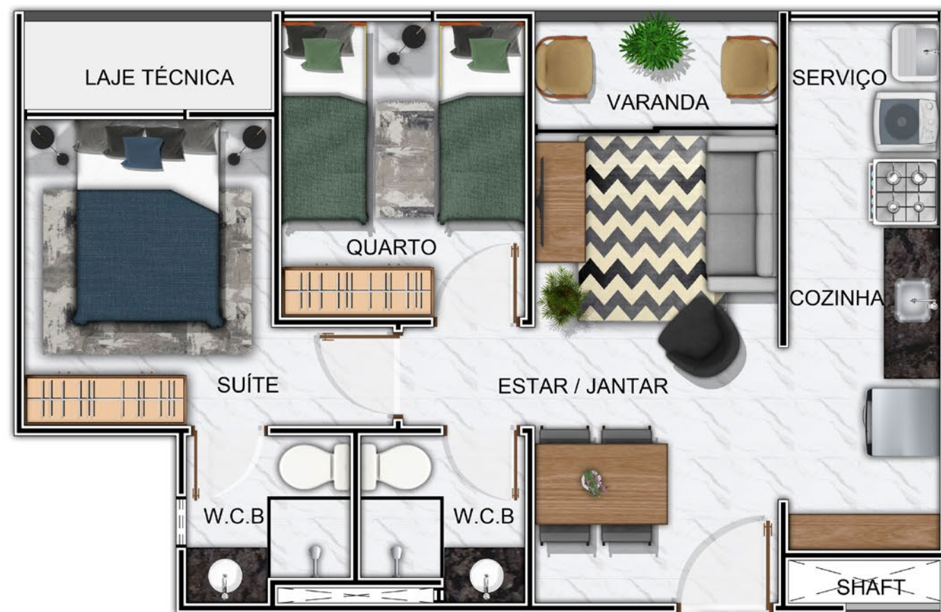
TERMINAÇÕES 01,04,05 E 08 - TIPO