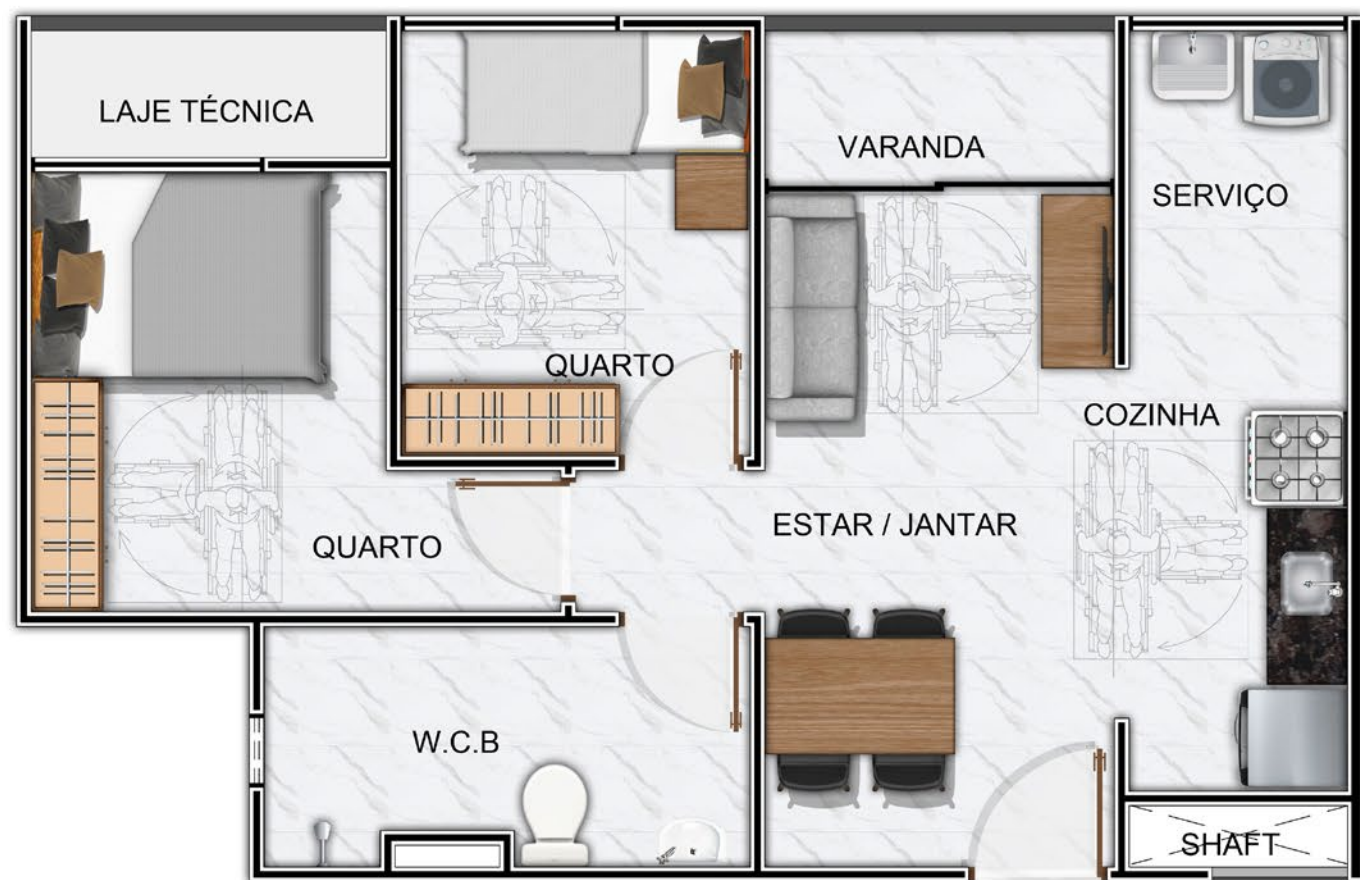
OPÇÃO PARA PNE: TERMINAÇÕES 01,04,05 E 08