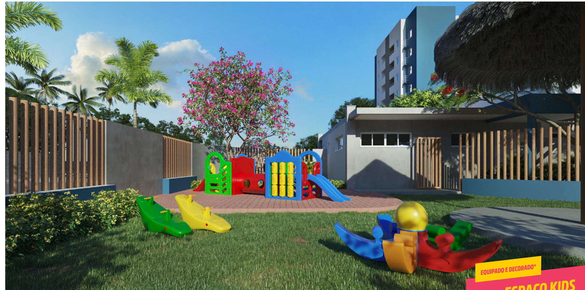
EQUIPADO E DECORADO* ESPAÇO KIDS A CRIANÇADA VAI FAZER A FESTA

*Imagem meramente ilustrativa. Espaços entregues conforme memorial descritivo.