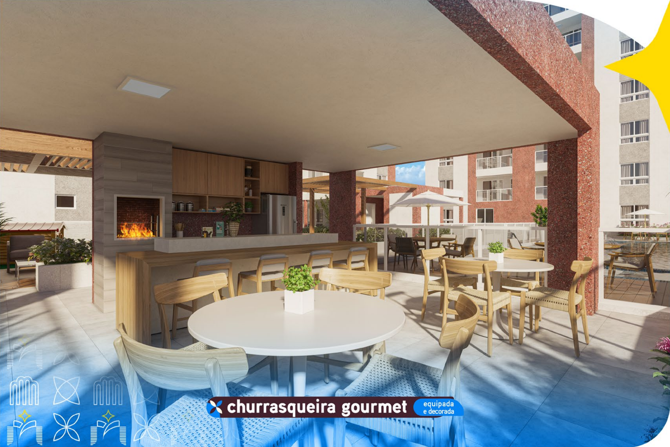
churrasqueira gourmet equipada e decorada