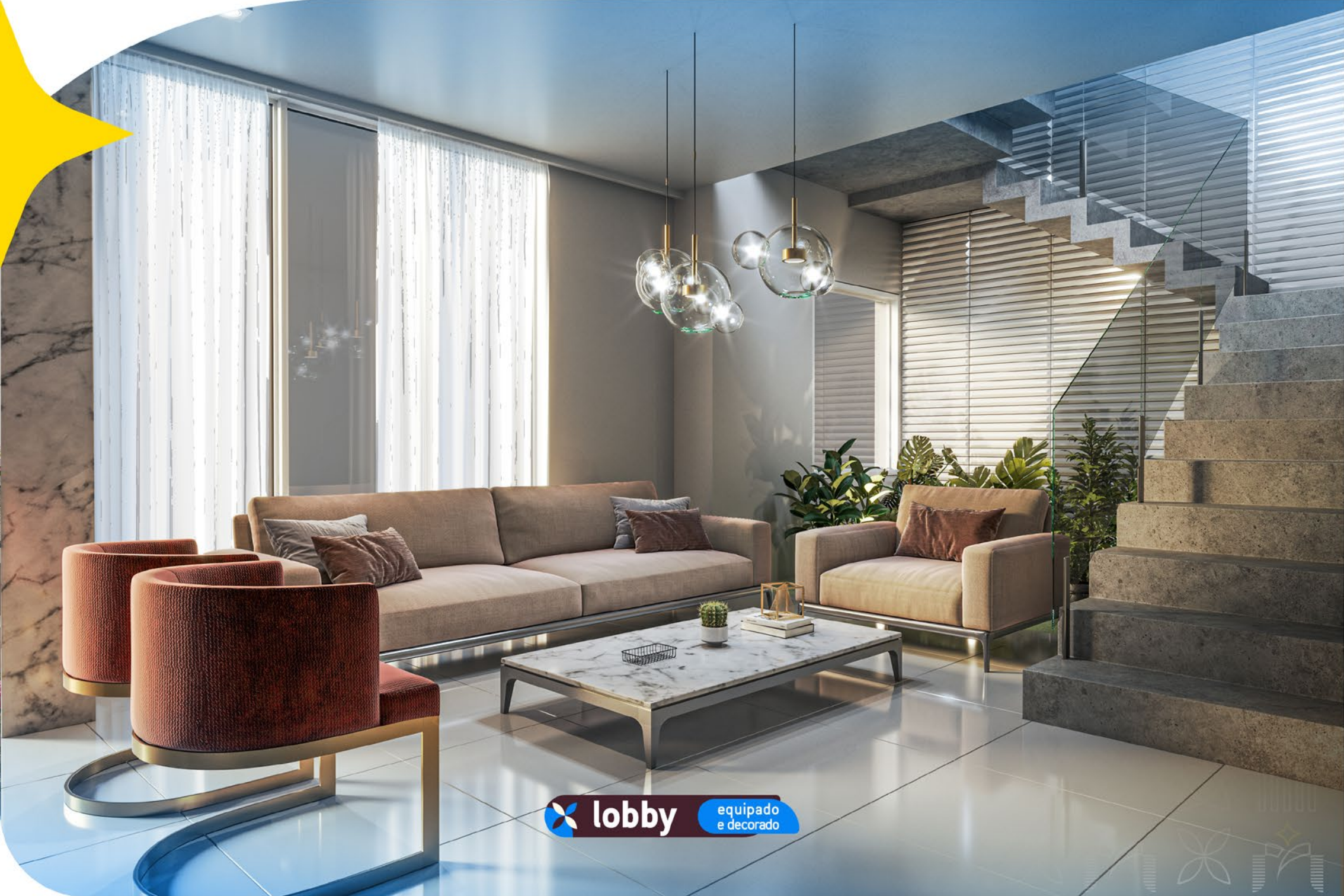
lobby equipado e decorado