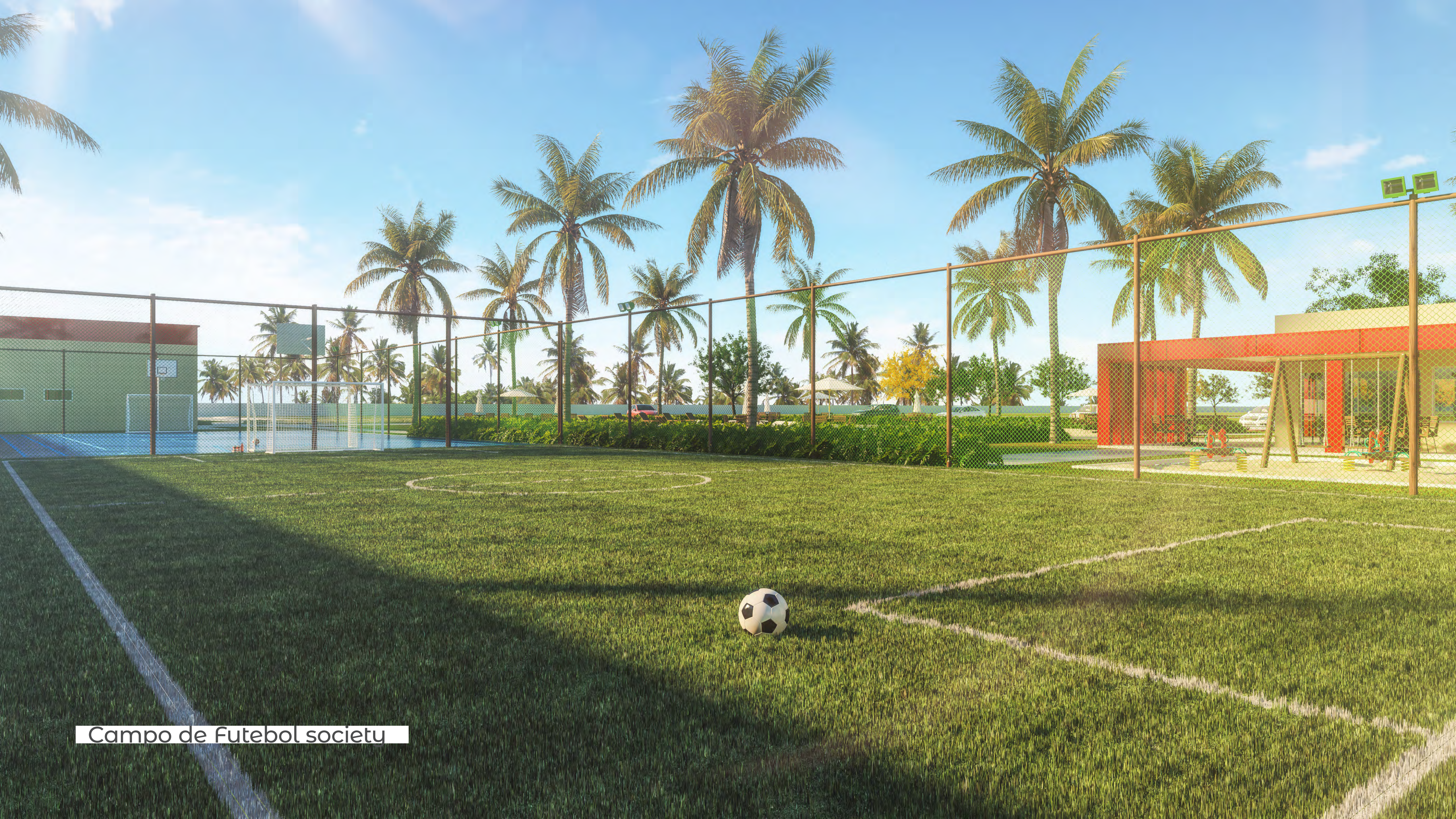
Campo de Futebol society