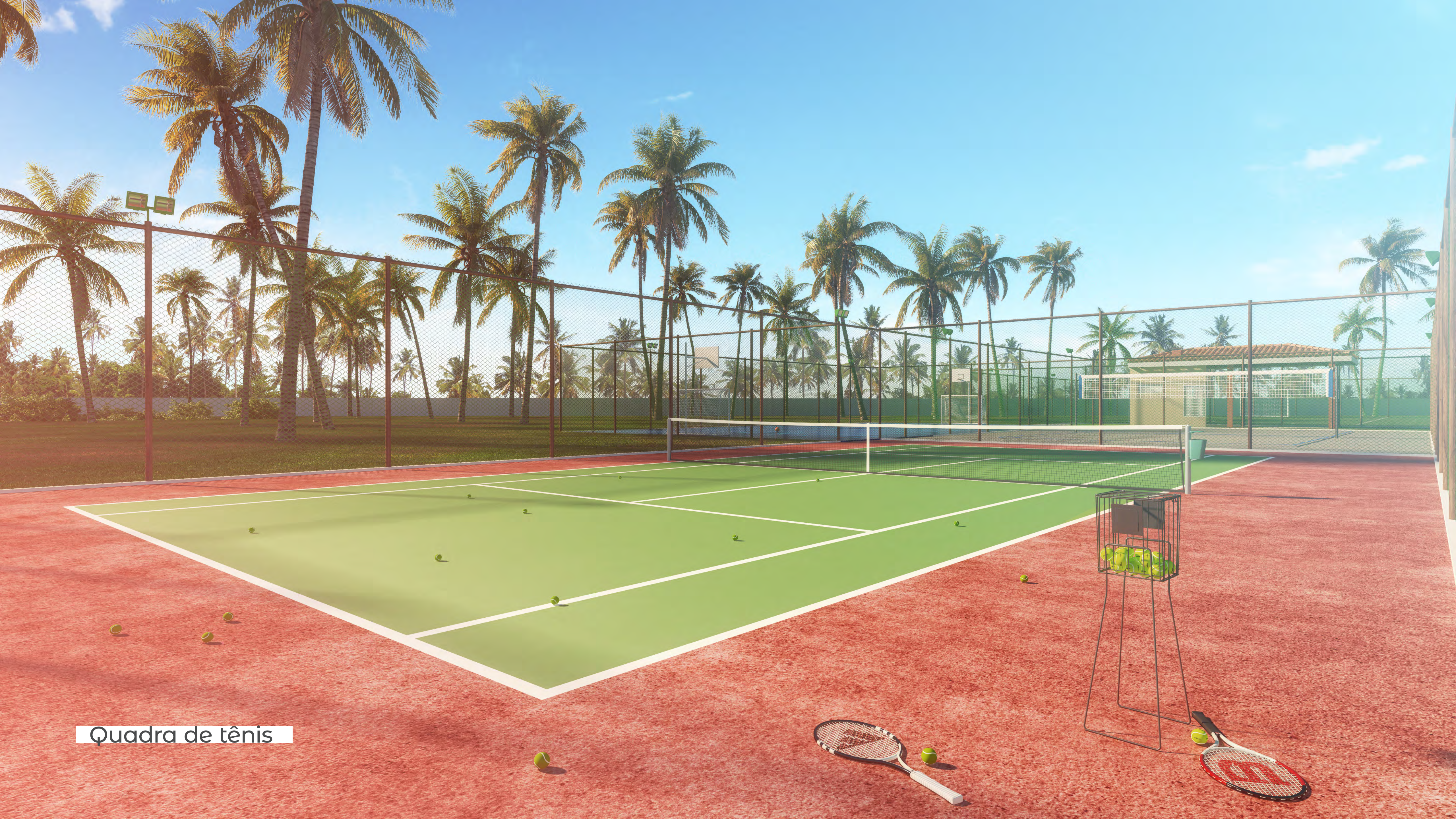
Quadra de tênis