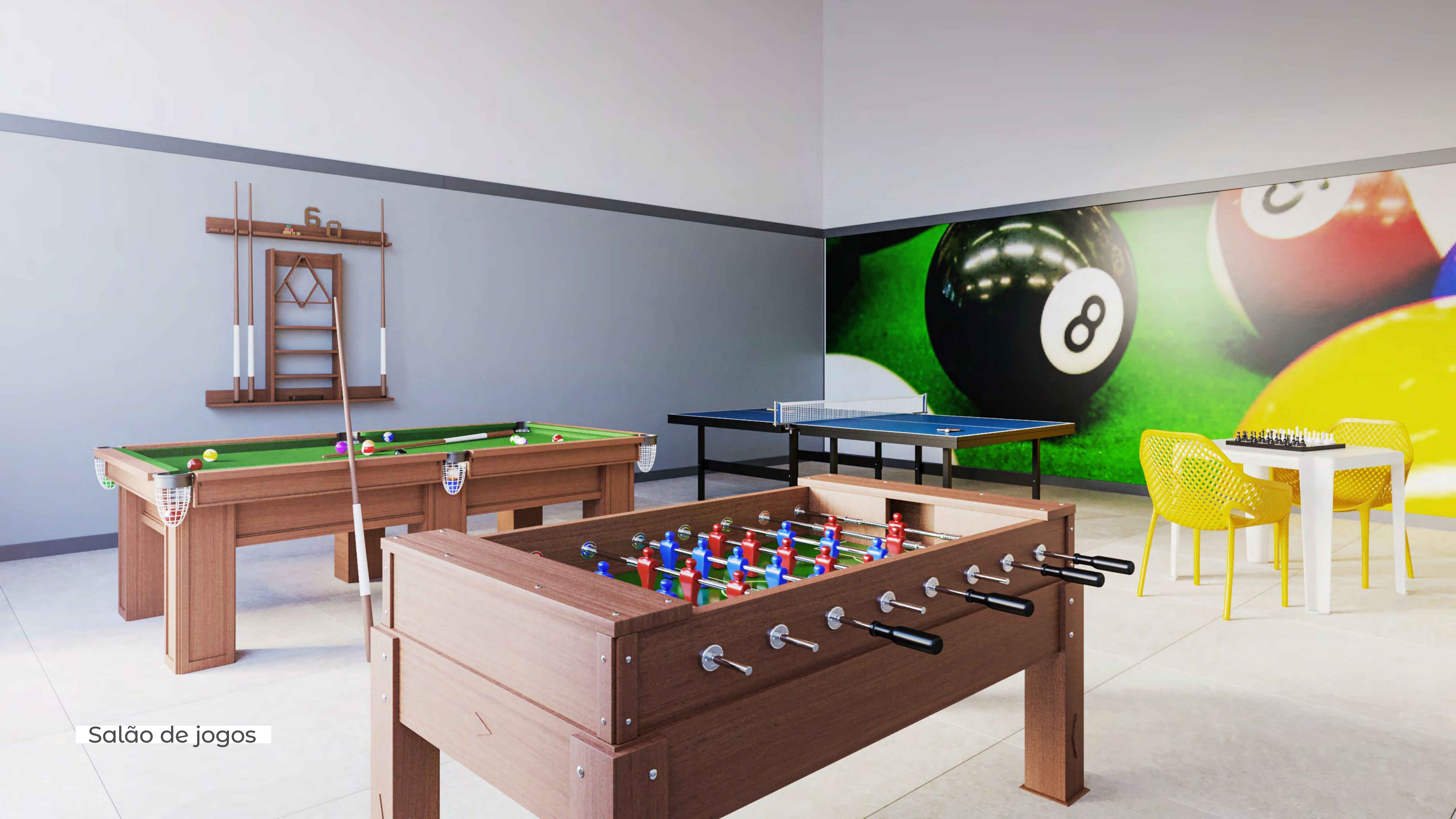
Salão de jogos