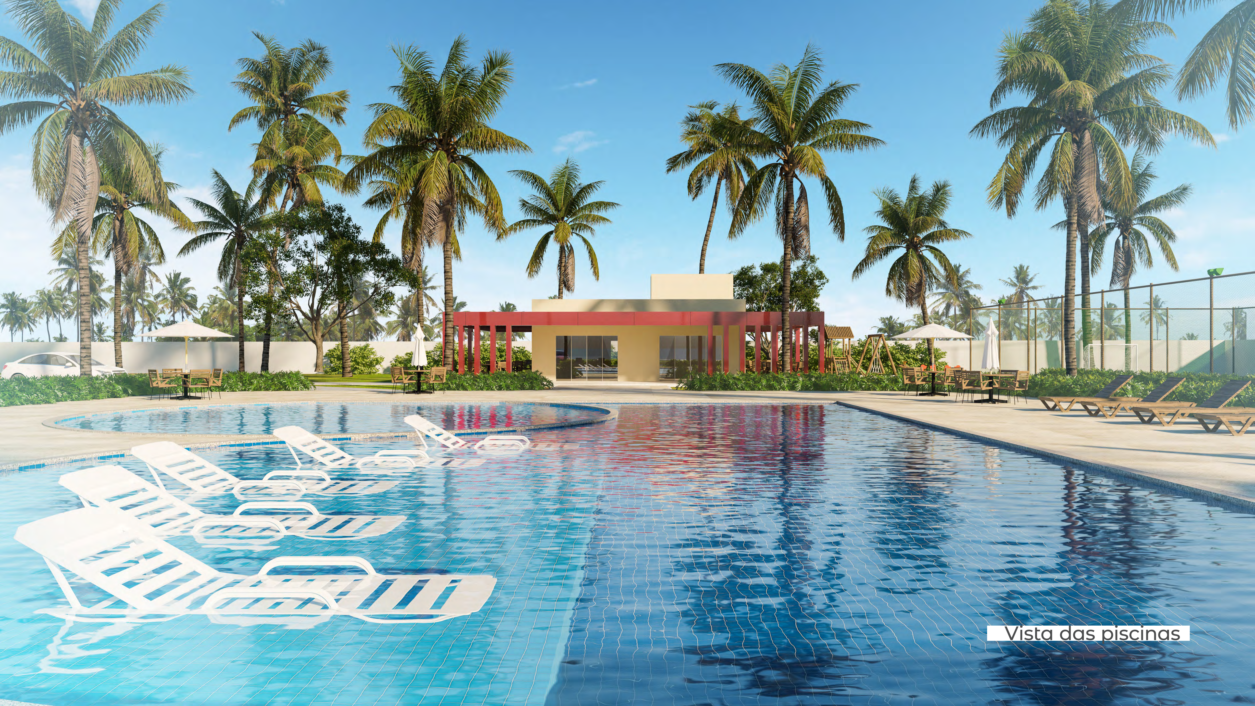
Vista das piscinas