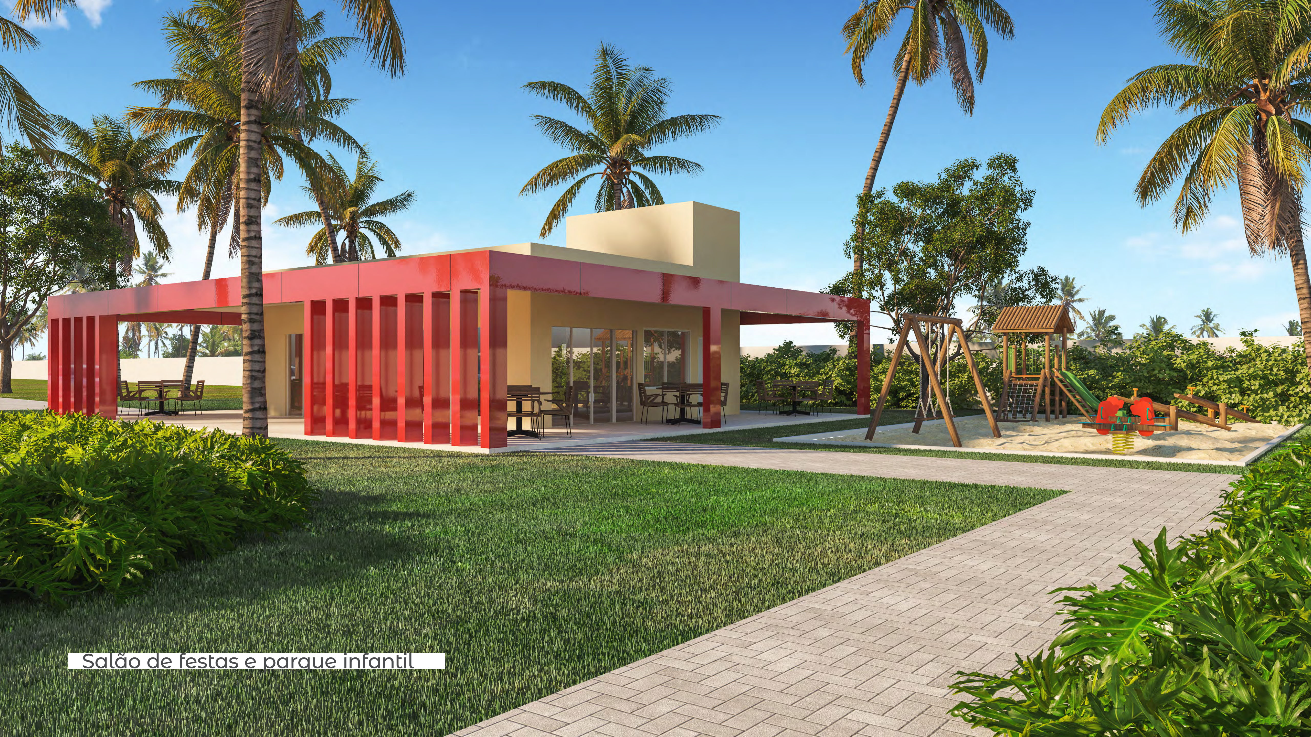
Salão de festas e parque infantil