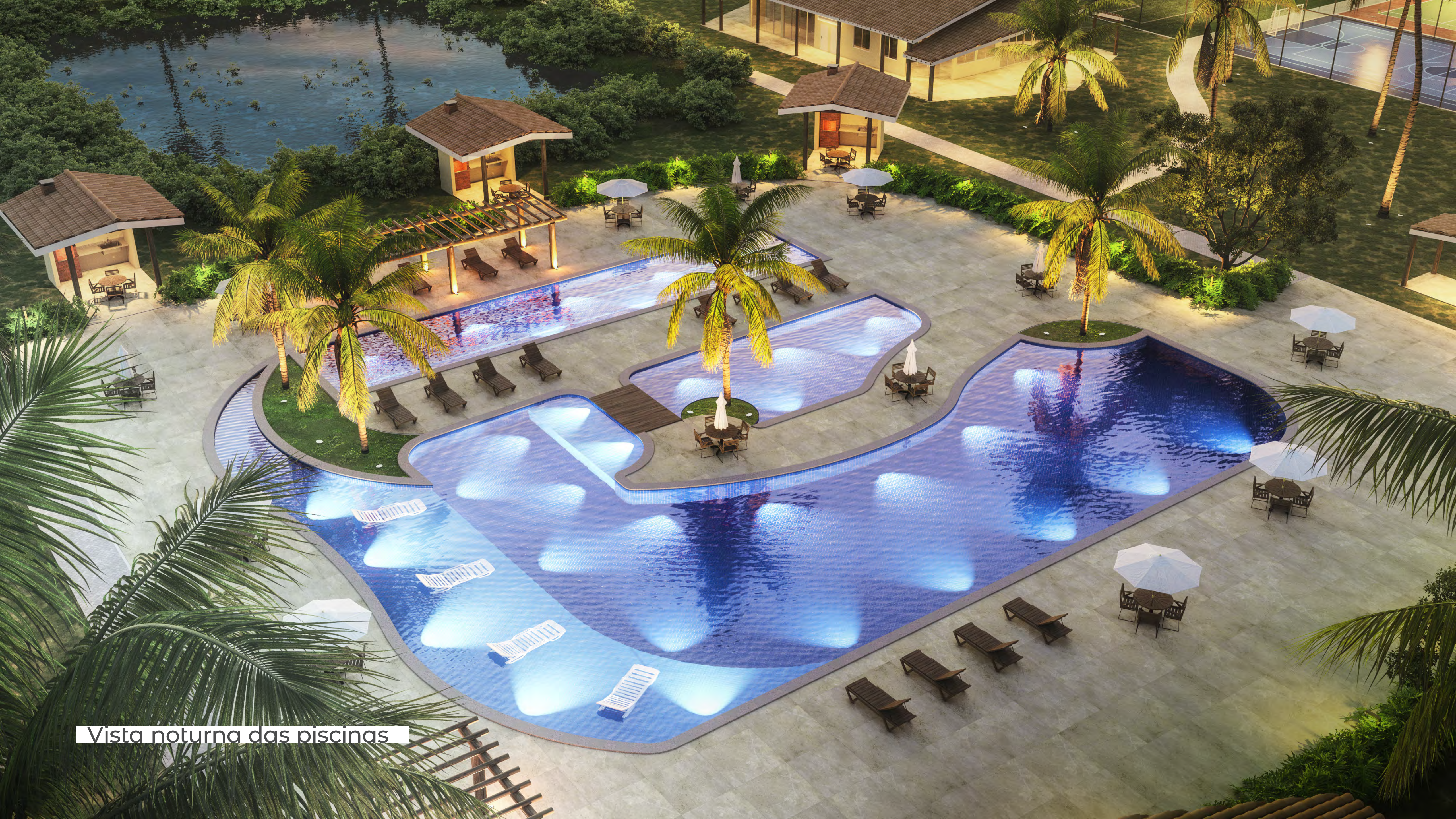
Vista noturna das piscinas